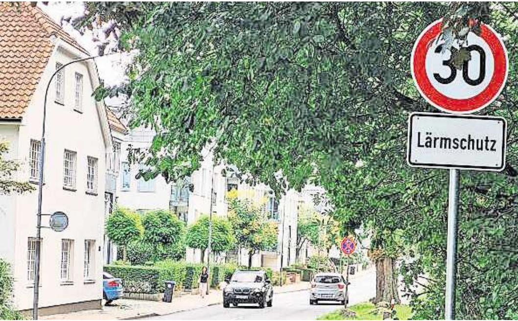
In der Wallstraße gilt jetzt die Geschwindigkeitsbegrenzung von 30 km/h – aus Lärmschutzgründen, wie das untere Schild erklärt.

Dass die Wallstraße jetzt von einer Tempo-50-Zone in eine Tempo-30-Zone umgewandelt wurde, macht eine Aktualisierung des Straßenverkehrsgesetzes (StVG) möglich. Die neue Rechtslage lässt den Behörden vor Ort mehr Spielraum bei Anordnungen. Die StVG ist die Grundlage für das Verkehrsrecht in Deutschland. Zuletzt hatten nach Angaben des ADAC Ver-