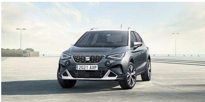
Der Kompakt SUV Seat Arona mit sportlichen Design.

Verbrauchsangaben: SEAT Arona 1.5 TSI 110 kW (150 PS): Kraftstoffverbrauch (kombiniert): 5,6-5,9 l/100km; CO 2 -Emissionen (kombiniert): 128-134 g/km; CO 2 -Klasse: D