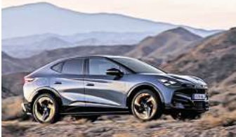
Der Cupra Tavascan.

vollelektrisches SUV-Coupé, das Attraktivität und unmittelbare Performance miteinander vereint. Das Modell verkörpert die elektrifizierte Vision von CUPRA und bleibt gleichzeitig dem damaligen Concept Car von 2019 treu. Das erste vollelektrische