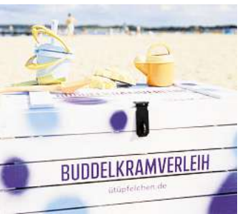
In Travemünde sollen sich auch die kleinen Gäste wohlfühlen.

Wer Lust hat, freundliche Botschaften oder Urlaubsgrüße über die sozialen Medien zu versenden, findet auf www.ütüpfelchen.de eine praktische Möglichkeit, einen Gruß mit einem schönen Bildmotiv aus dem Seebad Travemünde zu verschicken.