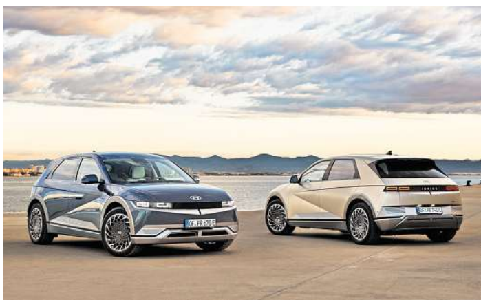
Der Hyundai IONIQ 5 bietet 800-Volt-Technologie für besonders schnelle Ladevorgänge.

Der Hyundai IONIQ 5 basiert auf der innovativen „Electric Global Modular Platform“ (E-GMP), die einzigartige Fahrzeugpropor-