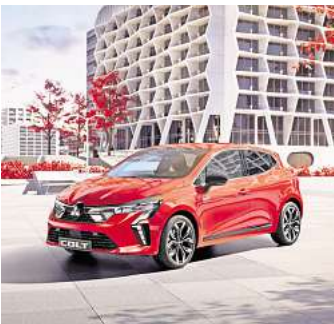
Erfährt ein Comeback: Der Mitsubishi Colt.

Mitsubishi steht für zuverlässige Fahrzeuge, die durch innovative Technologie, Effizienz und Komfort überzeugen. Während der Hausmesse im Autohaus am Bungsberg zeigt Mitsubishi-Spezialist Andreas Möhrpahl die neuesten Modelle, darunter den kompakten Space Star, den vielseitigen Colt, den robusten ASX und den dynamischen Eclipse Cross. Herr Möhrpahl steht den Besuchern für persönliche Beratung zur Verfügung und führt durch die Vorzüge dieser breiten Modellpalette. Dabei zeigt sich der Mitsubishi Colt als eines der Modelle, das den durchdachten Design und moderner Ausstat-