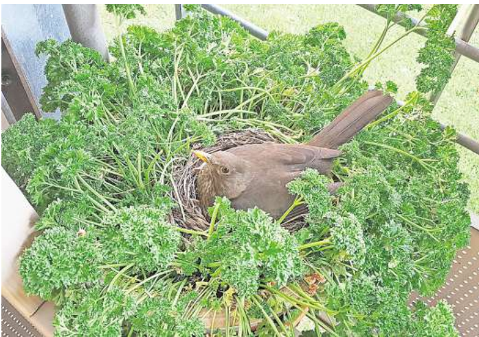
Eine Amsel brütet mitten in einem Topf mit Petersilie auf einem Balkon in Lübeck.