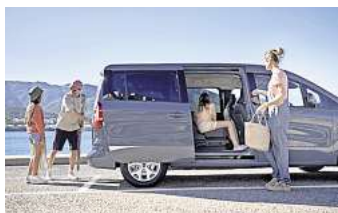
Ein Raumwunder: Nissan Townstar

Ob für Großfamilien oder den Arbeitsalltag – der Nissan Townstar Kombi L2 eignet sich für die vielfältigsten Einsätze und zeichnet sich dabei vor allem durch seine Praktikabilität aus. Die breiten Schiebetüren ermöglichen einen leichten Zugang zur zweiten und