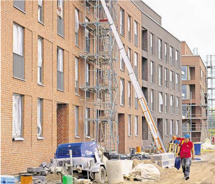
Auf dem Gelände des früheren Güterbahnhofs in Lübeck entsteht ein neues Wohnviertel.

Nach Zahlen des Zensus standen im Mai 2022 insgesamt 3487