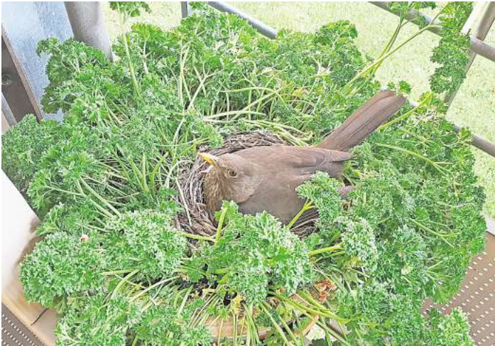
Eine Amsel brütet mitten in einem Topf mit Petersilie auf einem Balkon in Lübeck.

Dem Nabu sind seit Jahresbeginn bundesweit mehr als doppelt so viele kranke oder tote Vögel gemeldet worden wie im Vergleichszeitraum 2023. So gab es über die Meldeseite des Bundesverbandes nabu.de bundesweit bislang 1536 Hinweise auf 1806