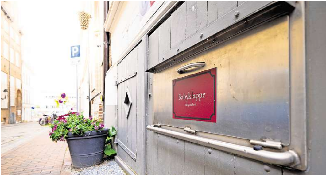
In die Lübecker Babyklappe wurde in der Nacht 20. August ein kleines Mädchen gelegt.

Dort hat sie die kleine Katharina noch am selben Tag besucht.