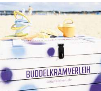
In Travemünde sollen sich auch die kleinen Gäste wohlfühlen.

den teilnehmenden Geschäften, Hotels und gastronomischen Betrieben sind auf www.ütüpfelchen.de zu entdecken. Und auch an ein Ü-Tüpfelchen für die Ohren mittels Playlist wurde gedacht. Wer Lust hat, freundliche Botschaften oder Urlaubsgrüße über die sozialen Medien zu versenden, findet auf www.ütüpfelchen.de eine praktische Möglichkeit, einen Gruß mit einem schönen Bildmotiv aus dem Seebad Travemünde zu verschicken.