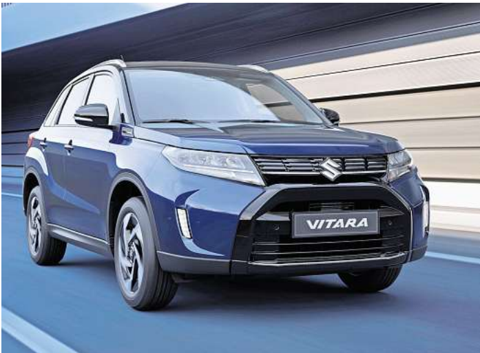
Populärer City-SUV: der Suzuki Vitara

Im Zuge des Facelifts schärft Suzuki das Design und wertet