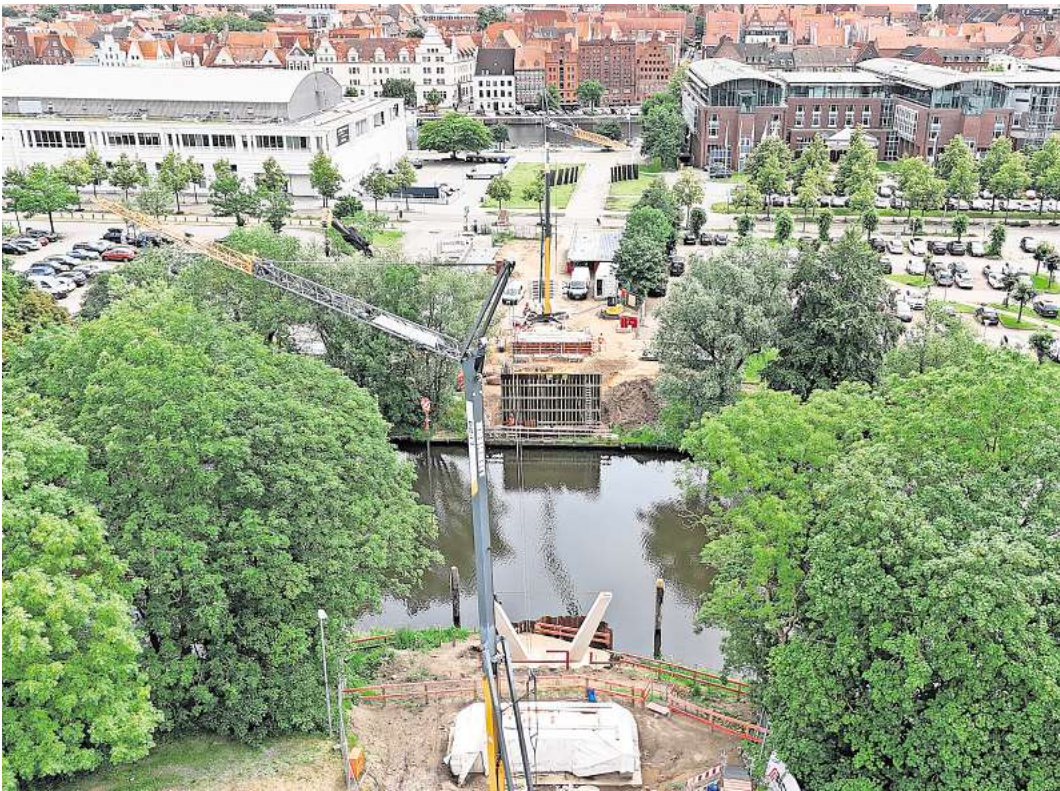
Ein Luftbild der Baustelle Stadtgrabenbrücke in Lübeck im Juni, bald werden nun die Brückenteile montiert.

LÜBECK. Der Bau der Stadtgrabenbrücke befindet sich auf der Zielgeraden: Von Dienstag, 3. September, bis Mittwoch, 4. September, werden die vorgefertigten Brückenteile eingehoben. Das teilte die Stadt gestern mit. Hierfür werden bereits ab Montag, 2. September, die erforderlichen Kräne aufgebaut. Am Dienstag werden zunächst die seitlichen Felder der Brücke auf die Widerlager und die Pfeiler gelegt. Das westliche Brückenteil muss für den Einhub zunächst noch von der Baustelleneinrichtungsfläche an der Konrad-Adenauer-Straße, um das Senioren- und Pflegeheim Domicil herum, zur Einhubstelle an der Werner-Kock-Straße transportiert werden. Hierfür ist ein Sondertransport erforderlich, der zu einer kurzzeitigen Sperrung sowie zu Halteverboten in den beiden betroffenen Straßen führt. Ab etwa 9 Uhr erfolgt dann der erste Einhub. Das östliche und das mittlere Teil liegen bereits auf der östlichen Baustelleneinrichtungsfläche in unmittelbarer Nähe des Einbauorts. Sie können somit direkt von dort aus in ihre Endlage gehoben werden. Das Seitenteil wird ebenfalls am Dienstag eingehoben. Am Mittwoch ab etwa 7 Uhr wird dann das mittlere Bauteil zwischen die Seitenfelder gehängt. Im Anschluss an den Einhub der Brückenteile, erfolgt in den