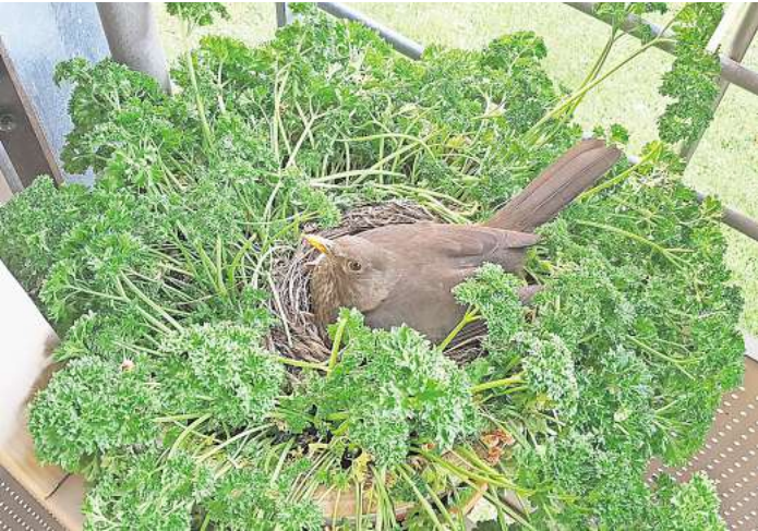
Eine Amsel brütet mitten in einem Topf mit Petersilie auf einem Balkon in Lübeck.