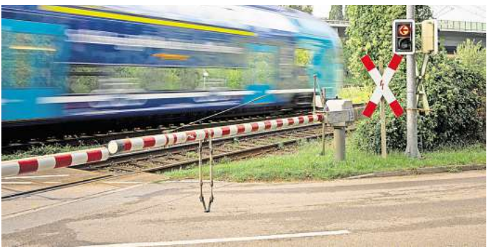
Der Bahnübergang auf die Teerhofinsel an der Grenze zwischen Lübeck und Bad Schwartau soll wegfallen.