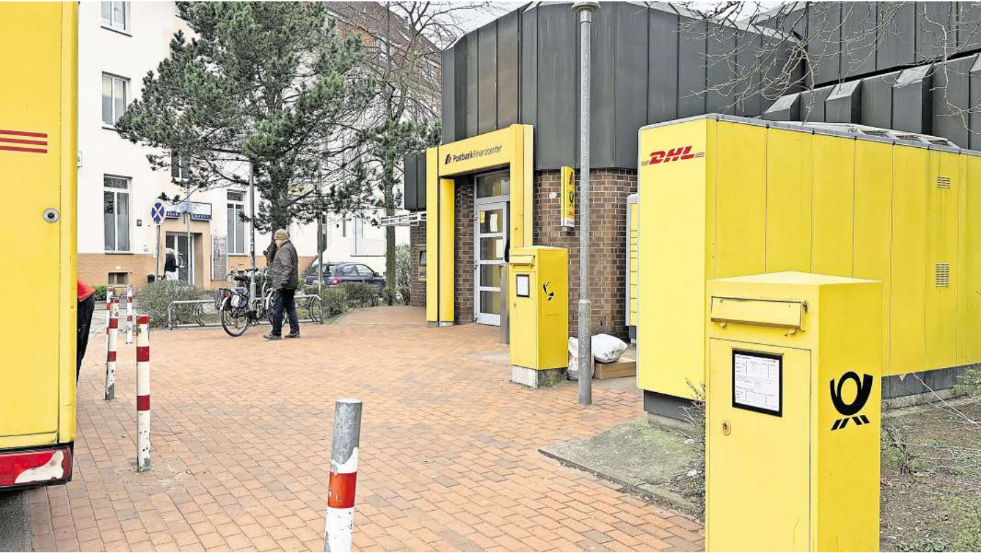
Die Postbank-Filiale am Lübecker Meesenring steht auf der Streichliste des Unternehmens.