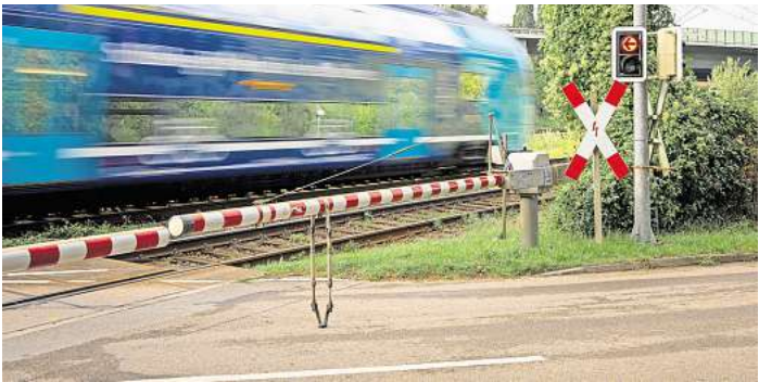
Der Bahnübergang auf die Teerhofinsel an der Grenze zwischen Lübeck und Bad Schwartau soll wegfallen.