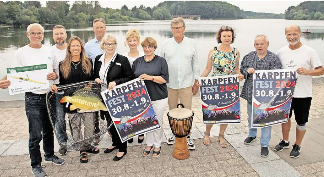
Veranstalter und Akteure freuen sich auf das Karpfenfest Reinfeld.