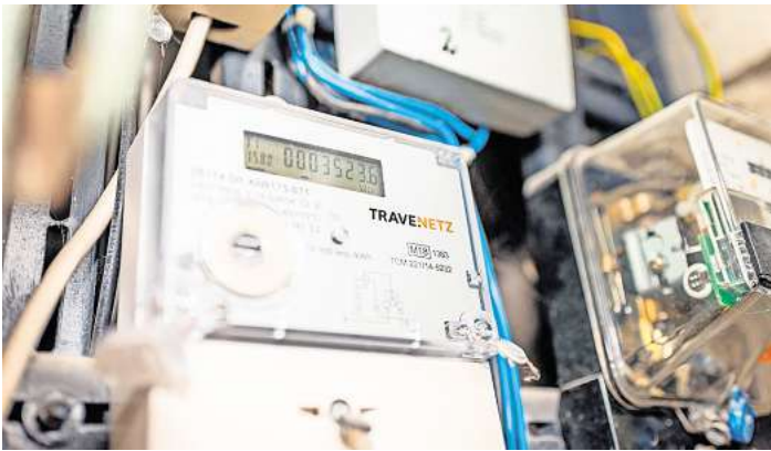
Telefonwerber fragen Stadtwerke-Kunden nach der Zählernummer, mit der dann ein Anbieterwechsel eingeleitet werden kann.