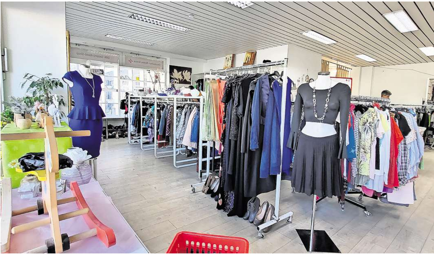
Der Second-Hand-Laden „TrendReich“ des DRK in der Ziegelstraße bietet neben Bekleidung auch Spielsachen an.

SCHLUTUP. Ein Sommerfest findet am Samstag, 24. August, von 11 bis 20 Uhr im Freibad Schlutup statt. Darauf darf sich gefreut werden: mit dem Ball über das Wasser laufen, die Musikexperten von Eurokidz erleben, Popcorn und Snacks essen, Outdoor-Spiele ausprobieren, eine Station von der Kreativwerkstatt kennenlernen und vieles mehr.