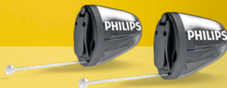
Im-Ohr Hörsysteme HearLink IIC 030