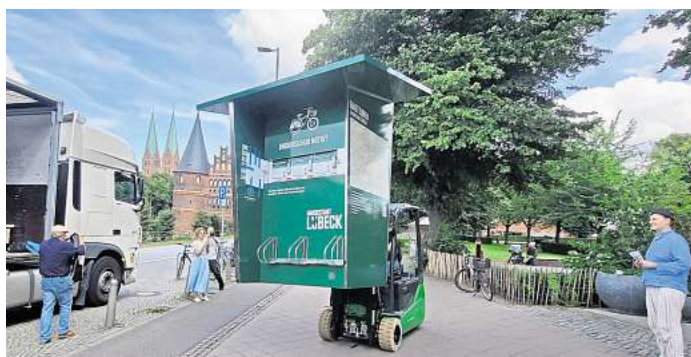
Am Holstentorplatz wurde eine neue E-Bike-Ladesäule angeliefert und aufgestellt.

Der sogenannte „Solar Lade-Meeting-Point“ befindet sich vor der Terrasse der Tourist-Information. Hier können Lübecker und Touristen kostenlos ihre E-Bikes, E-Roller und Elektro-Rollstühle laden. Außerdem gibt es sechs Schließfächer zum Laden von Mobilgeräten und Akkus. „Nutzen Sie dieses neue Angebot nach Herzenslust“, fordert Umweltsenator Ludger Hinsin die