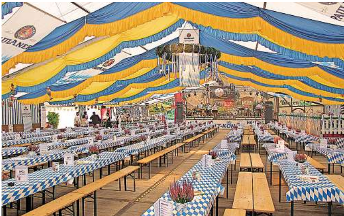
Bis 1000 Feierlustige finden Platz im bajuwarisch geschmückten Festzelt.

Veranstalter: Henning König, Tel. 04508/ 403