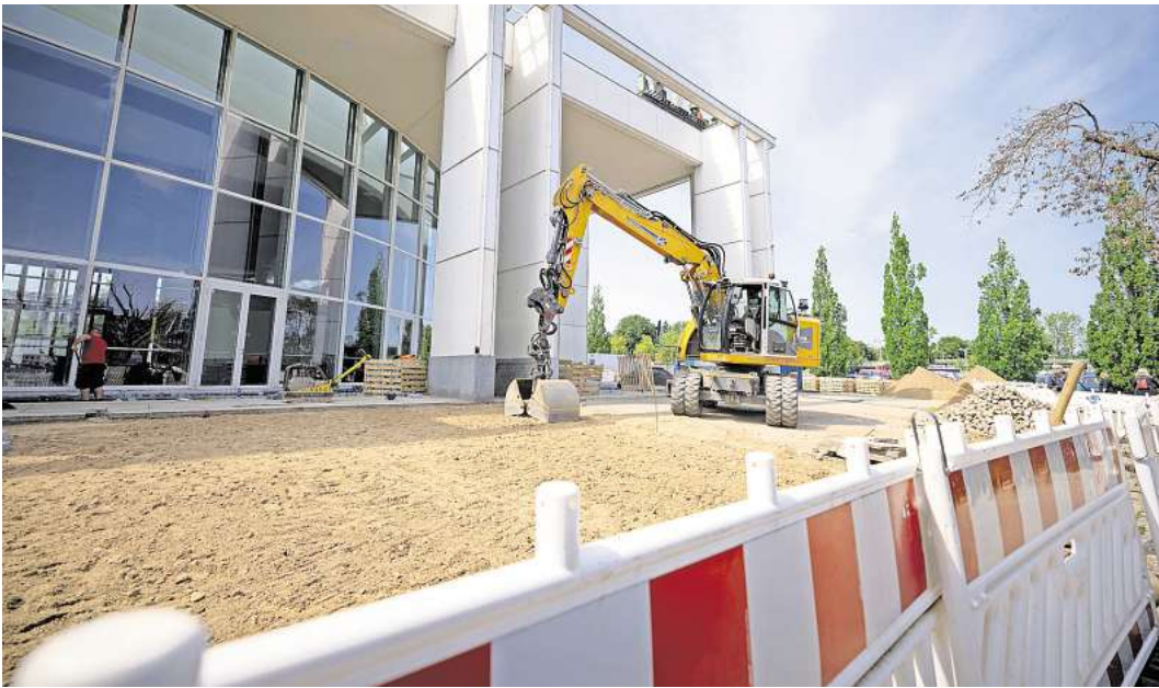
Der Außenbereich der Musik- und Kongresshalle wird derzeit neu gepflastert. Aber auch im Inneren des Gebäudes wird gearbeitet.

ren auch andere Bereiche angepackt worden. Der zweite Bauabschnitt ist im Sommer 2023 beendet worden. Alle geplanten Maßnahmen konnten bis dahin noch nicht umgesetzt werden. Und zu allem Überfluss müssen nun manche Bereiche erneut angefasst werden. DECKEN UND WÄNDE MÜSSEN ERNEUT GEÖFFNET WERDEN „Aufgrund einer nicht einwandfreien Ausführungsplanung der technischen Gewerke kam es zu einer mangelhaften Ausführung beim Verlegen der Leitungen“, sagt Stadtsprecherin Nicole Dorel. Jetzt seien hochbauliche Maßnahmen wie das Öffnen von Wänden und Decken notwendig. „Die Arbeiten betreffen insbesondere die Flure um den Konzertsaal und die weiteren Bereiche außerhalb des Konzertsaaals.“ ARBEITEN AN TECHNISCHEN ANLAGEN Wer trägt die Kosten dafür? Befindet die Stadt sich deswegen in einem Rechtsstreit mit den verantwortlichen Firmen? Nicole