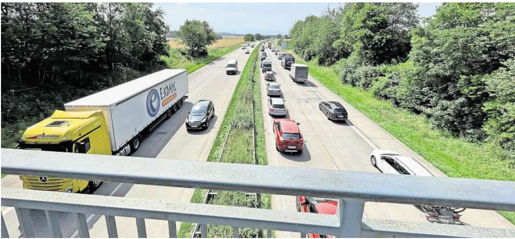
Staus – wie hier zwischen Pansdorf und Ratekau auf der A1 – wird es auch in den nächsten Jahren noch häufiger geben.

Eine Erneuerung der Deckschicht mit offenporigem Asphalt ist zwischen der Anschlussstelle Lübeck-Zentrum, Bad Schwartau, bis zur Ausfahrt Sereetz geplant. Beide Richtungsfahrbahnen sollen zwischen