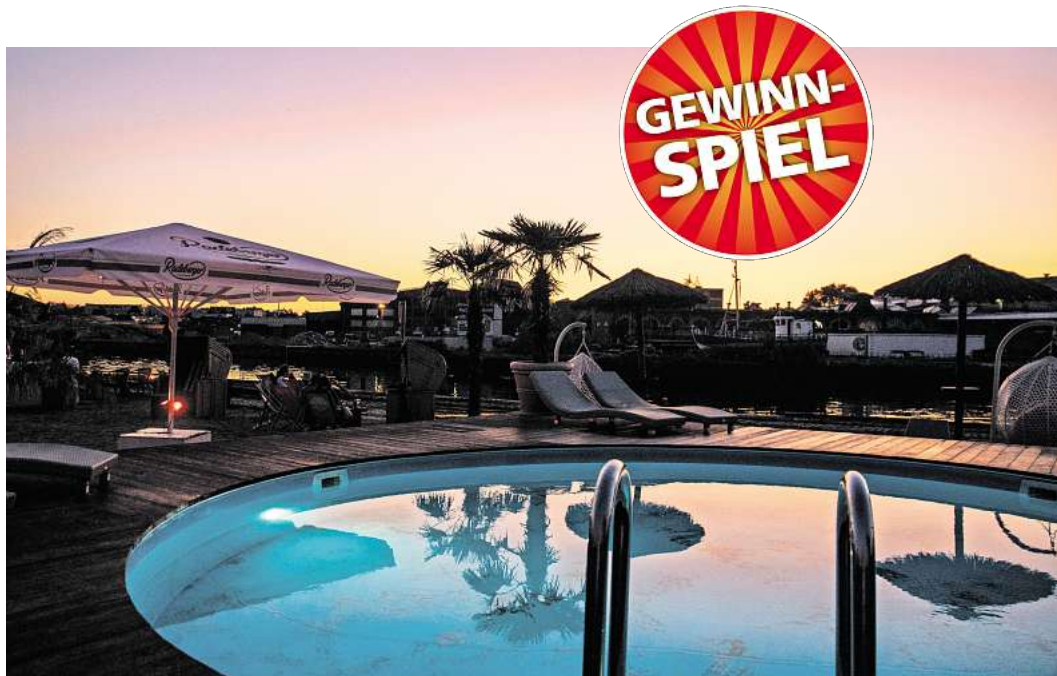
Perfekte Kulisse für die Original Ü30 Summer Party: der Strandsalon.