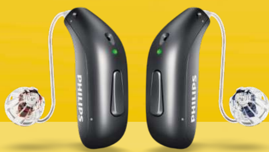
Hinter-dem-Ohr Hörsysteme HearLink miniRITE 050