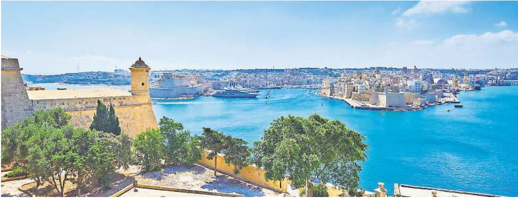
Valetta – hier mit ihrem herrlichen Hafen – ist die Hauptstadt von Malta.

Seit Ende Juli ist der neue Winterkatalog des „Reisering Hamburg“ auf dem Markt. Für die festlichen Tage des Jahres hat der renommierte Veranstalter aus Hamburg mit den knallroten Bussen einige neue Reiseziele im Gepäck: Eine begleitete Flugreise im Advent geht nach Malta. Auf Malta sind zu der Zeit herrlich milde Temperaturen. Gäste wohnen im Vier-Sterne-Hotel mit Sauna und Hallenbad. Eine geführte Inselfahrt rundet die Reise ab. Außerdem geht es über Weihnachten an den Wolfgangsee ins Salzkammergut oder ins Pfälzer Land nach Landau. Vielleicht lassen Reisende die Silvesterkorken zum Jahreswechsel stilvoll in Straßburg nach einem Fünf-Gang-Menü im historischen „Maison Kammerzell“ aus dem 15. Jahrhundert knallen? Oder