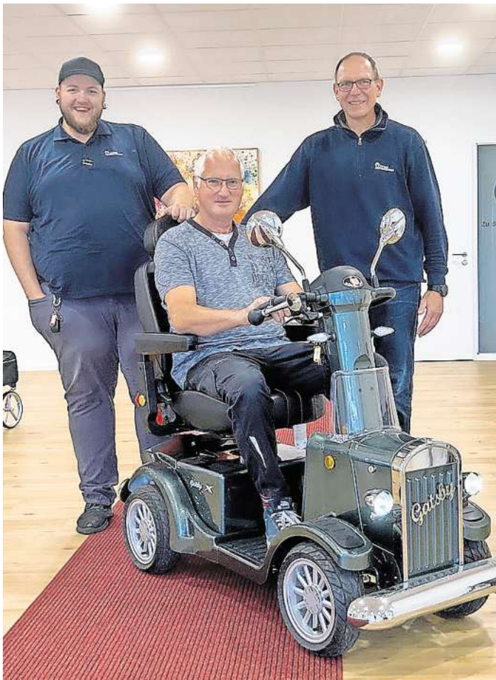
Die Reha-Mitarbeiter von Ostsee-Medizintechnik freuen sich über den erfolgreichen Testtag!

Die erfahrenen Spezialisten von Ostsee-Medizintechnik standen den Interessenten während des gesamten Tages beratend zur Seite. Die Besucher konnten die verschiedenen Scooter und Elektromobile bei ausgiebigen Testfahrten kennenlernen und