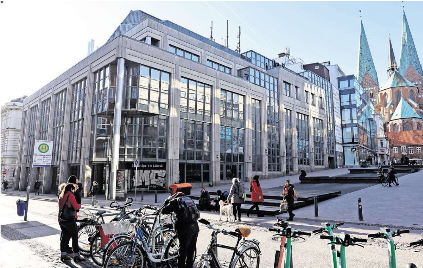
Karstadt-Haus B am Schrangeng wird für eine Mischung aus Bildung, Wissenschaft und Kultur komplett umgebaut.