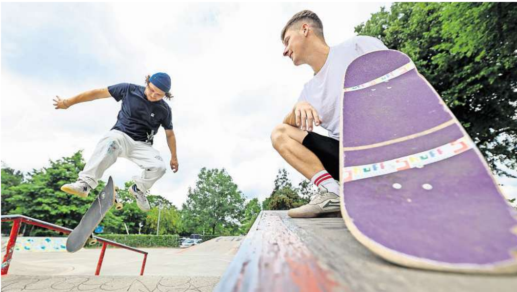
Auf der Anlage in der Kanalstraße trainieren Skater für einen Wettbewerb.

Die CDU-Fraktion werde bei den anstehenden Haushaltsberatungen im September die Möglichkeiten der Realisierung einer Anlage für die vielen sportbegeisterten Menschen im Stadtteil seriös prüfen. „Wir hoffen sehr, dass sich dabei trotz angespannter Kassenlage Spielräume dafür ergeben“, erklärt Zimmermann. Mit großer Mehrheit wurde der SPD-Vorstoß im Sportausschuss