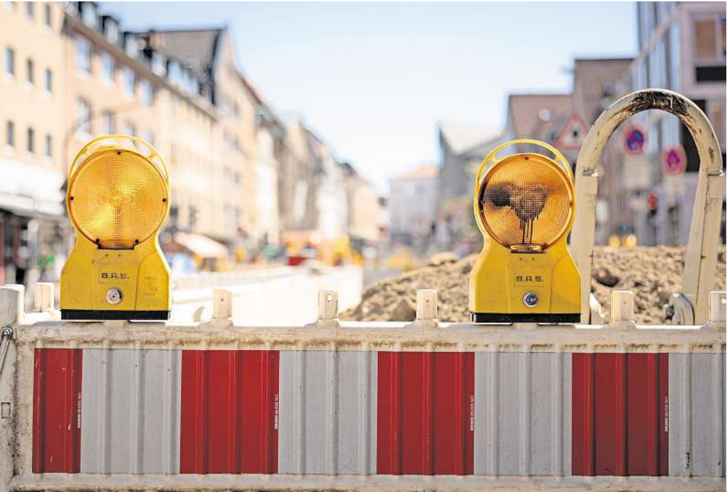
Kein Durchkommen mehr: Die obere Beckergrube wird umgestaltet.