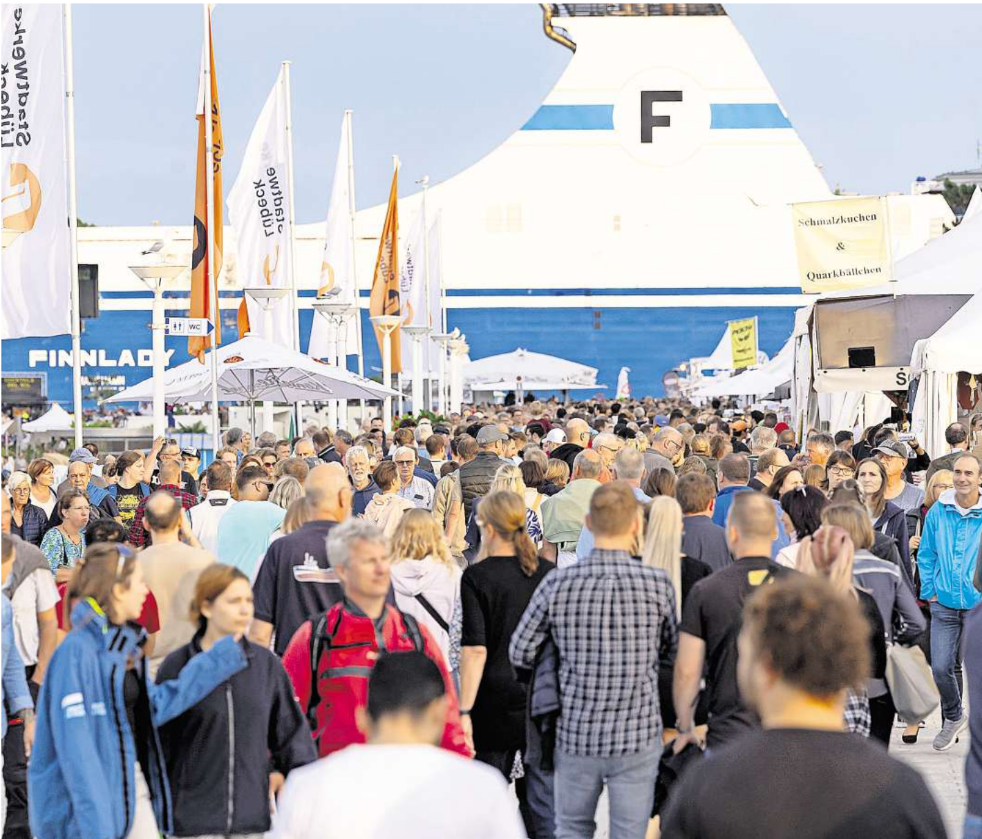
Entlang der Promenaden ist immer viel los auf der Travemünder Woche. Auch im vergangenen Jahr waren die Plätze und Wege von vielen Besuchern gesäumt.

sonderes Open-Air-Konzert. Die Gruppe Indigenes entführt mit „The Last Mohicans“ nach Amerika.“ ► Das „Segler:innen-Village“ (Travepromenade) ist die Anlaufstation für Segler und Seglerinnen. Rund um das Regattabüro am ehemaligen Rettungsschuppen gibt es alle Informationen zu den Regatten. Die Abende klingen im LN-Deck mit Blick auf die Trave aus. Travemünder Woche-Partner Marinepool lädt zum maritimen Shoppen ein, und an Bord der „Mare Frisium“ gibt es Erfrischungen von der Bar. An der Travepromenade locken Fischerdorf und Pagoden mit Kleinkunst und Kulinarik. Nahe der Priwall-Fähre soll die Harbour Lounge mit Cocktails, Sandstrand, Lounge-Möbeln und entspannten Chillout-Klängen vom DJ-Pult für Sommerabend-Flair sorgen. ► Beim Vorplatz der Autofähre zum Priwall kann man unter freiem Himmel tanzen. Der Tanzpalast lockt zur Travemünder Woche mit einem bunten Programm: Während der Nachtmit-tag für Kinder und Jugendliche gedacht ist, wird abends für alle Gäste eine täglich wechselnde Tanzparty mit Discofox, Swing und Salsa geboten.