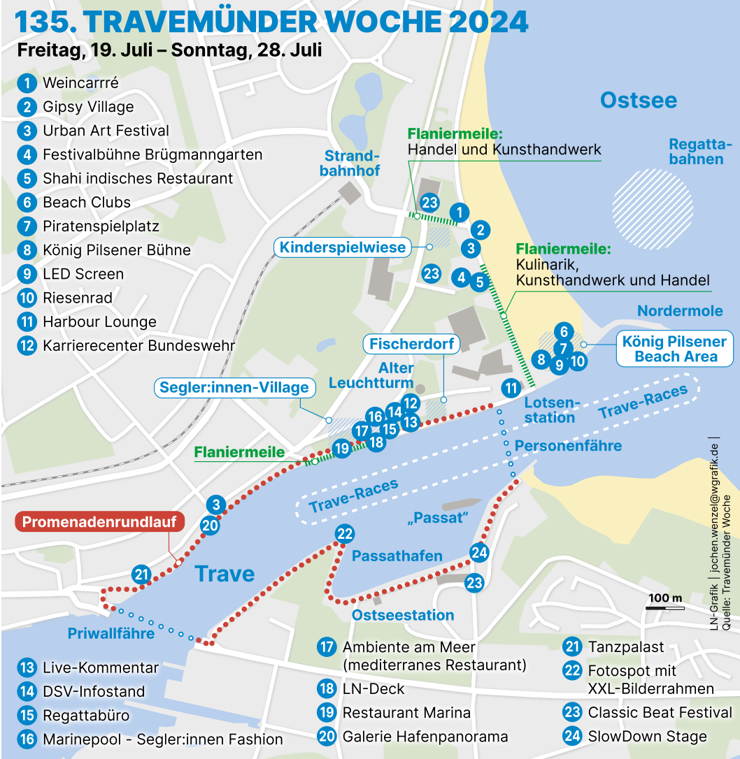
Veranstaltungsorte und Themen der Travemünder Woche 2024. Grafik: Wenzel

Vor allem der Priwall gehört laut TW-Sprecher zu dem Bereich, der inhaltlich erweitert wird. „Auf der Bühne am SlowDown wird ein Musikprogramm über alle Genres hinweg geboten“, sagt er. Soul und Pop wechseln mit Big-Band-Sound. Singer-Song-writer stehen ebenso auf der Bühne wie junge Talente und etablierte Cover-Bands. Und auch Classical Beat präsentiert