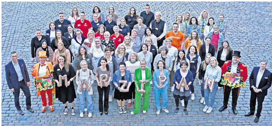
Gemeinsam stark: Dem Projekt MARZIPAN gehört ein großes Netzwerk an.

Der Job-Talk ermöglichte den Teilnehmerinnen und Teilnehmern, sich im direkten Kontakt mit potentiellen Arbeitgebern auszutauschen. Diese Gespräche gaben die Gelegenheit, gegenseitiges Interesse an einer Zusammenarbeit auszuloten. Um die Teilnehmerinnen auf diese Situation vorzubereiten, wurden sie