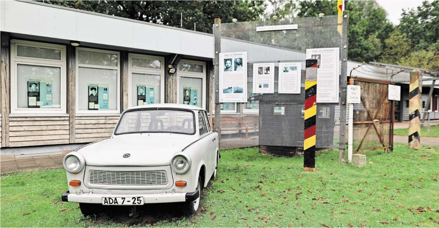
Seit 2004 gibt es die Grenzdokumentationsstätte in Schlutup.

Stadt und Land wollen das Museum weiterentwickeln, die Ausstellung klarer strukturieren, die Zahl der Exponate reduzieren, Ausstellungsstücke inventarisieren und digitalisieren. Außerdem sollen Zeitzeugen interviewt und deren Schilderungen dokumentiert werden. Diesen Weg der Pro-