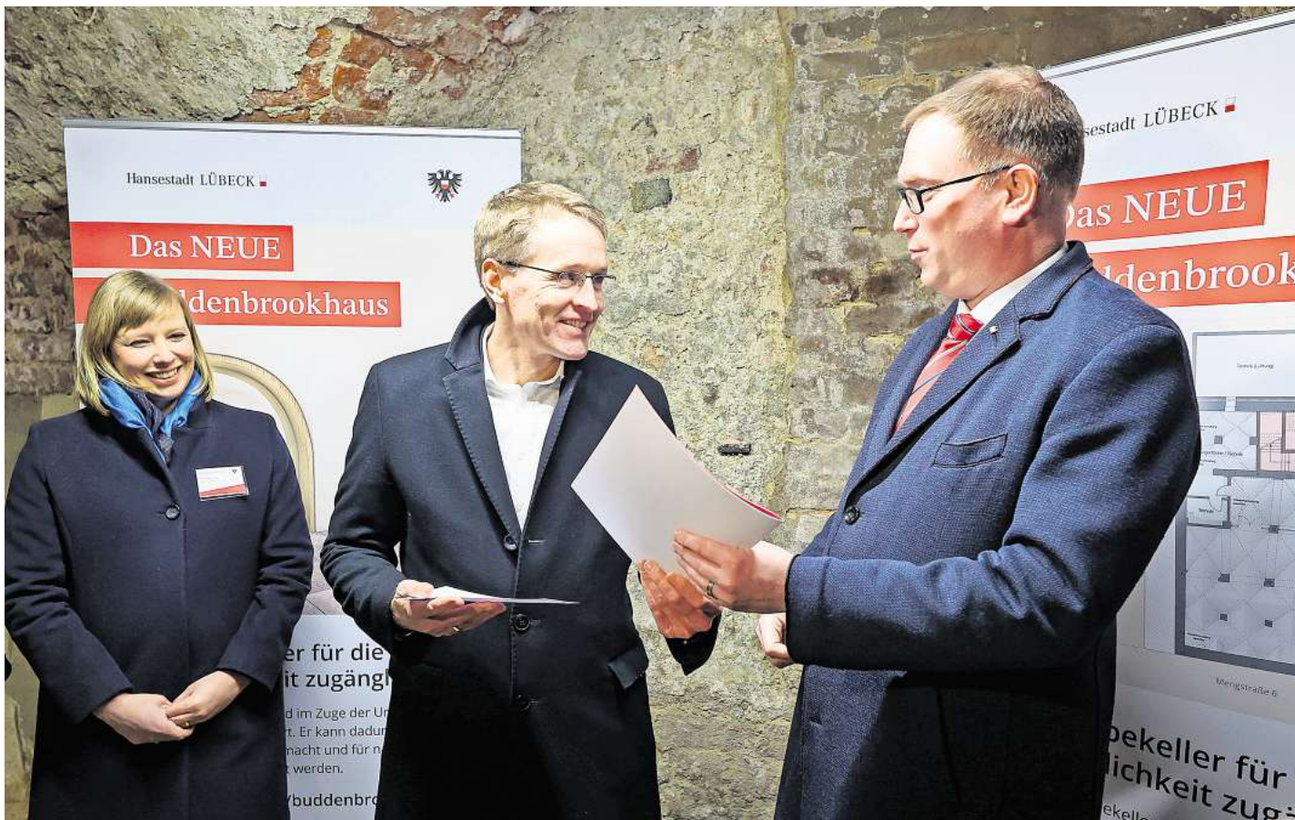
Mehr als 19 Millionen Euro brachte Ministerpräsident Daniel Günther (CDU, li.) im Februar 2023 für den Umbau des Buddenbrookhauses mit nach Lübeck und überreichte den Förderbescheid Bürgermeister Jan Lindenau (SPD).

Sollte es im September jedoch keine Einigkeit und Klarheit über