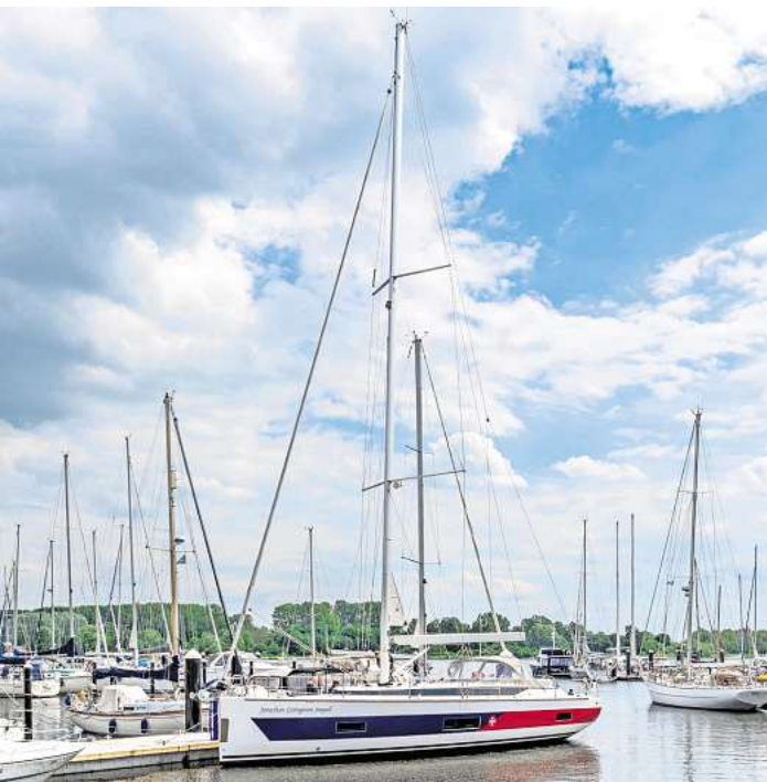
„Jonathan Livingston Seagull“ heißt das 15 Meter lange Segelboot, das von der Johanniter-Unfall-Hilfe in Lübeck erworben wurde. Auf dem Segelboot sollen künftig Projekte für Kinder und Jugendliche ermöglicht werden.

„Jonathan Livingston Seagull“ heißt das 15 Meter lange Segelboot, das im Frühsommer vom Regionalverband Schleswig-Hol-