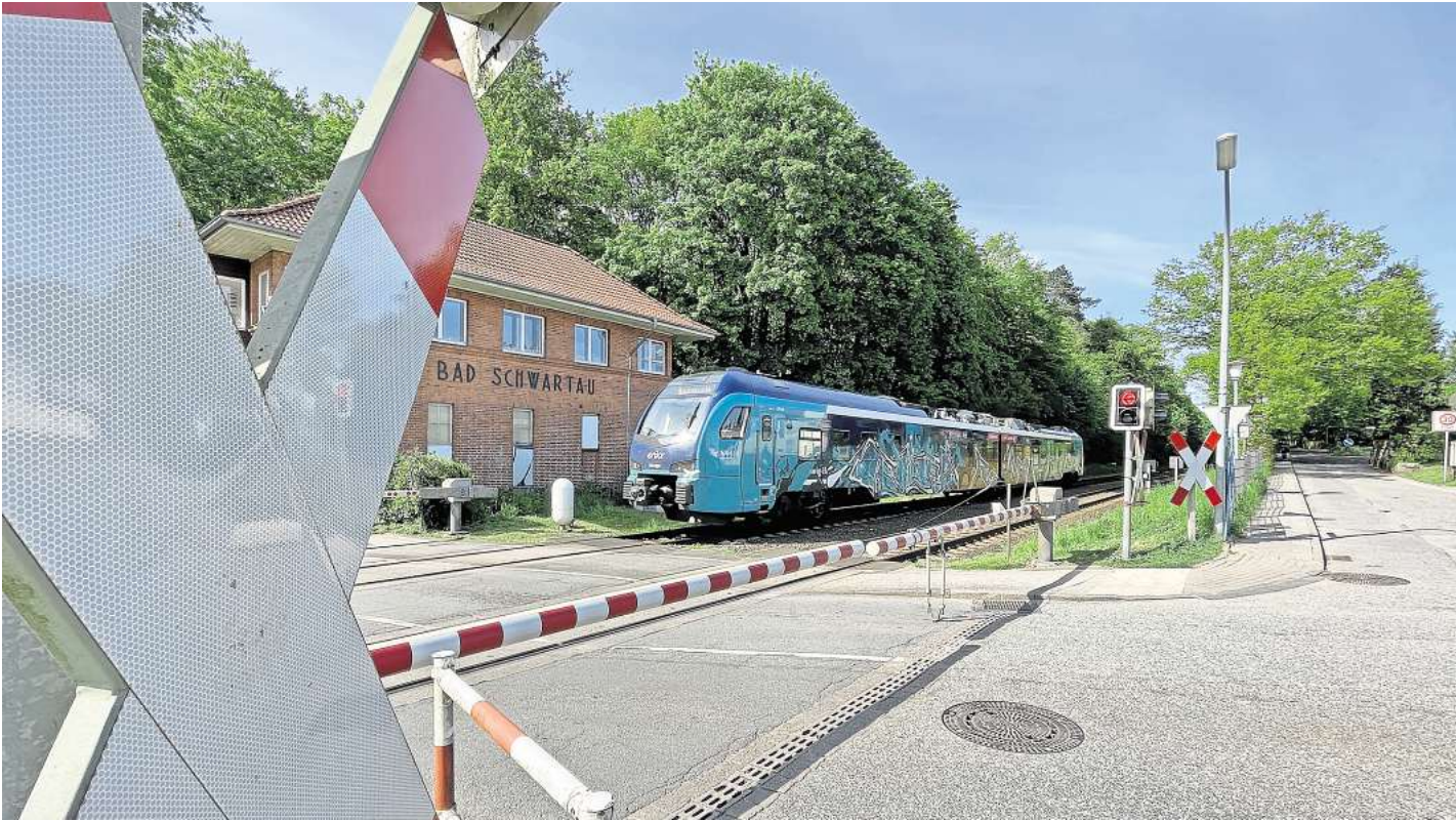
Der Bahnübergang Kaltenhöfer Straße in Bad Schwartau entfällt für die Belttunnel-Hinterlandanbindung, die Gleise sollen durch einen Trog geführt werden. Dafür wird eine Brücke zur Geibelstraße gebaut.