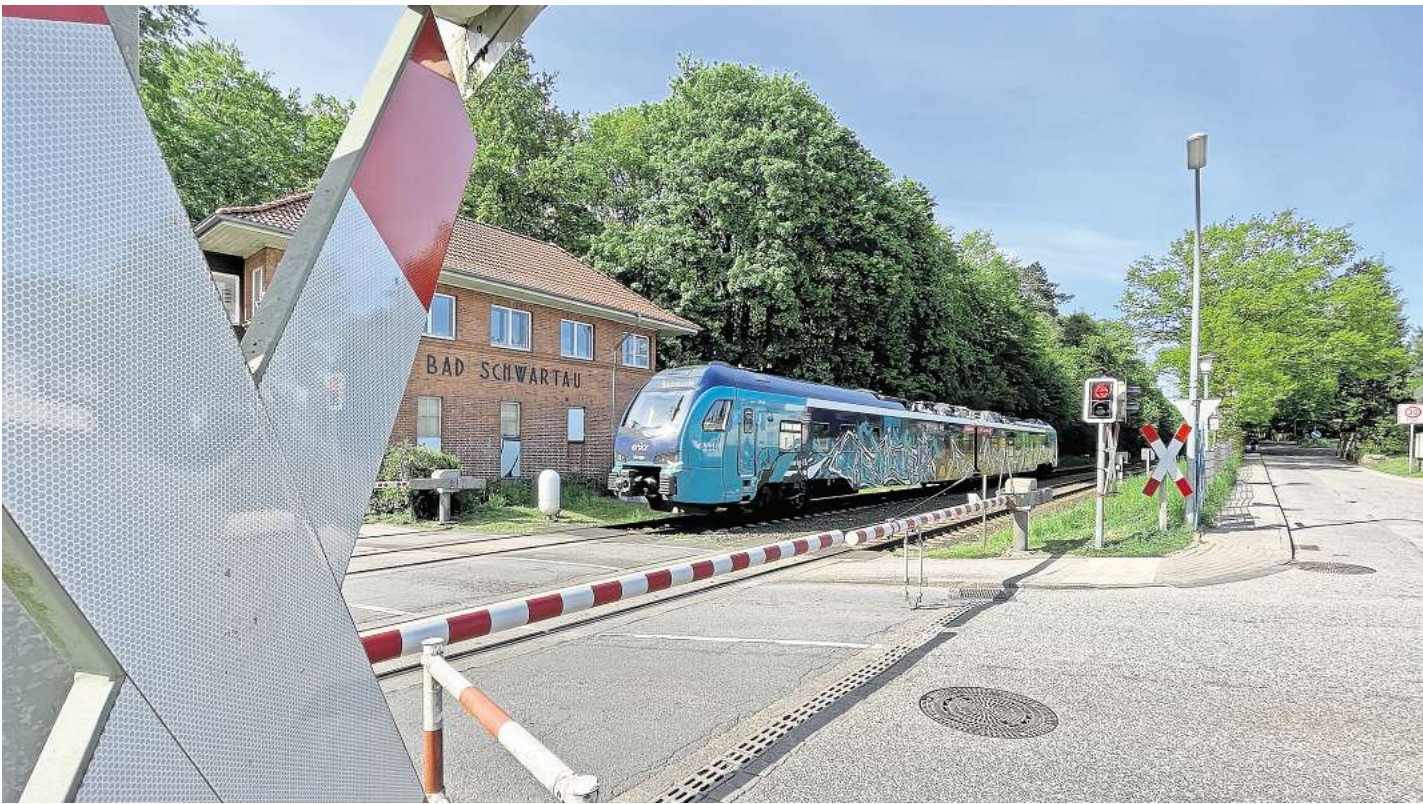
Der Bahnübergang Kaltenhöfer Straße in Bad Schwartau entfällt für die Belttunnel-Hinterlandanbindung, die Gleise sollen durch einen Trog geführt werden. Dafür wird eine Brücke zur Geibelstraße gebaut.