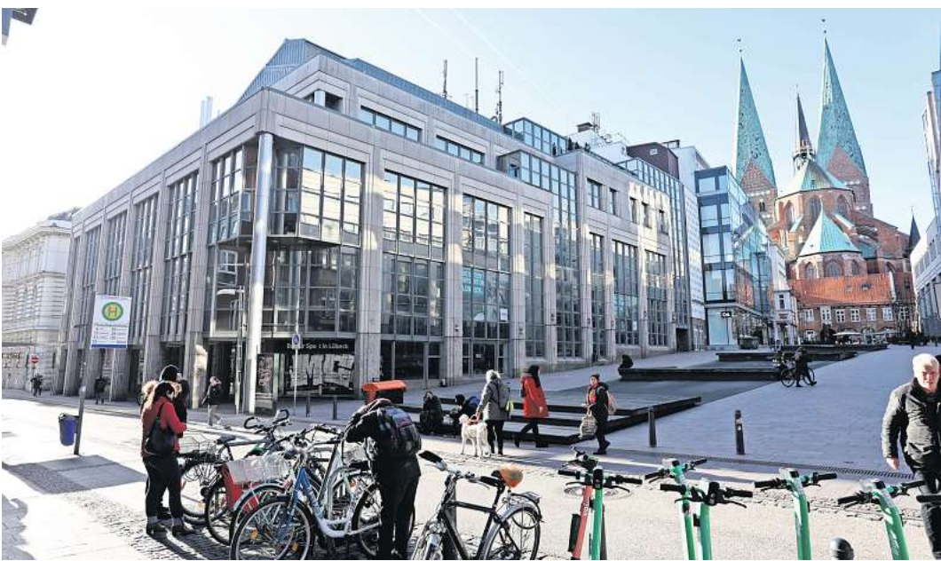
In diesem Gebäude war bis 2020 Karstadt Sports untergebracht.

Ebenfalls einen Platz im „Übergangshaus“ soll der sogenannte Digital Learning Campus der drei Lübecker Hochschulen (Technische Hochschule, Universität und Musikhochschule) finden. Auch der Offene Kanal Lübeck ist mit einem Tonstudio dabei. Dort will er den Besuchern kostenlose Mit-