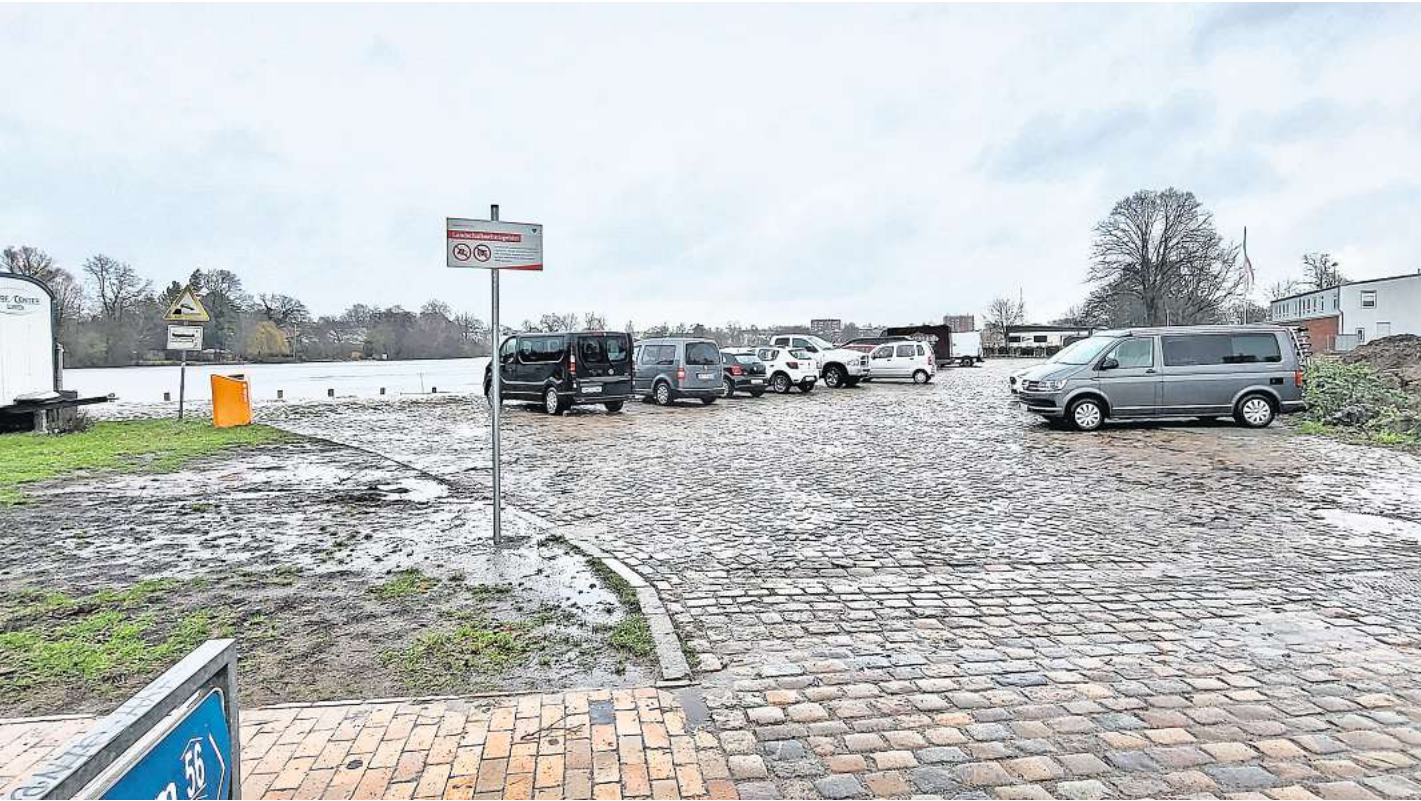
Parken an der Wakenitz-Kante: Autos sind geduldet, alle anderen Nutzer müssen künftig mit Knöllchen rechnen.