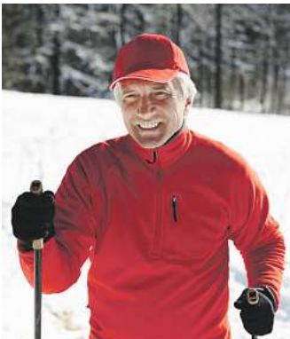
Abbildung Betroffenen nachempfunden PROSTACALMAN – Wirkstoffe: Serenoa repens a, Pareira brava a, Populus tremuloides Dil. D2. Prostacalman wird angewendet entsprechend den homöopathischen Arzneimittelbildern. Dazu gehören: Blasenentzündungen und Beschwerden beim Wasserlassen, bei vergrößerter Prostata. www.prostacalman.de • Zu Risiken und Nebenwirkungen lesen Sie die Packungsbeilage und fragen Sie Ihre Ärztin, Ihren Arzt oder in Ihrer Apotheke. • PharmaSGP GmbH, 82166 Gräfelfing

„Seit Tagen habe ich keine Schmerzen mehr im Knie! Ich werde die Tropfen weiter nehmen.“ (Klaus W.)