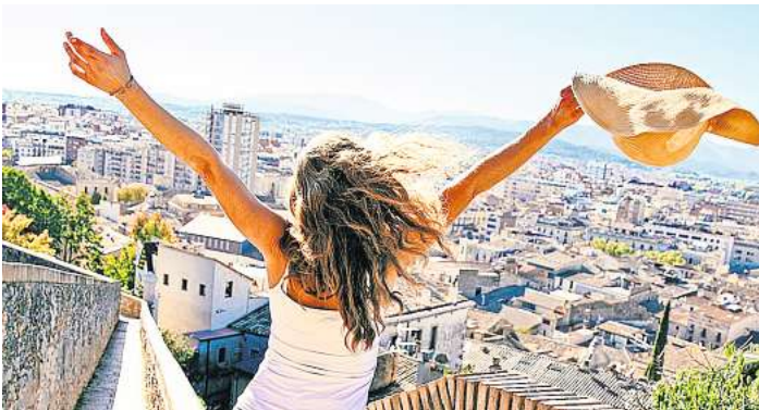
Reisinger Hamburg präsentiert seine Fahrzeuge und alle Reiseziele auf der Reismesse in Hamburg.

Die Vorteile: ► Urlauber reisen im komfortablen Vier- oder Fünf-Sterne-Reisebus