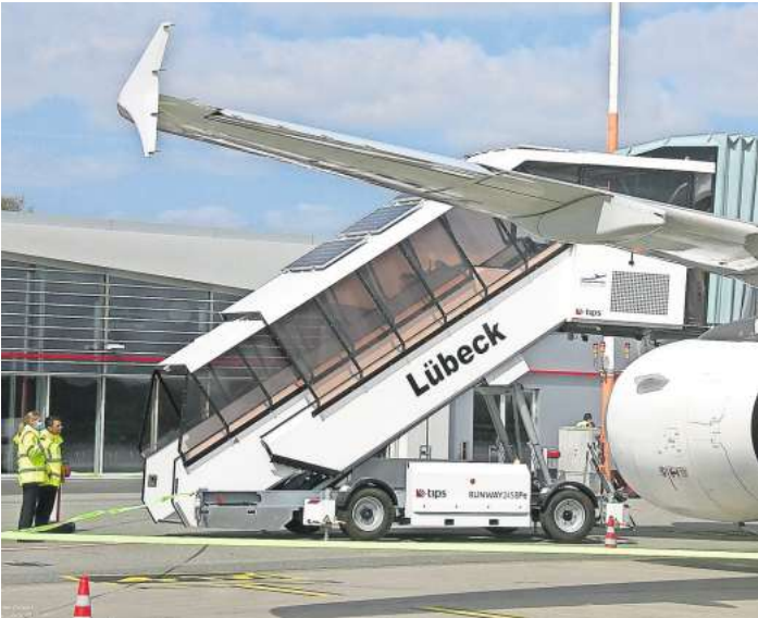
Direktflüge ab Lübeck in Richtung Mittelmeer.

Zusätzlich ab Lübeck: begleitete Reisen nach Albanien, Montenegro, Sizilien, Mittelmeer-Kreuzfahrten www.flughafen-luebeck.de/de/reiseangebote