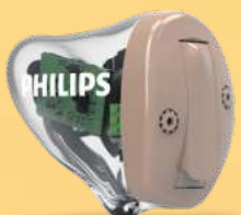
ITC – das Wandelbare