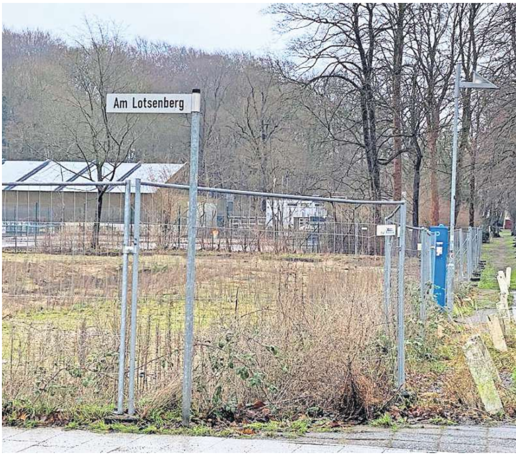
Auf dieser Brachfläche in Travemünde soll nach wie vor ein Hotel entstehen. Im Hintergrund sieht man die Tennishalle des TTHC.