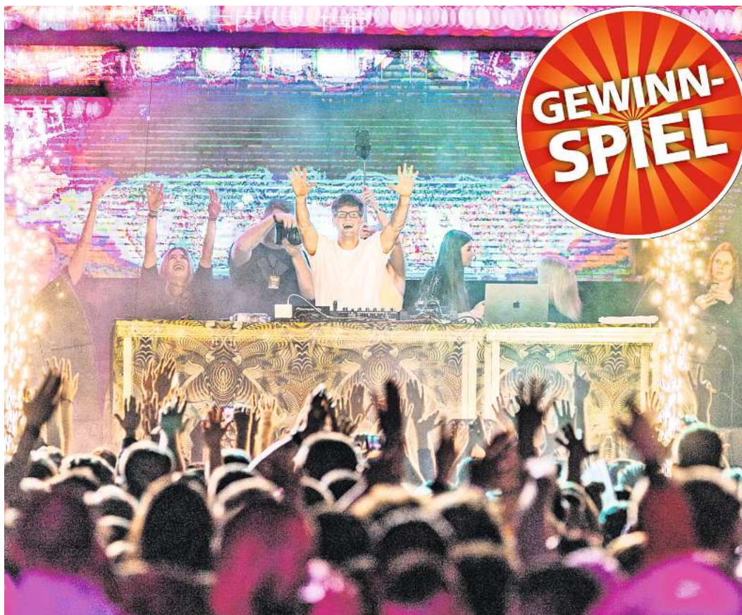
Neelix & Friends sind am 17. Februar in der MuK zu erleben.

Die Goa-Party des Jahres kehrt am 17. Februar nach Lübeck zurück.