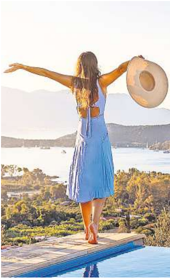
Lübeck – und der Urlaubstraum ist ganz nah.

Wohin darf die Reise gehen? Nach Mallorca? Eine griechische Insel? Der Reiseveranstalter „schauinsland-reisen“ und die Fluggesellschaft „Sundair“ erfüllen den nächsten Urlaubstraum.