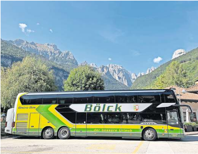
Luxus pur – wer mit dem Bistrobus von Bölck unterwegs ist, für den ist sein Reiseziel fast schon zweitrangig.

Mit dem Bistrobus wird schon die Fahrt zum einzigartigen Reiseerlebnis. Die luxuriöse Ausstattung vermittelt ein außergewöhnliches Reisegefühl. Die Besonderheit findet sich im Unterdeck: Hier besticht die hochwertige Ausstattung des Bistros. Die kompetenten und freundli-