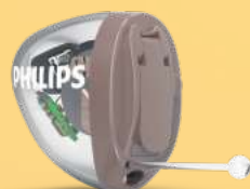
CIC – das Diskrete