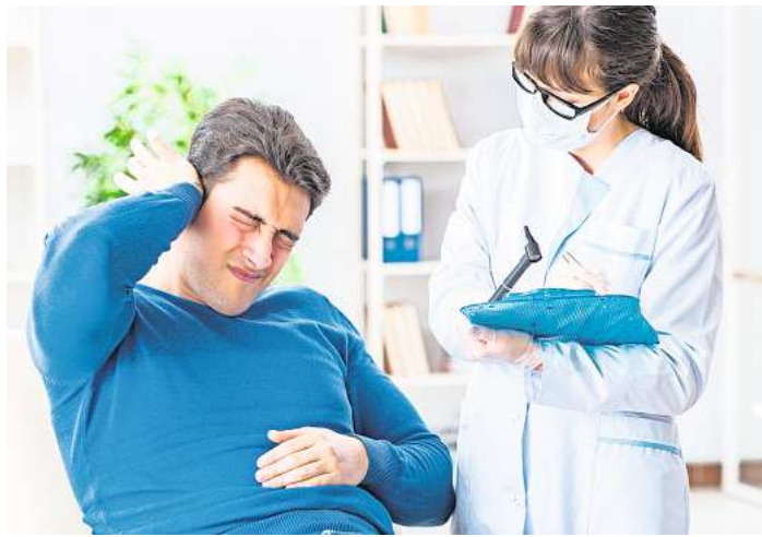
Silvesterböller stellen eine ernstzunehmende Gefahrenquelle für einen Hörverlust dar. Insbesondere in der Altersgruppe der sechs bis 25-Jährigen ist die Anzahl der Betroffenen alarmierend.

Feuerwerke, insbesondere zum kommenden Jahreswechsel, sind zwar hübsch anzusehen. Dennoch verkennen viele Schaulustige die Gefahr, die durch die mit dem Feuerwerk einhergehende Lautstärke für die Ohren droht. Je geringer der Abstand zum Feuerwerk ist, desto höher ist der messbare Schallpegel: Bei einem Abstand von zwei Metern werden bereits bis zu 160 Dezibel erreicht. Dieser Wert entspricht dem Schallpegel einer abgefeuerten Pistole. Professionelle Feuerwerke übersteigen diese Werte sogar mit Schallpegeln über 190 Dezibel abhängig von der ange-