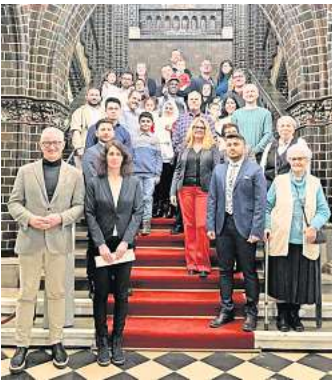
Die Einbürgerungsfeier fand im Rathaus statt.

Bevor er den Neu-Lübeckern ihre Einbürgerungsurkunden überreichte, betonte Senator Hinsen: „Jeder und jede von Ihnen hat seine persönlichen Gründe, Deutscher oder Deutsche werden zu wollen. Aber jeder und jede Einzelne von Ihnen ist ein Gewinn für unser Land und ein Gewinn für die Vielfalt in unserer Stadt: Engagieren Sie sich, sei es politisch, sozial, sportlich, sei es ehren- oder hauptamtlich. Denn unsere Stadt lebt vom Engagement. Ich wünsche Ihnen, dass Sie Ihre Entscheidung, Deutsche geworden zu sein, immer mit Freude empfinden.“