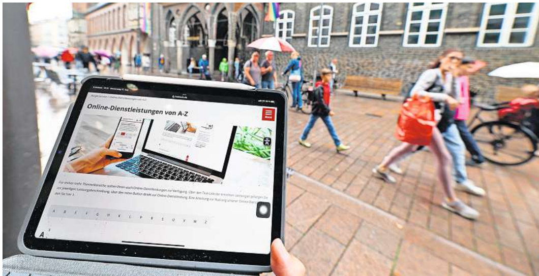
Lübeck baut die Onlineangebote aus. Der Anliegenmelder wird schon gut angenommen.