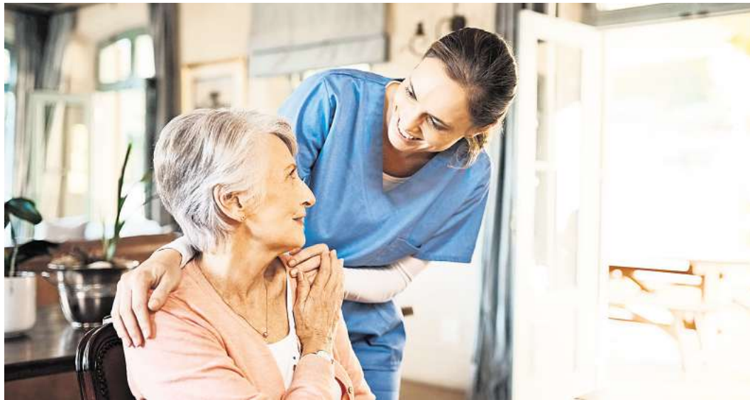
Betreuung in den eigenen vier Wänden ergänzt praktische Hilfen und technische Lösungen für ein sicheres Wohnen im Alter.

Wichtig sind gerade die unscheinbaren Hilfen: eine lautere Türklingel für Menschen mit Hörproblemen, ein Klingelsignal mit Licht, Telefone