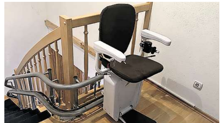
Mit individuell angepassten Treppenliften unterstützt besser zuhause dabei, Mobilität in den eigenen vier Wänden zu erhalten.

Tel. 040/696 3854 00 info@besserzuhause.com https://besserzuhause.com