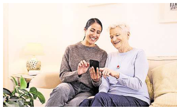
Aktuell bieten die Malteser den Hausnotruf noch bis zum 30.6.2026 mit einem Preisvorteil von 50 Prozent für die ersten drei Monate an.

Am eigentlichen Hausnotruf-Service ändert sich durch die neue Anwendung nichts. Dieser bleibe auch weiterhin uneingeschränkt ohne App nutzbar. Im Notfall nehme