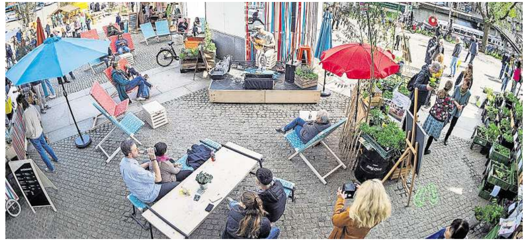
Die LN-ePOWER & GO.GRØØN hat auch vor der MuK schon einiges zu bieten.

Weitere Infos gibt es im Netz auf www.LN-ePower.de