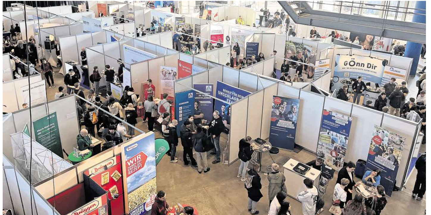
Auf der vocatium kann man direkt mit den Ausstellern ins Gespräch kommen.