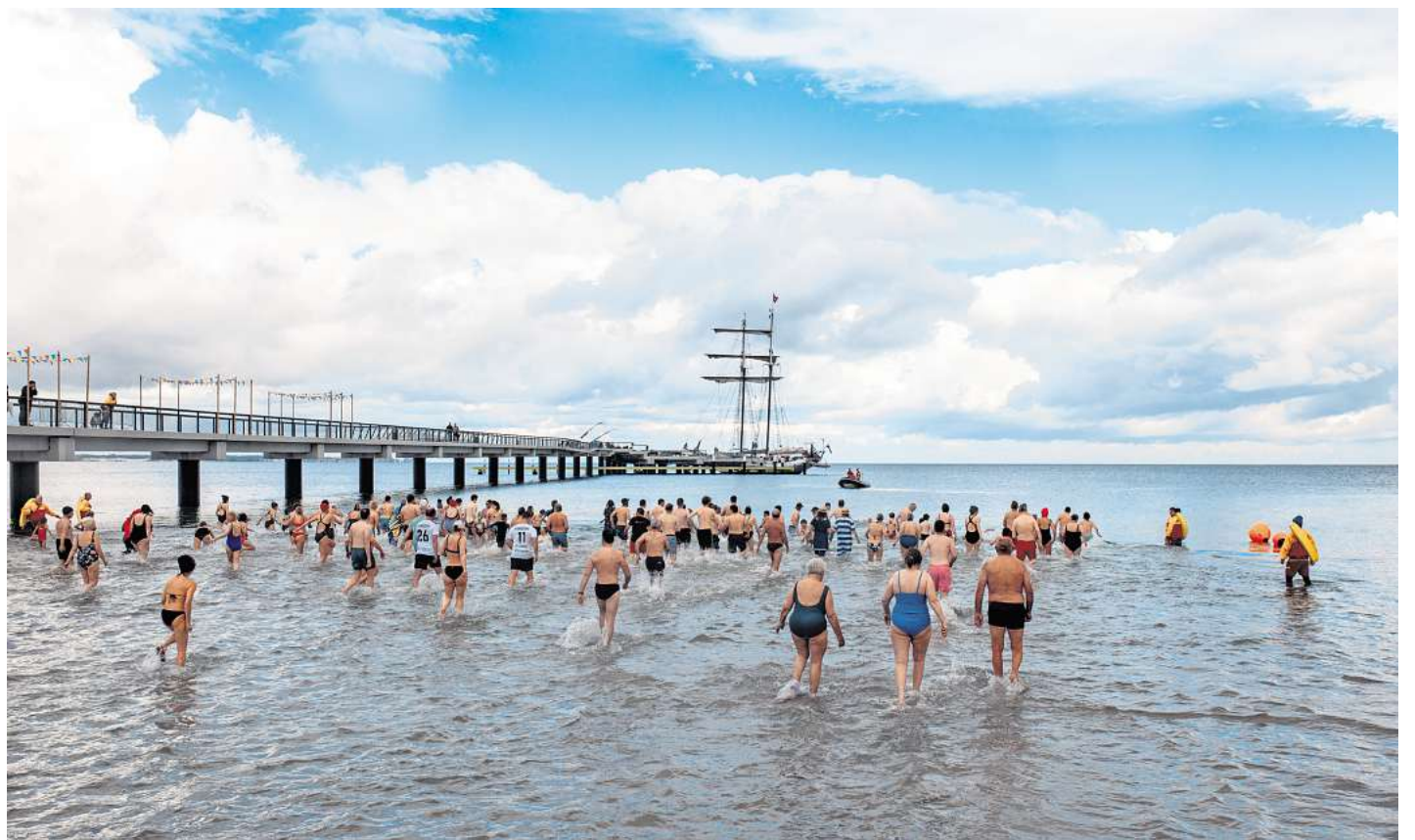
In Scharbeutz stürzen sich am Sonnabend, 2. Mai, wieder Hunderte in die kalten Fluten.