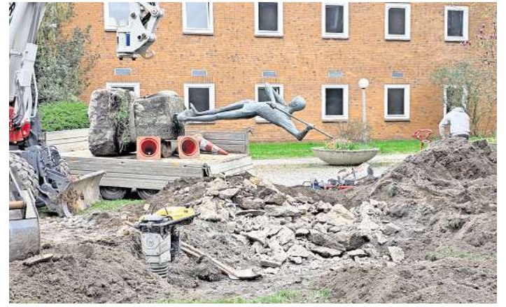
Die Bronzeskulptur wird mit schwerem Gerät von ihrem alten Platz in der Kalkbrennerstraße entfernt.