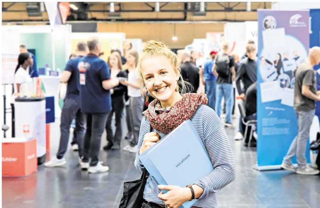
Auf der vocatium erhält man neue Impulse für das berufliche Weiterkommen.

13.20-13.40 Uhr Groningen: die glücklichste Stadt der Niederlande – und dein Studienort? Hanze University of Applied Sciences