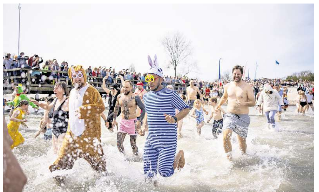
Wer in einem besonders lustigen Outfit beim Anbaden mitmacht, kann sich beispielsweise am 9. Mai in Travemünde über eine kleine Überraschung freuen.

In Scharbeutz wird das Anbaden am 2. Mai Teil des mehrtägigen Events „Mai & Meer“, das