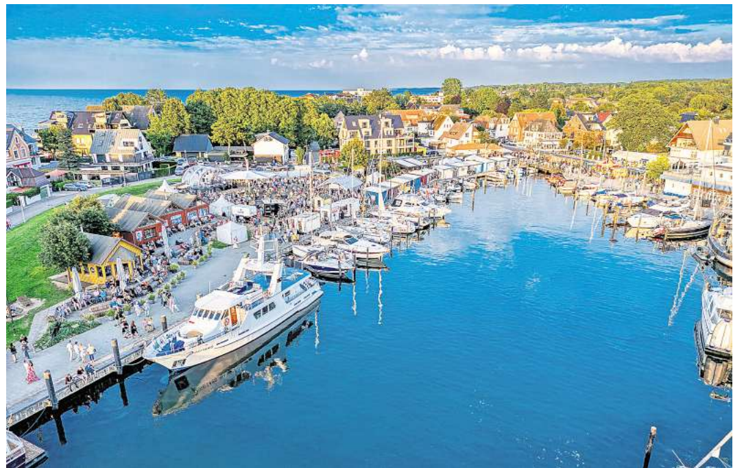
Der „Hafenfrühling“ in Niendorf verspricht ein Wochenende voller Erlebnisse für die ganze Familie.

Auch der Sonntag bietet ein abwechslungsreiches Programm: Neben einer Lesung von