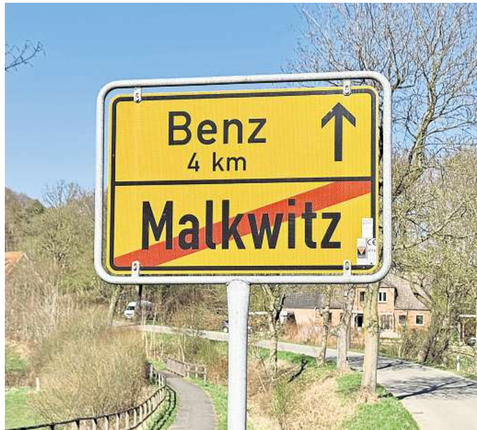
Auf der Dorfstraße zwischen Malkwitz und Benz in der Gemeinde Malente ereignete sich im Juli 2025 der Rollerunfall, der jetzt Thema vor Gericht wurde.