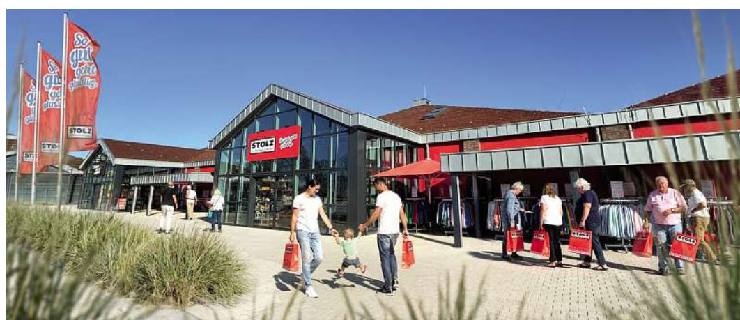
In Bliesdorf, direkt an der B501, eröffnet das Kaufhaus Stolz am 28. April eine weitere Filiale. Kundinnen und Kunden können sich auf ein breites Sortiment freuen.