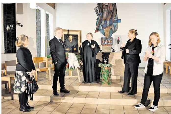
Zoff bei der Trauerfeier gibt es mit dem Theater Zeitgeist und dem Stück „Kalter weißer Mann“ in Malente.