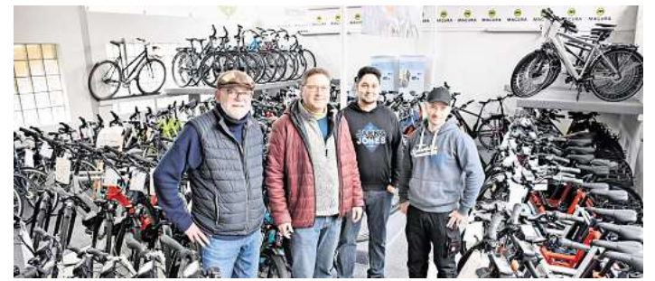
Das Team des „Fahr-Rad-Ladens“ berät kompetent rund ums Zweirad.

Wer jetzt auf den Geschmack gekommen ist, sollte sich im Fachhandel beraten lassen und das passende E-Bike oder Gravelbike inklusive Bike-Fitting auswählen. Im nächsten Schritt helfen Reisebüros und regionale Tourismusanbieter dabei, passende Touren zu finden und Mehrtagestouren unkompliziert zu buchen. cs