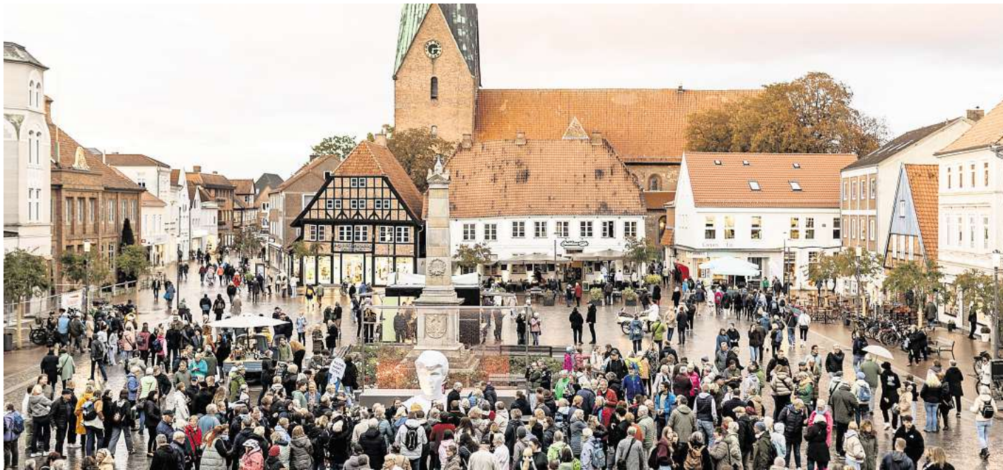
Die erste Kultur-Nacht Eutin lockte 2025 viele Besucherinnen und Besucher auf den Eutiner Marktplatz.