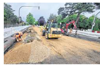
Dauerbaustelle: In diesem Jahr wurde die Moislinger Allee grundsaniiert.

Für die Jahre 2021 bis 2025 hatte die Verwaltung einen Masterplan Straßen aufgelegt. Mit zehn Millionen Euro pro Jahr wurden