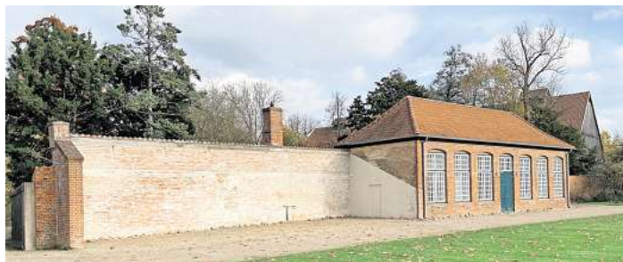
Im kommenden Jahr wird eine Bildungsküche im Neuholländerhaus eingebaut. Draußen sind Sitzgelegenheiten vorgesehen.