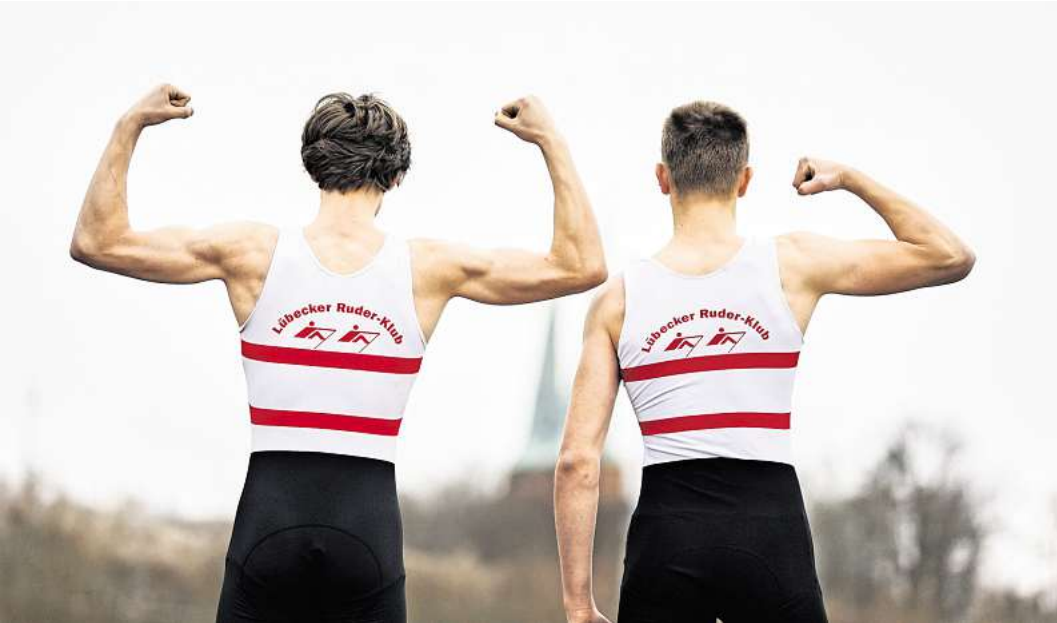
Der Lübecker Ruderclub sucht Unterstützung.