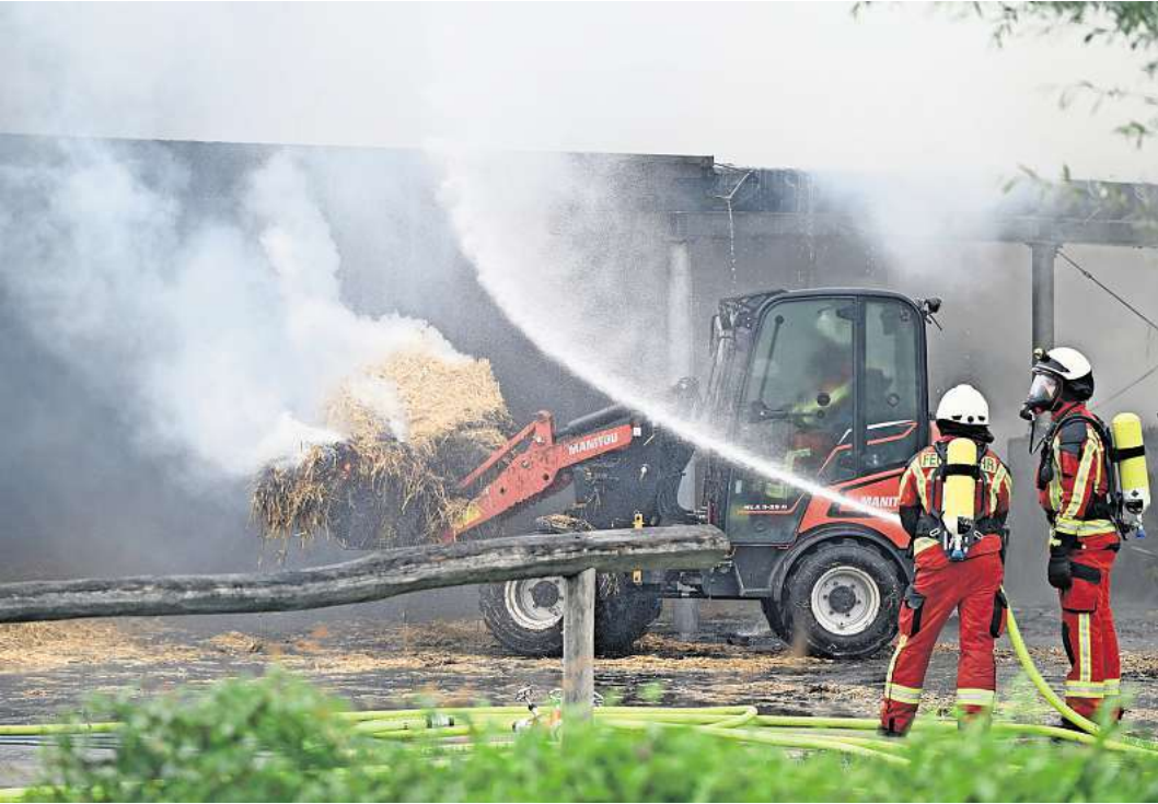
Mit einem Radlader holen die Feuerwehrleute die brennenden Strohballen aus dem Lager, um die Flammen zu löschen.

Unterstützt wurden die Feuerwehrleute auch durch einige Mitarbeiter der Reitanlage und Pferdebesitzer. Diese hatten geistesgegenwärtig die 15 Pferde, die beim Ausbruch des Feuers noch in den Boxen gestanden hatten, schnell ins Freie und auf die Koppeln geführt. „Dank dieser Hilfe konnten wir uns sofort auf die Löscharbeiten konzentrieren“, sagte Path sichtlich erleichtert. Bei der Alarmierung hieß es noch, dass Tiere in Gefahr seien. Nach einer knappen Stunde hatten die Einsatzkräfte das Feuer unter Kontrolle. Mit einem Radlader, der immer wieder „gewässert“ wurde, holten die Feuerwehrleute die glimmenden Strohballen aus dem Lager und zogen diese auseinander, um die letzten Glutnester zu löschen. Zudem öffnete ein Erkundungs-