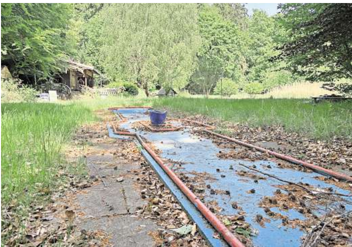
Der Minigolfplatz ist verwildert, die Bahnen wurden seit Jahren nicht mehr bespielt.

Möbel und Unrat stapelt sich auch auf der Terrasse. Ein alter Dartautomat steht verloren an der Wand, direkt daneben leere Farbeimer, ein Puzzle und ein Diabolo. Der Mix ist abenteuerlich, genau wie die Geschichte des Platzes innerhalb der vergangenen Jahre.