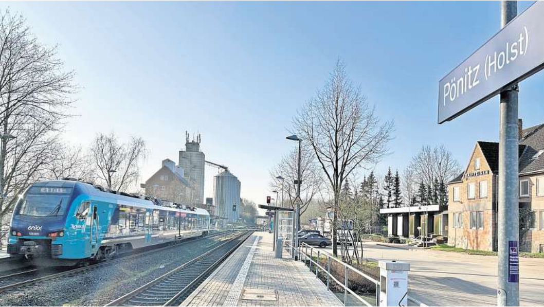
Wer von Pönitz in die Landeshauptstadt will, muss künftig in Eutin umsteigen.

„Die neue Regionalbahn hält relativ häufig. Danach geht es dann aber besonders schnell von Eutin nach Kiel, weil die Strecke ausgebaut wird“, verspricht Schulz. Der Takt der Regionalbahn bleibe halbstündlich, so wie heute, sie fahre aber nur von Malente oder Eutin nach Lübeck und umgekehrt. Zusätzlich verkehre der