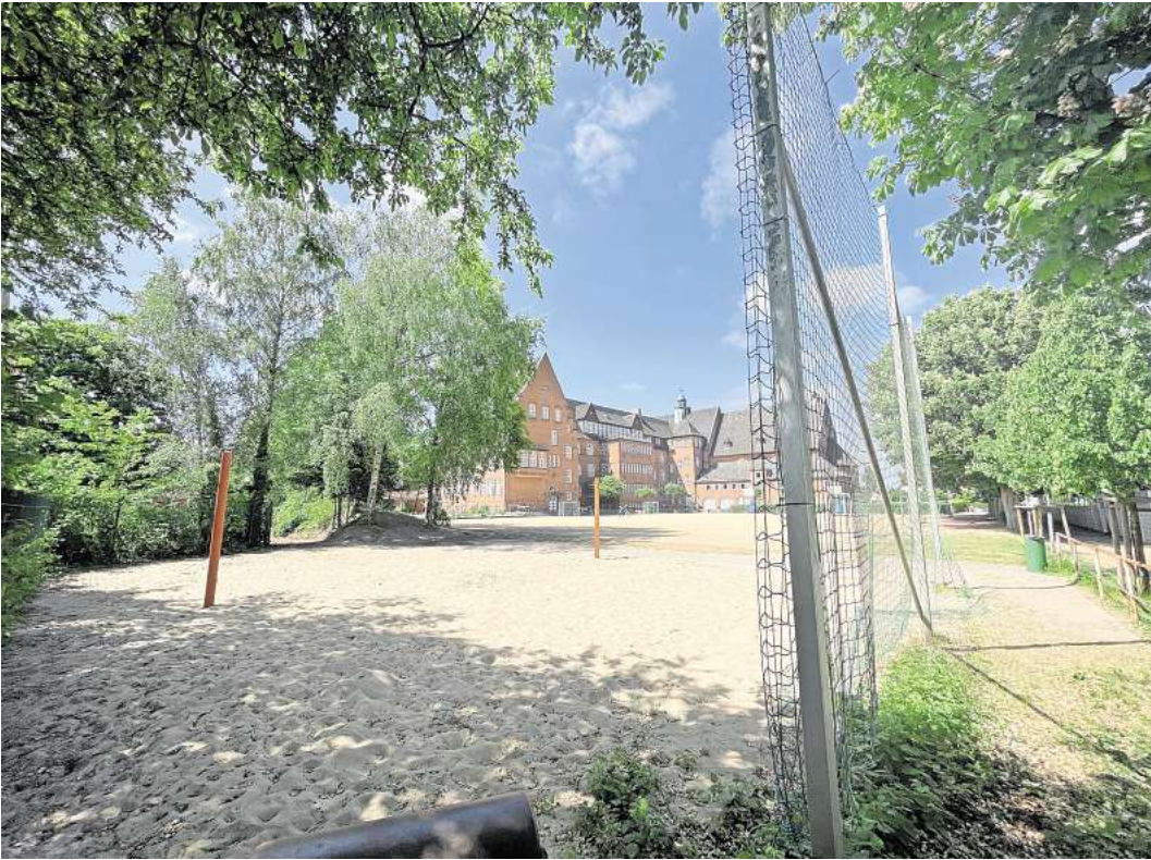
Dort, wo jetzt das Beach-Volleyballfeld der Voß-Schule liegt, soll im Sommer 2026 ein Modulbau mit vier Klassenräumen stehen.