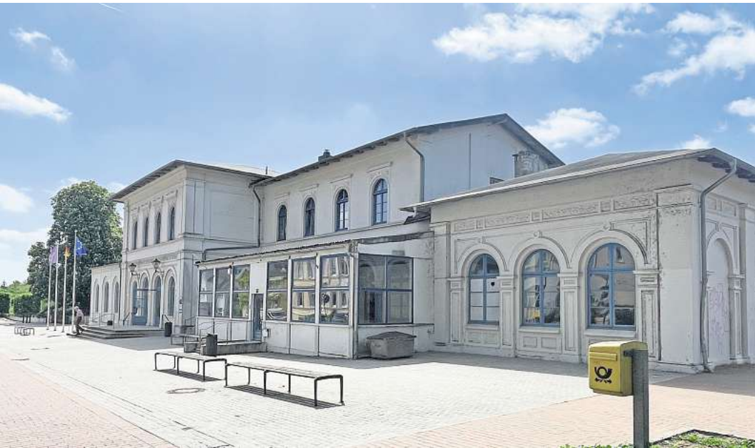
Der Eutiner Bahnhof soll zum Kulturzentrum werden.