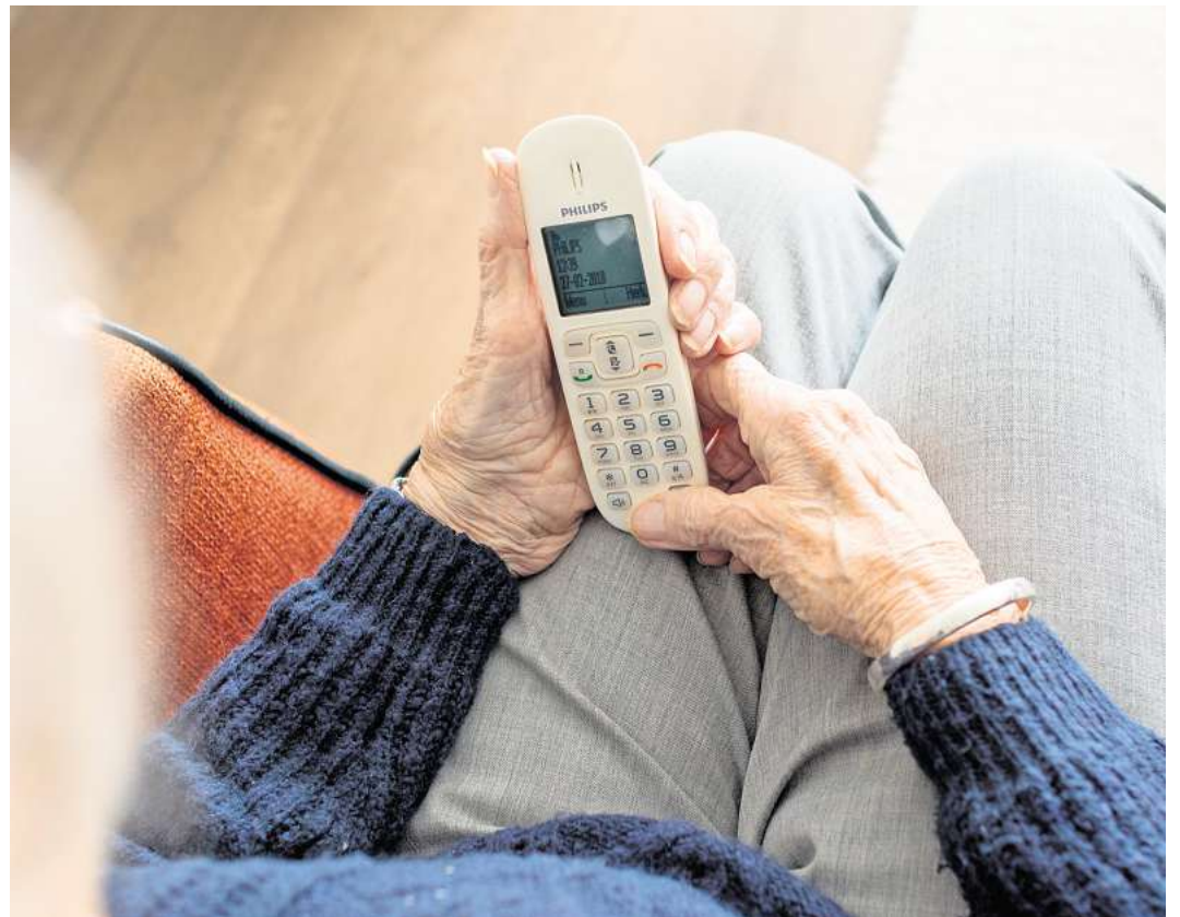
Ältere Menschen sind häufig Opfer so genannter Schockanrufe. Aus mobilen Call-Centern in Polen werden sie angerufen und zur Herausgabe größerer Summen bewegt.

Durch koordinierte Aktionen seien 61 Personen festgenommen worden. 23 der dringend Tatverdächtigen und mittlerweile teilweise Verurteilten fungierten als hochrangige Logistiker in Polen, die genannten „Keiler“. Entscheidend für den Fandungserfolg waren koordinierte