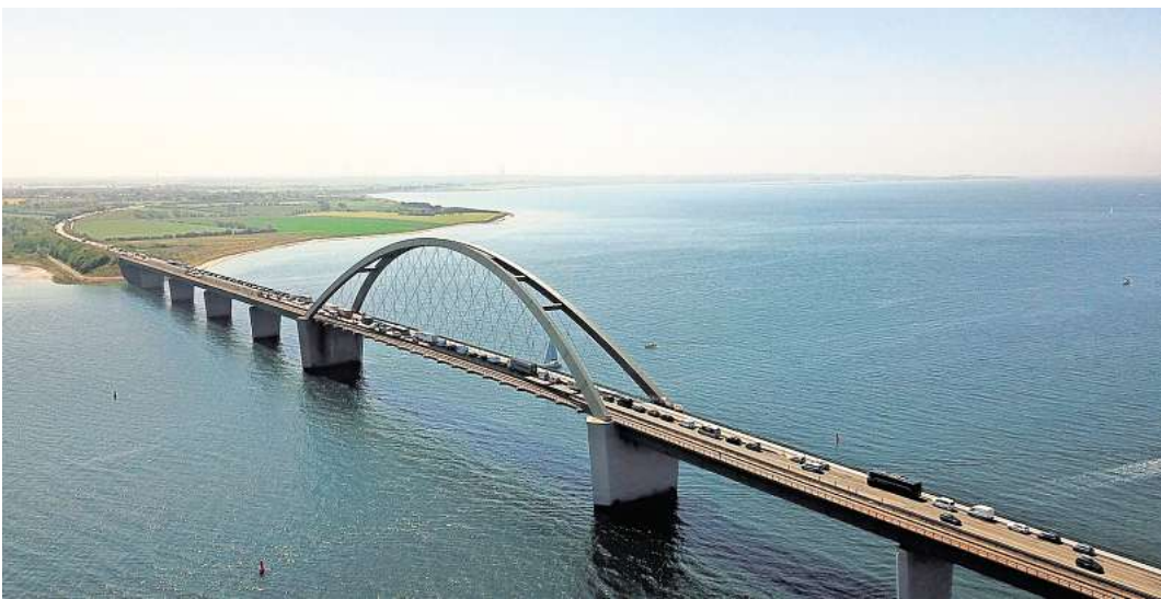
Kostenfalle Sundbrücke: Der Kreis Ostholstein sieht sich bei einer Übernahme finanziell überfordert und will für den „Kleiderbügel“ nicht zuständig werden.