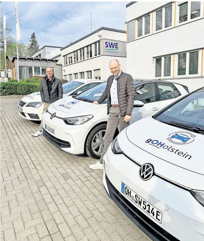
Carsharing mit den Stadtwerke Eutin.

Für die Fahrzeuge brauchen die Kunden keinen Autoschlüssel. Das gewünschte Fahrzeug wird per App geöffnet, der passende Schlüssel befindet sich im Schlüsselhalter im Handschuhfach. Einige der Fahrzeuge sind sogar mit dem schlüssellosen System Keyless Go ausgestattet.