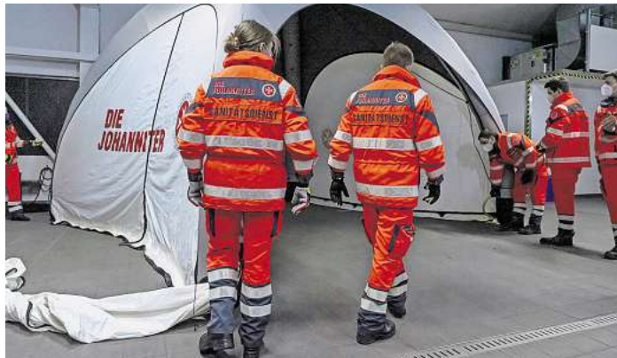
Die Johanniter-Unfall-Hilfe stellt ihre Arbeit vor.

Die Gäste können sich auf viele Highlights freuen: Die Fahrzeuge des Katastrophenschutzes, Rettungsdienstes, der Motorradstaffel, des Fahrdienstes und das Gesundheitsmobil können ausgiebig bestaunt werden. Auf die Kleinen warten Teddyklinik (Bring dein eigenes Kuscheltier mit!), Hüpfburg, Lauf- und Bobbycar-Parcours, Schminken und viele Spiele. Interessierte können sich über die Arbeit und das Ehrenamt bei den Johannitern informieren. Der Sanitätsdienst demonstriert um 11.30 Uhr den Aufbau einer Unfallhilfsstelle, die bei Sanitätsdiensten, Unfällen oder in Krisensituationen für