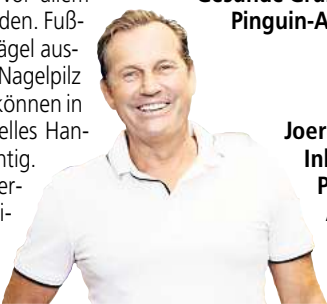
Gesunde Grüße aus den Penguin-Apotheken

Auch sollte man seine Füße regelmäßig pflegen und eincremen und auf gut passende Schuhe achten, denn kleine Risse in der Haut, wie sie schon durch Reibung enger Schuhe entstehen können, lassen Erreger wesentlich leichter eindringen. Synthetikmaterialien in den Socken machen es dem Fußpilz ebenfalls leichter, da die Füße schneller schwitzen und der Schweiß nicht aufgesaugt wird.