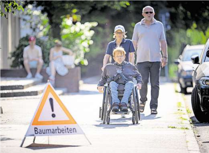
Wie kommen Menschen mit Behinderung durch den Alltag? Darum kümmert sich der Behindertenbeirat der Hansestadt.

alle Wahlberechtigten ihre Stimme abgegeben haben, werden diese ausgezählt und das Wahlergebnis wird bekanntgegeben. Wer sich für die Arbeit des Gremiums interessiert, kann die öffentlichen Sitzungen des Beirats besuchen. Sie finden jeden zweiten Mittwoch um 16 Uhr im Haus Trave in der Kronsforderallee 2-6 im 7. Stock statt (barrierefreier Zugang). Weitere Informationen sind in der Geschäftsstelle des Behindertenbeirats unter der Rufnummer 0451-1224511 oder per E-Mail an Behindertenbeirat@luebeck.de erhältlich. DOR