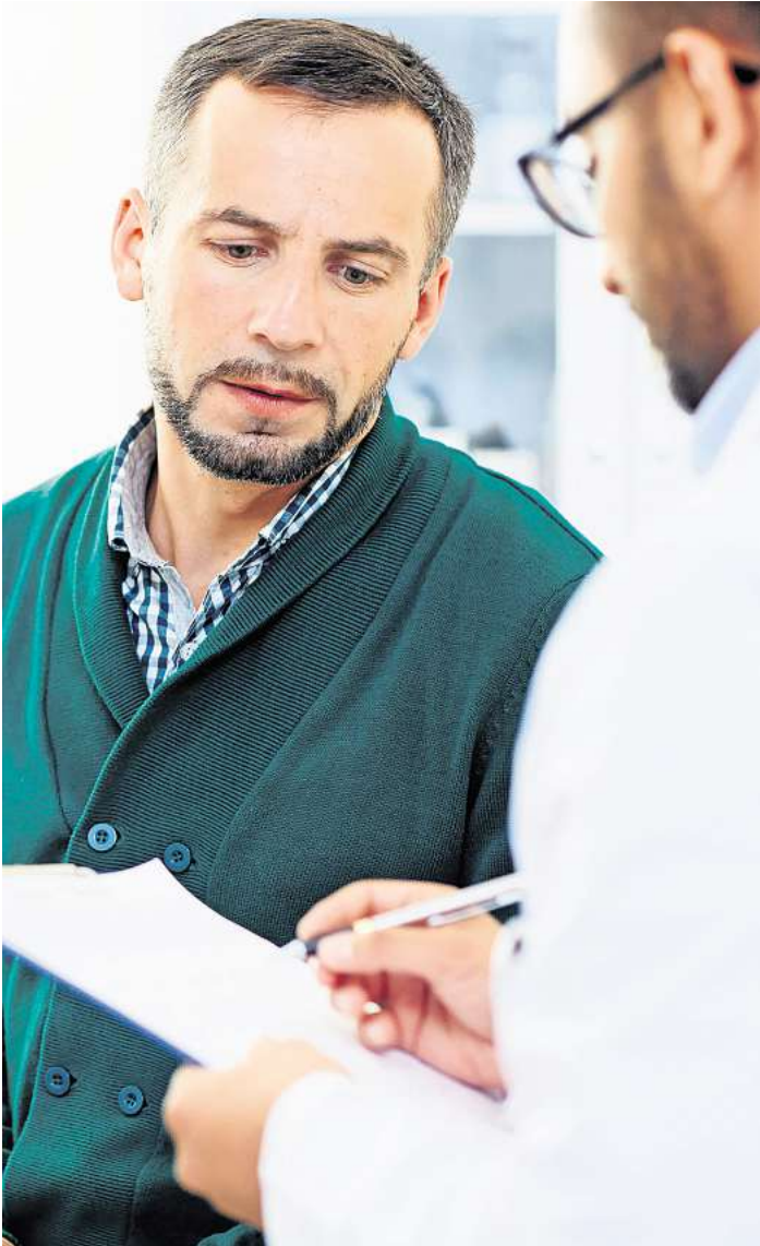
Prostatakrebs ist in Schleswig-Holstein weiterhin die häufigste Krebserkrankung bei Männern. In 2023 konnten erstmals seit Beginn der Corona-Pandemie wieder steigende Zahlen bei der Inanspruchnahme von Prostatakrebs-Früherkennungsmaßnahmen verzeichnet werden.

Das Risiko, an Prostatakrebs zu erkranken, steigt mit dem Lebensalter. Vor dem 50. Lebensjahr tritt Prostatakrebs nur selten auf. „Es gibt Hinweise auf