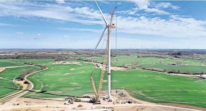
Bei Kiekbusch in der Gemeinde Bosau werden derzeit sieben Anlagen für den neuen Windpark montiert.

Die Initiative stieß zunächst auf ein geteiltes Echo. Eine Bürgerbewegung forderte, die Höhe der geplanten Anlagen zu reduzieren. Laut der Investoren wäre das Projekt damit unwirtschaftlich geworden. Das Vorhaben stand auf der Kippe. Im September 2022 folgte der Bürgerentscheid. 55 Prozent der Wählerinnen und Wähler stimmten gegen die Höhenbegrenzung und für die beantragte Planung. Jetzt nimmt der Windpark Kiekbusch sichtbare Formen an. Parallel zu den Mühlen soll auch eine Trafostation errichtet werden. „Das Umspann-