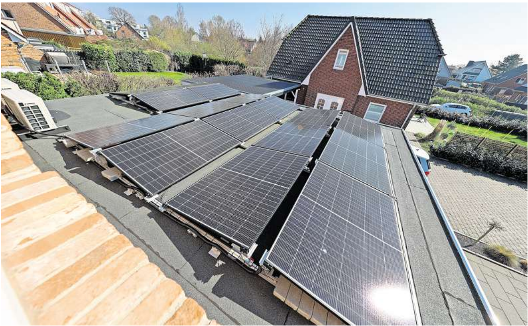
Die Zahl der privaten Photovoltaikanlagen, die beim Netzbetreiber TraveNetz angemeldet werden, steigt kontinuierlich an.

würden. Für einen großen Sprung nach vorn müssten viel mehr Dächer mit Solarmodulen belegt werden – vor allem Gewerbedächer. „Es gibt ein enormes Potenzial an erneuerbarem Strom von Gewerbedächern“, sagt Prof. Michael Bischoff vom Verein Klimaentscheid Lübeck. Auf 300 Millionen Kilowattstunden schätzt die Klimaleitstelle den Stromertrag durch Photovoltaik auf Gewerbedächern, auf Dächern großer kommunaler Liegenschaften und durch PV-Anlagen auf großen Parkplätzen. Die Stadt ist beispielsweise dabei, auf 17 Schuldächern Anlagen zu bauen. Rein rechnerisch ist die Klima- und Energiewende in Lübeck also möglich. Aber dafür braucht es zahlreiche Projekte. Laut Solarflächen-Konzept sei eine großflächige PV-Anlage im Bereich Wulfsdorf in Planung. Die Bürgerenergie-Genossenschaft will für 1,8 Millionen Euro einen Solarpark in Ivendorf errichten. Die Entsorgungsbetriebe Lübeck betreiben auf der Deponie Niemark eine PV-Anlage, auf Hallen der Lübecker Hafen-Gesellschaft sind große Anlagen geplant und auf zehn Hektar wird im Bereich Vorrade ein Solarpark errichtet. Und immer mehr Bürger beteiligen sich an der Energiewende. Der Netzbetreiber TraveNetz verzeichnete im vergangenen Jahr 2000