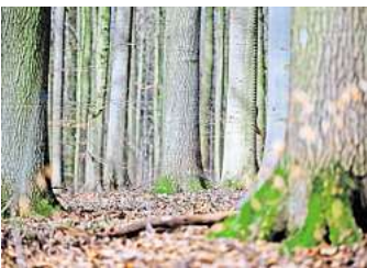
Für eine neue Stromleitung sollen im Stadtwald alte Bäume gerodet werden. Dagegen regt sich Protest.

Außerdem ist eine längere Trasse auch teurer.“ Darüber hinaus würde sich die Alternativtrasse der Wohnsiedlung der Gemeinde Klein Wesenberg deutlich mehr annähern als die von Tennet geplante Variante. Zudem will der Stromleitungsbetreiber eine bestehende 110-Kilovolt-Leitung auf den Masten der neuen Höchstspannungsleitung mitnehmen. Dafür müsse Tennet den Verlauf der neuen Elbe-Lübeck-Leitung in nächster Nähe zu dieser alten Leitung planen. „Dabei sind wir gezwungen,