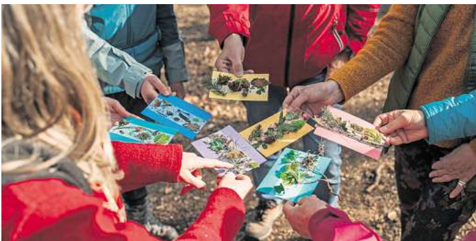
Natur zum Kennenlernen.

Von Mai bis Oktober wird das „Bildungsangebot“ mit den Naturpark-Veranstaltungen für Jedermann und Jede(r) komplettiert. Dank der Erfahrung und dem Wissen der ausgewählten Referenten werden einzigartige Lebensräume und Tier- und Pflanzenarten des Naturparks erlebbar gemacht. Zum Beispiel bei den Seeadler-Beobachtungen, Fledermaus-Safaris, Fossilien-Exkursionen, Kräuter-Kursen, Vogel- oder Bienen und Wespen-Touren oder auch bei Pilz-Wanderungen – für jeden ist das passende Naturerlebnis dabei.