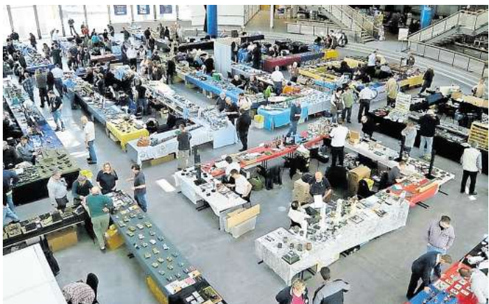
Die Ausstellung des PMCL findet in der MuK statt

LÜBECK. Ein halbes Jahrhundert Modellbau-Leidenschaft: Der Plastik-Modellbau-Club Lübeck (PMCL) feiert sein 50-jähriges Bestehen mit einer großen Jubiläumsausstellung. Am 26. und 27. April öffnet die Musik- und Kongresshalle Lübeck (MuK) ihre Türen für Modellbauer und Besucher aus ganz Deutschland, Dänemark und Österreich. Die Schirmherrschaft für das Jubiläum hat Lübecks Bürgermeister Jan Lindenau übernommen. Der 1975 gegründete Verein hat sich in den vergangenen fünf Jahrzehnten zu einer festen Größe in der norddeutschen Modellbauzene entwickelt. Mit Ausstellungen, die regelmäßig viele Hundert Besucher anziehen, ist der PMCL längst über die Grenzen Lübecks hinaus bekannt. Die diesjährige Jubiläumsschau ist bereits die 20. Ausstellung des Clubs und die zehnte in der MuK – ein deutliches Zeichen für die gewachsene Bedeutung der Veranstaltung. Die erste größere Ausstellung des PMCL fand 1981 statt, die erste in der MuK im Jahr 2002. An beiden Ausstellungstagen wird ein breites Spektrum des Plastikmodellbaus gezeigt. Besucher dürfen sich auf detailreiche Fahrzeuge, Trucks, Lkws, Rennwagen, Flugzeuge, Schiffe, Militärfahrzeuge und Figuren freuen – ebenso auf fantasievolle Modelle aus den Bereichen Science Fiction und Fantasy. Besonders Star-Wars-Fans kommen auf ihre Kosten. Auch die Lübecker Modellbahnfreunde sind mit ihrer HO-Modulanlage vertreten und bieten spannende Einblicke in den Anlagenbau. Ein weiteres Highlight: Der