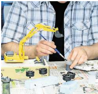
Die Besucher können den Modellbauern auch bei ihrem Hobby zuschauen.

PMCL feiert zugleich das 25-jährige Bestehen seiner Freundschaft mit den Modellbaufreunden aus Ried in Österreich – eine gelebte internationale Verbundenheit im Zeichen des gemeinsamen Hobbys. Zum Jubiläum wirft der Club auch einen Blick zurück ins Gründungsjahr 1975. Gezeigt werden Modelle aus jener Zeit sowie Bau-sätze, die damals im Handel erhältlich waren – von Marken wie Airfix, Revell, Matchbox oder Frog, mit denen viele der heuti-