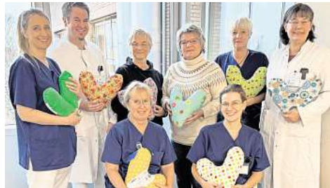
So sehen die Herzkissen am Ende aus. Eingesetzt werden sie zum Beispiel als Lagerungskissen oder Nackenstütze.