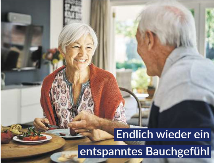
Endlich wieder ein entspanntes Bauchgefühl

Magen-Tropfen, sorgen sechs clever kombinierte natürliche Wirkstoffe für eine deutlich spürbare, schnelle „Erste Magen- und Verdauungshilfe“. Bitterstoffe aus Wermut-, Benediktenkraut und Angelikawurzel steigern rasch die Speichelproduktion und stoßen im Magen-Darm-Trakt die Produktion von Gallensaft und Magensäure an. 1,2 Dank Gänsefingerkraut, Süßholzwurzel sowie Kamillenblüten entspannen Magen und Darm.