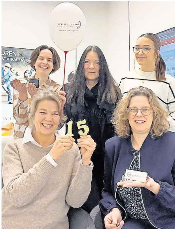
Das Schmelzer-Team in Stockelsdorf feiert und präsentiert die Hörsysteme der aktuellen Werbekampagne.

Die familiäre Unternehmenskultur wird dabei großgeschrieben: