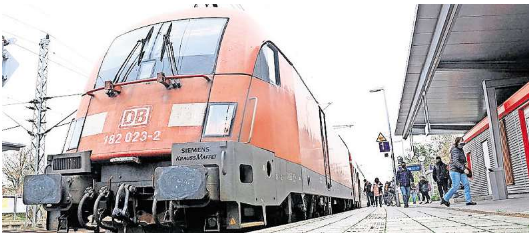
Ein Regionalexpress im Bahnhof Büchen. Der Haltepunkt wird wegen der Streckensanierung Hamburg-Berlin eine Zeit lang nicht per Zug erreichbar sein.

Reisende von und nach Schwerin oder Rostock können die Strecke über Bad Kleinen und Lübeck nutzen. Deshalb soll zwischen diesen beiden Städten eine neue Bahnlinie RE2 eingerichtet werden. In welchem Takt sie fährt, ist noch nicht festgelegt. Dass auf der Strecke Doppelstockwagen eingesetzt werden, um die Platzzahl deutlich zu erhöhen, ist jedoch sicher. Weil aber die Doppelstockwagen schwerer sind und es länger dauert, sie nach einem Halt auf Tempo zu bringen, sollen einige Bahnhaltspunkte nicht mehr angefahren werden, sagt Künkel.