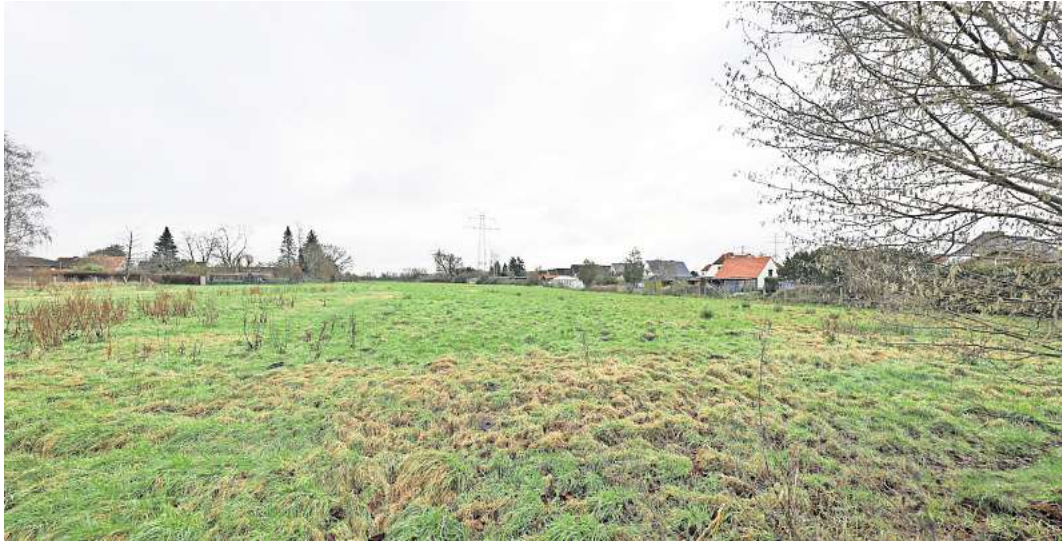
Das Baugebiet Niendorf zwischen Hellkamp und Holzkoppel in Moisling: Das Marco Fibelkorn Baumanagement aus Lübeck entwickelt hier Einfamilienhäuser unterschiedlicher Größe.

Der Paragraph 13b im Baugesetzbuch erlaubte es Kommunen, für kleine Freiflächen in Randlagen einen Bebauungsplan im beschleunigten Verfahren,