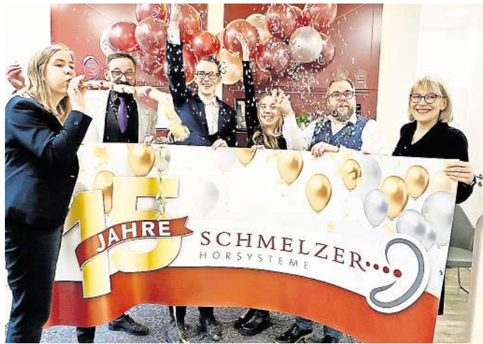
Das Team in Glinde feiert - hier begann die Erfolgsgeschichte des Familienunternehmens.

Ob in Tritttau, Travemünde, Lübeck oder Geesthacht – Schmelzer Hörsysteme ist die erste Adresse für Menschen, die auf