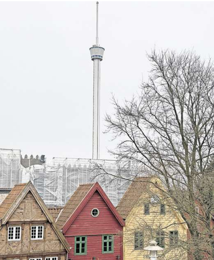
Der Holsteinturm im Hansa-Park muss weichen.

Der Auftrag im Freizeitpark habe aber auch für das erfahrene Team ein wenig Planung erfordert. „Die Gondel musste mittels der Kräne heruntergeholt werden, weil das Fahrgeschäft einen Getriebschaden hatte“, erzählt Torge Boje, Disponent des Unter-