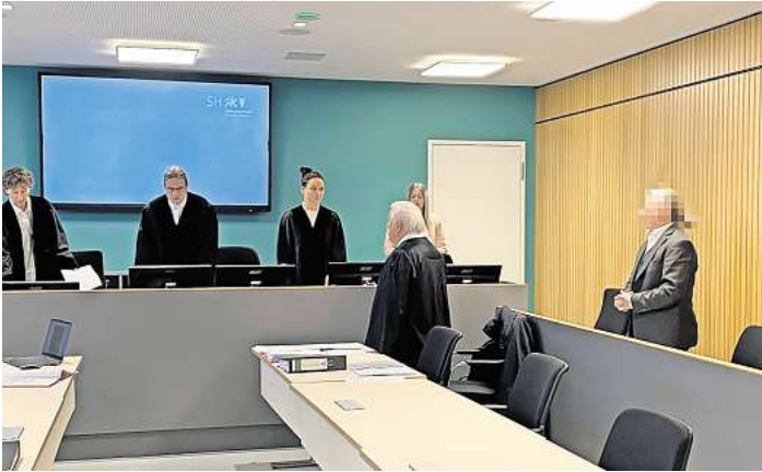
Der 55-Jährige (2. v. r.) wurde vor dem Landgericht zu einer Freiheitsstrafe verurteilt.

Was in dem Restaurant an der Scharbeutzer Promenade pas-