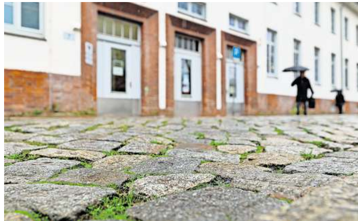
Am Meesenring soll der Übergang zum Bürgerservicebüro neu gepflastert werden.