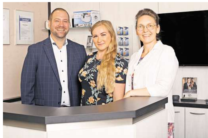
Erstklassigen Service und hohe Qualität bietet auch das Team von Hörgeräte Kersten in Stockelsdorf.

■ Hörgeräte Kersten Rathausmarkt 2b 23617 Stockelsdorf Telefon 0451 / 49 91 29 3 www.hoergeraete-kersten.de