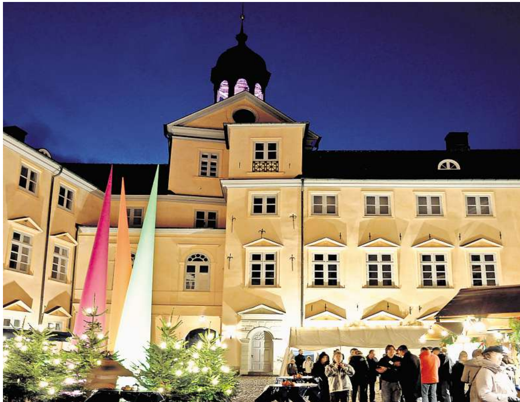
Bei der Kiwanis „Weihnacht im Schloss“ herrscht eine feierliche Stimmung.