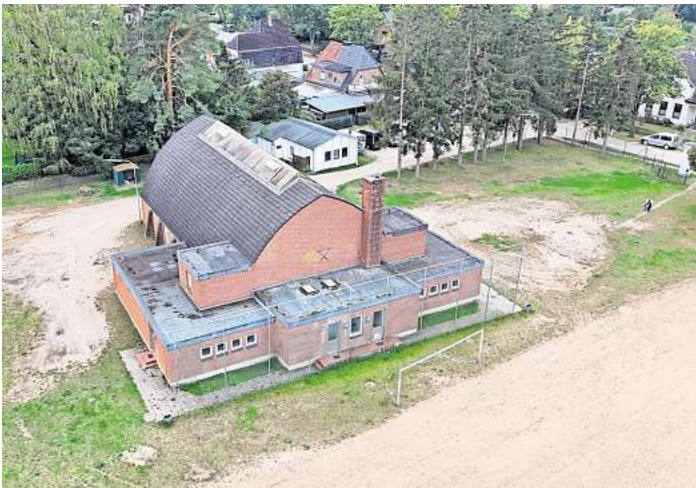
Die Turnhalle in der Ringstraße soll abgerissen werden. Dort soll ein Containerdorf für Flüchtlinge entstehen.

Diesen Verlust könne auch die Anmietung einer ehemaligen Pension in Krummsee mit etwa 40 Plätzen nicht kompensieren. Eigentlich müsse die Gemeinde derzeit noch 64 Geflüchtete aufnehmen. Und weil man für 2025