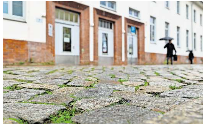
Am Meesenring soll der Übergang zum Bürgerservicebüro neu gepflastert werden.