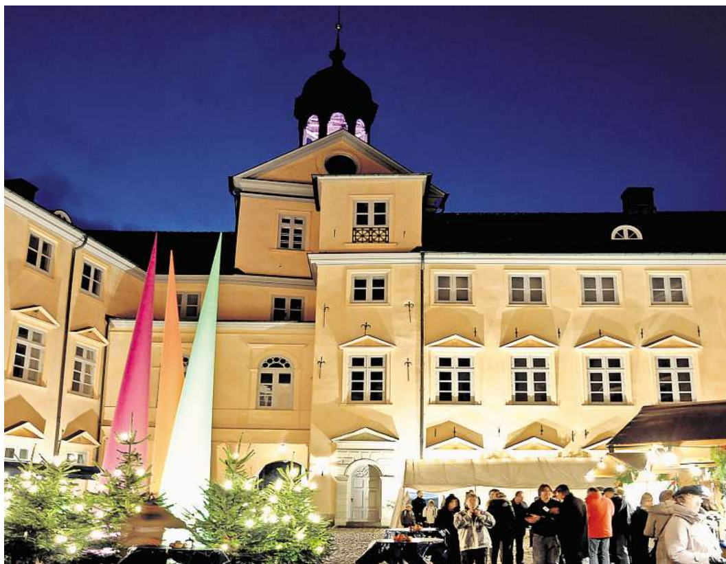
Bei der Kiwanis „Weihnacht im Schloss“ herrscht eine feierliche Stimmung.