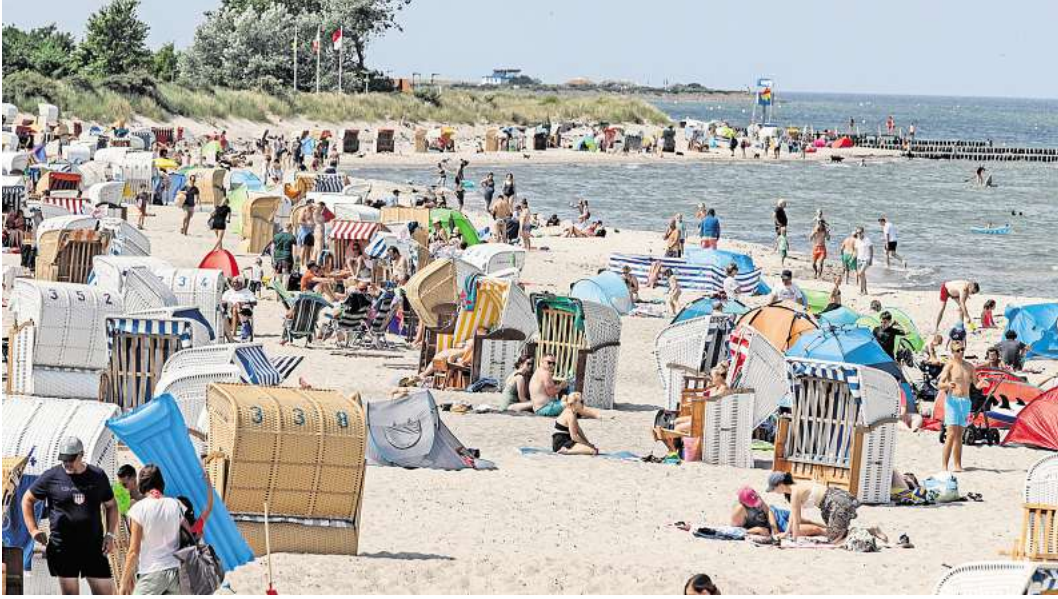
Sommerspaß am Strand von Heiligenhafen. In diesem Urlaubsort wird von 2025 an die Kurabgabe sowohl für den An- als auch für den Abreisetag berechnet.

„In der Hotellerie und in den Ferienwohnungen gehen die Beschwerden jedoch gegen null“, führt Lütje aus. Ein Grund sei vermutlich, dass die Kurabgabe nicht mehr so umstritten sei wie einst. „Heute sehen die Gäste klar, welche Infrastruktur ihnen dafür geboten wird.“ Die Einnahmen steigen seinen Angaben zufolge durch die Berechnung von An- und Abreisetag um 700.000 Euro pro Jahr.