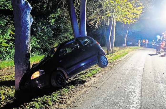
Das Auto schlug frontal mit der Beifahrerseite gegen den Baum. Die Fahrerin konnte durch Ersthelfer gerettet werden.

TIMMENDORFER STRAND. Die ev.-luth. Kirchengemeinde in Timmendorfer Strand bietet ein monatliches Treffen donnerstags von 19 bis 21 Uhr für Menschen, die ein kreatives Hobby haben, an. Sei es Kalligrafie, unterschiedlichste Strick- und Stickarbeiten, Aquarell-Malerei, schwe-