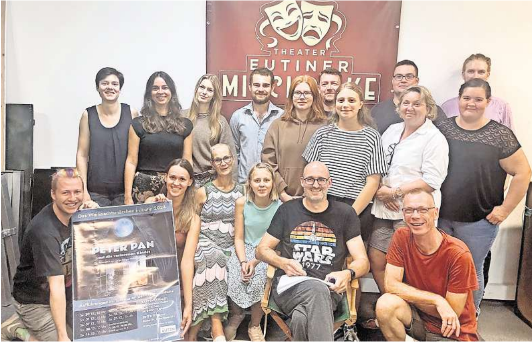
Sie proben schon seit Wochen und freuen sich darauf, Kindern in der Adventszeit mit ihrem Weihnachtsmärchen schöne Stunden zu bereiten: die Mitglieder der Eutiner Mischpoke.