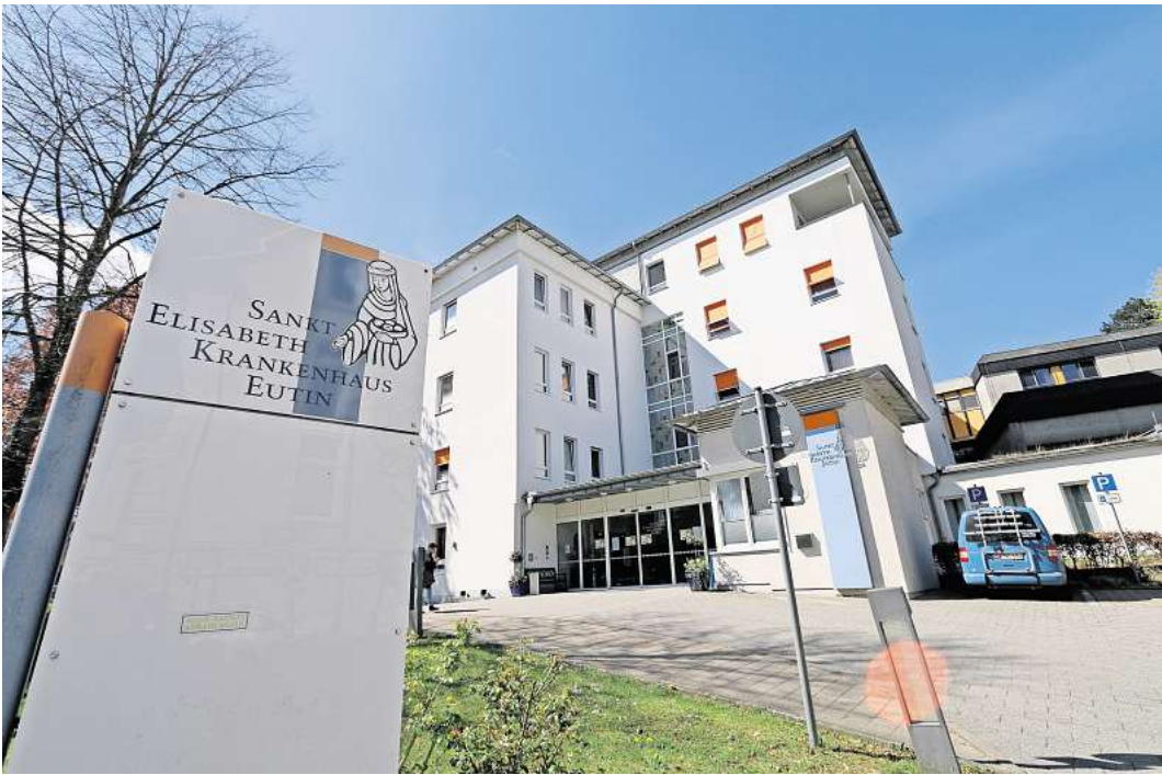
Das Elisabeth-Krankenhaus in Eutin. Derzeit wird ein neues Gebäude gebaut, um das Angebot zu erweitern.

Zugleich betont sie, dass keine Leistungen wegfallen werden. Stattdessen gehe es darum, bestehende Angebote auszubauen. Unter anderem plane man die Einrichtung einer palliativmedizinischen Tagesklinik. Weiter kündigt Kloor an: „Wir bauen aufgrund des großen