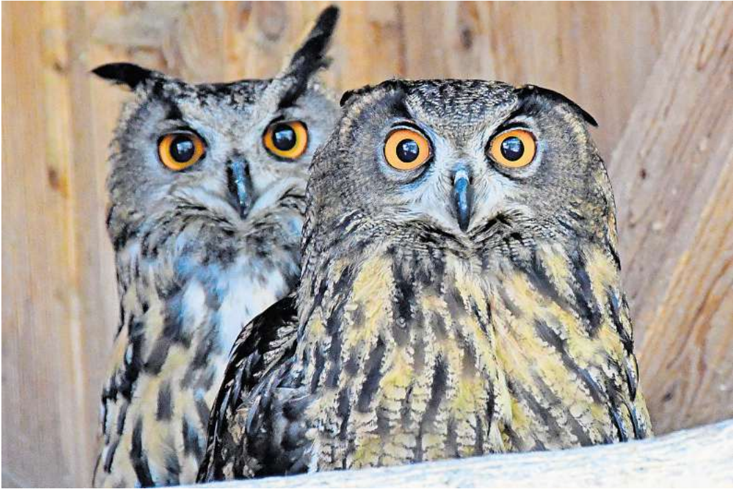
Diese beide Uhus werden in der Auffangstation in Kasseedorf versorgt.

2023 ist eine der beiden Volieren instand gesetzt worden. Das glückte dank 8000 Euro von der Umweltlotterie Bingo. In diesem Jahr muss die zweite erneuert werden. Auf 10.000 bis 20.000 Euro schätzt Otto Witt die Kosten. Der gemeinnützigen Organisation werde ab und zu mit Bußgeldern, die ihnen von Gerichten zugewiesen werden, unter die