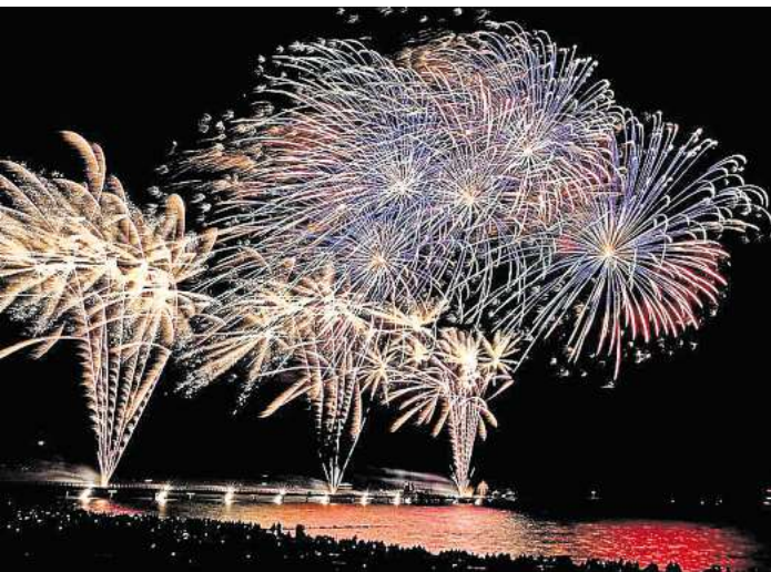
Profi-Feuerwerk: Ostsee in Flammen bietet in Grömitz eine Show der Superlative.

Neue Effekte und Formen samt perfekt abgestimmter Musikin-szenierung versprechen die Experten der Ostsee-Pyrotechnik für ihr Gesamtkunstwerk. „Wir lassen uns jedes Jahr etwas Neues einfallen“, sagt Chef-Pyrotechniker Benjamin Austen. Was gleich bleibt: Zwei Tonnen Sprengstoff werden zum Einsatz kommen. Fünf Musikstücke, querbeet, wird es geben, inklusive eines „epischen Openings“,