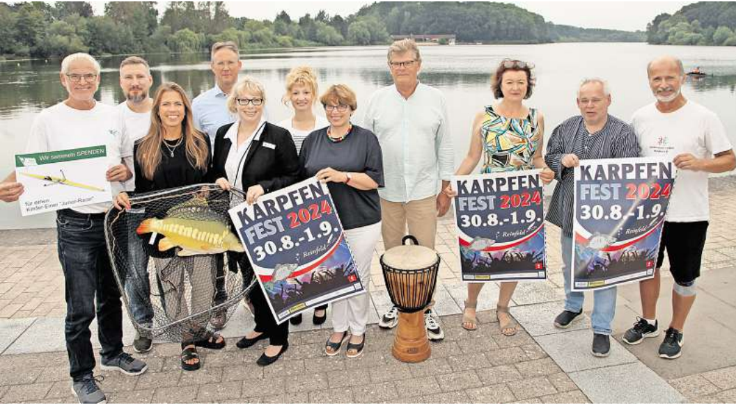
Veranstalter und Akteure freuen sich auf das Karpfenfest Reinfeld.