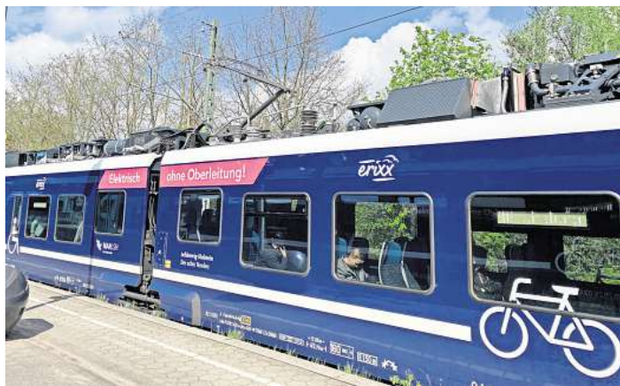
Akkuzüge des Unternehmen Erix Holstein bedienen die Strecke Lübeck–Kiel und können nach dem Ausbau schneller fahren.

Damit die Züge sicher und vor allem 40 Kilometer pro Stunde schneller als bisher durch Techau fahren können, wird ab 2027 der