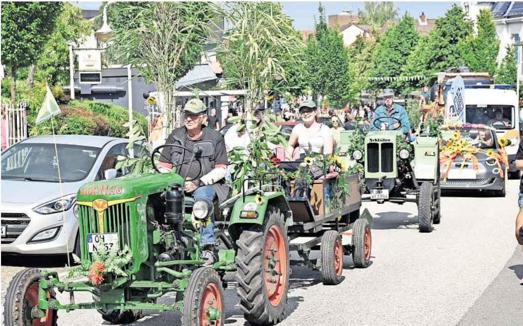
Am Umzug zum Schützenfest Malente kann man auch spontan am Sonnabend teilnehmen.

MALENTE. Die Einschulung in der Gemeinde Malente erfolgt am 4. September. An der Grundschule Malente (Marktstraße 2) geht es für die Klassen 1b und 1d um 9 Uhr los, für die Klassen 1a und 1c um 11 Uhr. Treffpunkt ist das Schulgelände. Vorher finden um 8.30 und 10.30 Uhr ein freiwilliger Gottesdienst in der Maria-Magdalenen-Kirche statt. An der Grundschule Sieversdorf (Dorfstraße 96) ist der Start um 9.30 Uhr mit einem Einschulungsgottesdienst auf dem Schulhof. Dann werden die „Neuen“ von der Theater AG mit einer Aufführung begrüßt. 10.30 Uhr beginnt der erste Unterricht, Schluss ist gegen 11.15 Uhr.