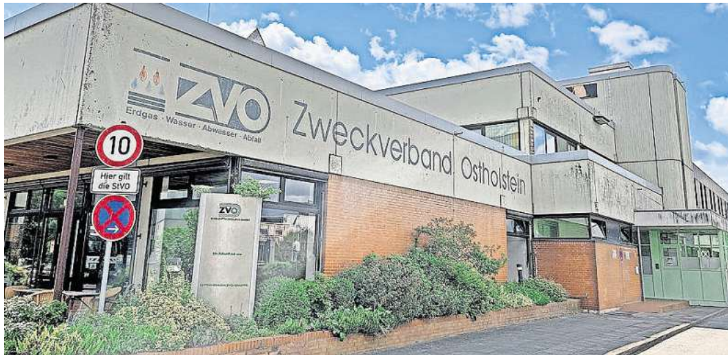
Der ZVO will 525 Millionen Euro in die Infrastruktur investieren.