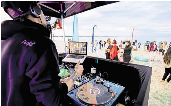
Silent Disco in Scharbeutz

Info: www.luebecker-bucht-ostsee.de/veranstaltungskalender