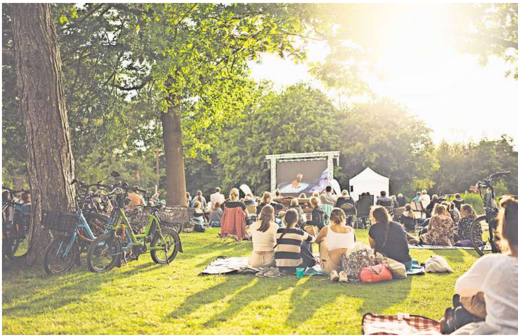
Das kann ein perfekter Sommerabend werden: bei Kino am See.

Vom 12. bis 14. Juli gibt es im Schlosspark Open Air Kino mit Seeblick.