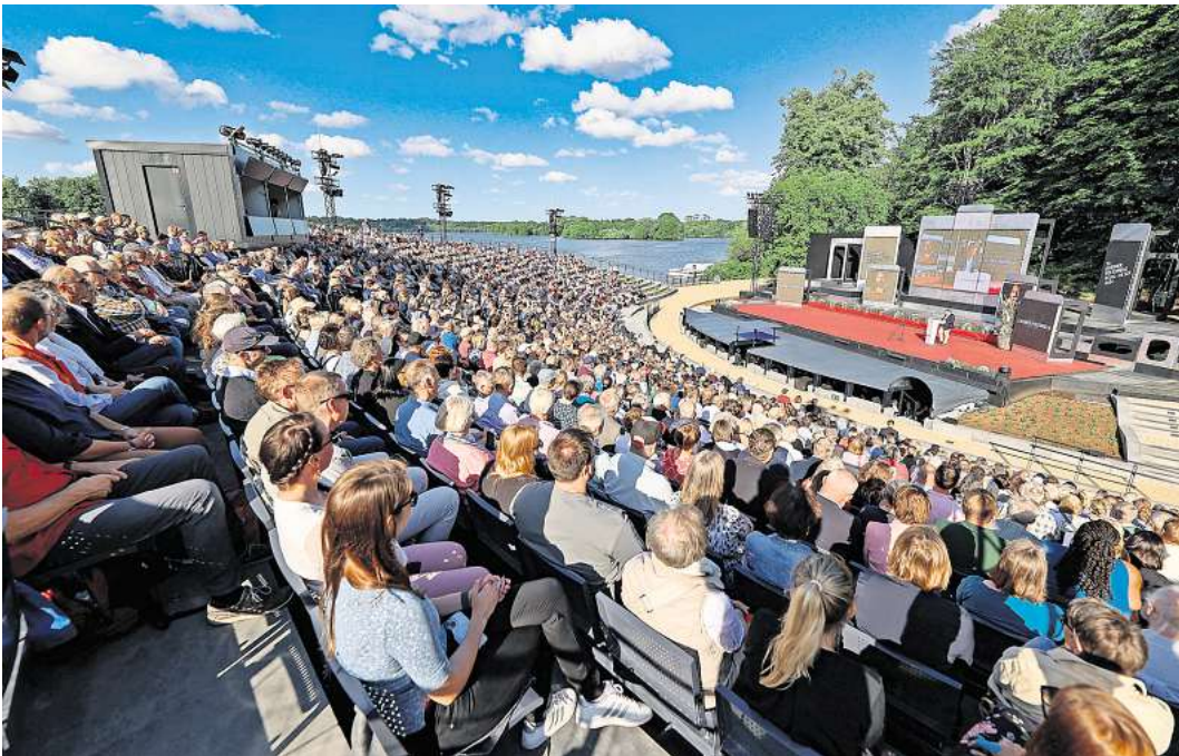
Schönster Sonnenschein zur Eröffnung: 2000 Zuschauer durften die neue Tribüne der Eutiner Festspiele testen.

Ebenfalls vor Ort und derzeit im Eröffnungs-Fieber war Schles- wig-Holsteins Ministerpräsident Daniel Günther (CDU). „Erst Kie- ler Woche, heute hier, dann die