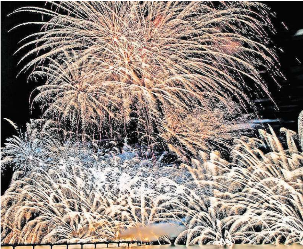
Von vielen gefeiert: Ostsee in Flammen steigt dieses Jahr am 30. August.

LÜBECK/KIEL/ROSTOCK. Zwischen den Strandkörben hängen bunte Ballons. Überall sitzen kleine und große Personengruppen. Vom Seebückenvorplatz hallt Musik herüber. Auf der Promenade schlendern Tausende Menschen umher. Wenn Ende August in Grömitz Ostsee in Flammen steigt, reisen Zehntausende Feuerwerk-Fans an. Das ist kein Einzelphänomen an der Ostsee. Zahlreiche Orte – von Kiel bis zur Insel Usedom – setzen auf aufwendige Shows mit Pyrotechnik, Lichtelementen und Musik. In Zukunft sind auch drohnengestützte Lichtspektakel möglich. Alles rund um das Thema Urlaub stets im Blick hat im nördlichsten Bundesland die Tourismus-Agentur Schleswig-Holstein. Sprecherin Manuela Schütze ist der Auffassung, dass Feuerwerke für Urlaubsgäste kein Reiseanlass sind. „Allerdings sind attraktive Veranstaltungen vor Ort für die Beliebtheit einer Region beziehungsweise eines Ortes wichtig. Die Menschen möchten sich erholen, aber ebenfalls etwas erleben“, sagt sie. Und Light-Events seien eben besonders attraktiv. „Licht in der Dunkelheit, das zieht viele Menschen magisch an“, verdeutlicht sie. Dabei reiche die Palette der Veranstaltungen von Fackelwanderungen, Lichtinstallationen und inszenierten Erlebniswelten, sogar ganzen Lichterstädten, über kleine und große Feuerwerke bis zu technisch aufwendigen Lightshows. Zugleich entwickle die Eventbranche neue Formate wie Laser- oder drohnengestütz-