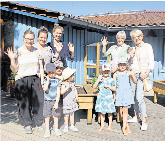
Das pädagogische Team des Küchengarten Eutin unterstützt Kitas und Schulen beim Gärtnern.

Gisela Koller ist die erste Zeit- spenderin, die vor kurzem eine