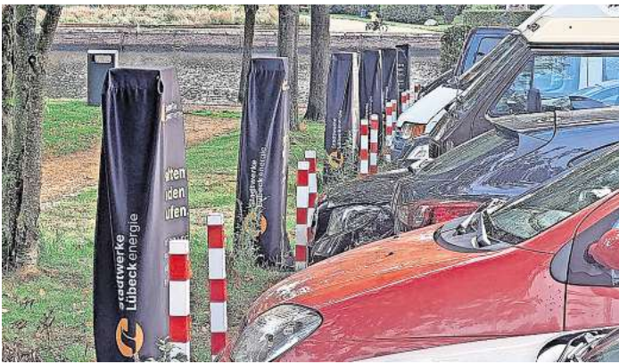
An der Kanalstraße wurde im vergangenen Jahr ein Ladesäulen-Park für E-Autos angelegt.

Im Stadtbezirk Holstentor Nord besteht Bedarf zwischen der Fackenburger Allee und Schwartauer Allee sowie beidseits der Schönböckener Straße und der nordöstlichen Ziegelstraße. In Dornbreite fehlen Stromtankstellen westlich der Friedhofsallee. In St. Lorenz Süd besteht vordringlicher Bedarf westlich der Moislinger Allee bis zu den Bahngleisen und südlich bis zur Wendischen Straße. Im Bezirk Huxtertor ist der größte Bedarf rund um die Sana-Kliniken entlang der Berliner Straße und dem