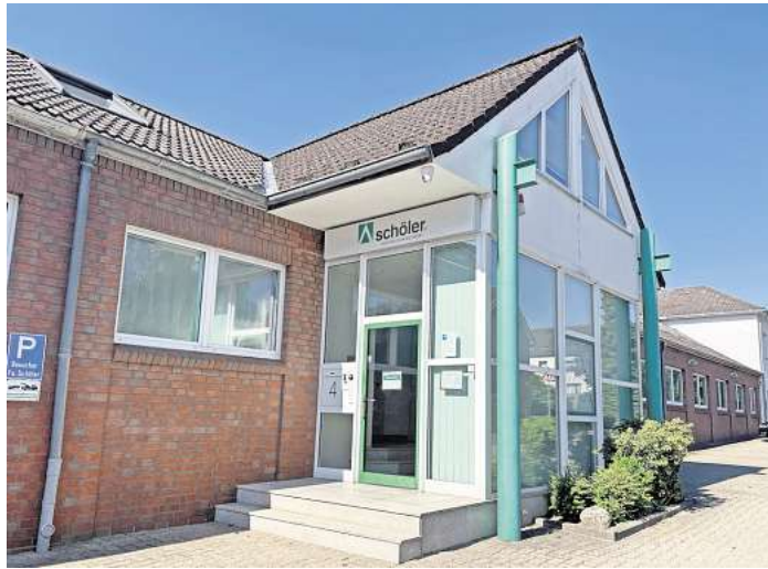
Der Unternehmenssitz der Maschinenbau-Firma Schöler in Pansdorf: Aktuell läuft der Betrieb trotz Insolvenz normal weiter.

Ende Mai wurde das Insolvenzverfahren vor dem Amtsgericht Eutin eröffnet. Betroffen sind 144 Mitarbeiter. Sie erhalten noch bis Ende Juli Insolvenzgeld. „Bisher hat niemand von ihnen gekündigt“, betont der vorläufige Insolvenzverwalter. Er führt das Unternehmen aktuell fort und will versuchen, möglichst viele Arbeitsplätze zu erhalten. Die Aussichten seien gut: „Die Schöler GmbH ist ein beeindruckendes Beispiel für die Innovationskraft, Relevanz und Resilienz eines schleswig-holsteini-