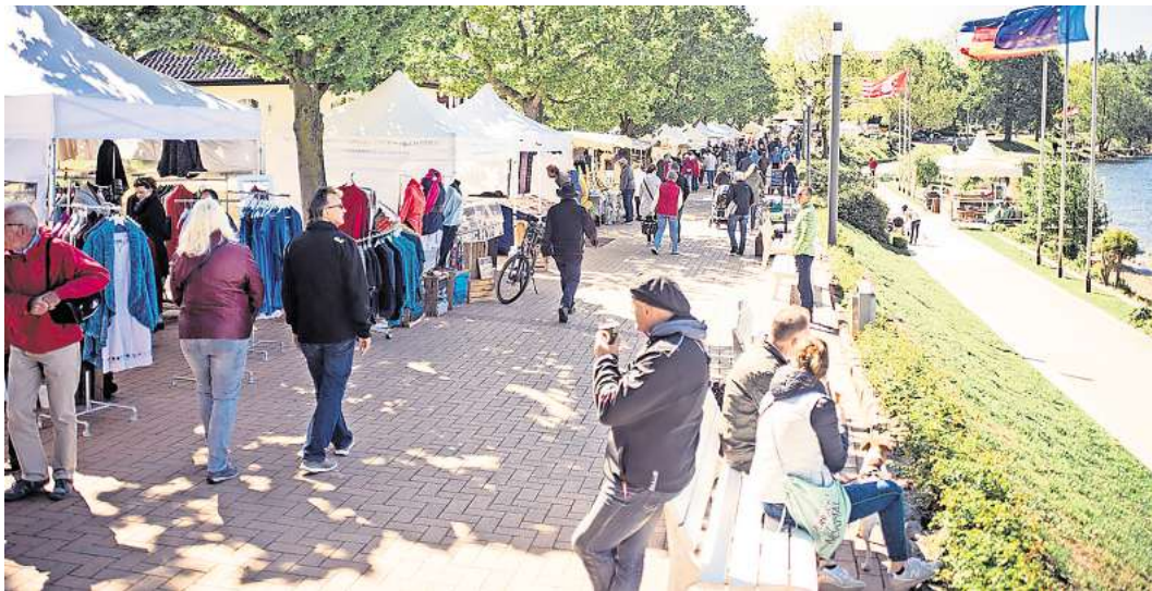
Der neue Malenter Landmarkt wird in diesem Jahr auf der Diekseepromenade stattfinden. Im Mai fand dort bereits der Kreativmarkt statt (Foto). Fokusweite.de

Aus dem Malenter Bauernmarkt wird der Malenter Landmarkt.