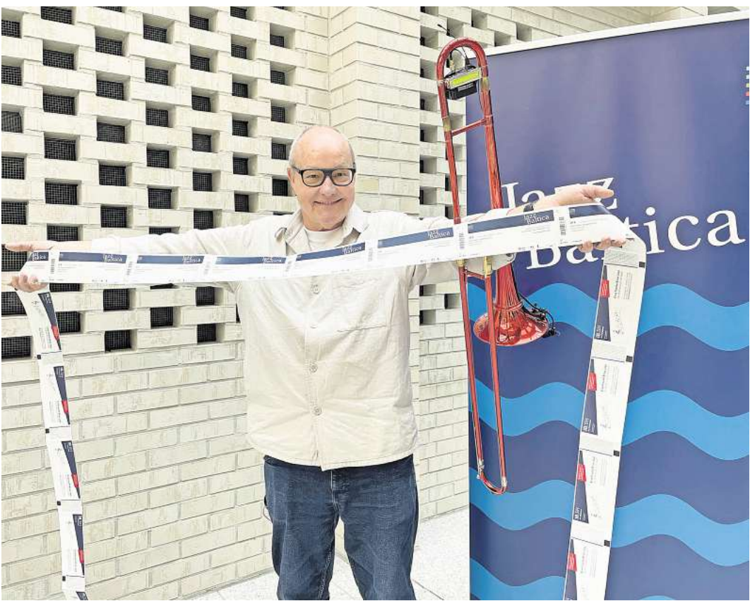
Will allen Kindern die spannende Welt der Musik zu eröffnen: Nils Landgren.

LÜBECK/ TIMMENDORFER STRAND. Vor wenigen Wochen ist die Kulturtafel mit dem neuen Projekt „Kulturkinder“ an den Start gegangen. Es richtet sich gezielt an Kinder aus einkommensschwachen Familien und ermöglicht diesen kostenfreien Zugang zu kulturellen Veranstaltungen. Nun erfährt das Projekt prominente Unterstützung durch Nils Landgren: Der berühmte Jazzmusiker lädt die „Kulturkinder“, sprich die kleinen Gäste der Kulturtafel, zu seinem Familienkonzert ein, das am 30. Juni im Rahmen von JazzBaltica stattfindet. „Kinder sind unsere Zukunft. Ihnen die spannende Welt der Musik zu eröffnen, ist mir ein großes Anliegen. Und daran sollten alle Kinder teilhaben können – unabhängig vom Geldbeutel! Deshalb unterstütze ich das Projekt aus vollem Herzen und heiße alle Kulturkinder der Kulturtafel bei JazzBaltica herzlich willkommen“, sagt Nils Landgren. Und damit nicht genug: Das Schleswig-Holstein Musik Festival – das JazzBaltica veranstaltet – unterstützt die Kulturtafel in diesem Sommer wieder mit einigen hundert Tickets. So dürfen die „großen“ Gäste der Kulturtafel unter anderem dem Schleswig-Holstein Festival Orchester in der Musik- und Kongresshalle lauschen oder beim Konzert von