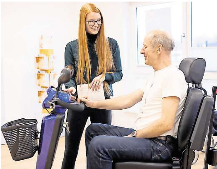
Kunden erhalten im Sanitätshaus Ostsee-Medizintechnik eine kompetente Beratung.