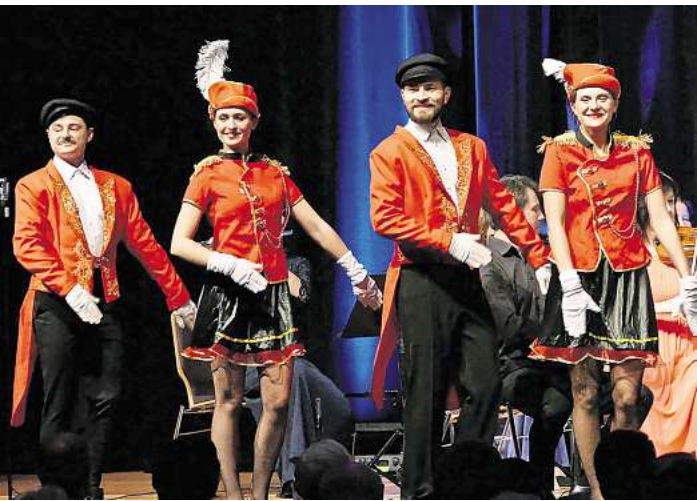
Das Ensemble entführt die Zuschauer in die fantastische Welt des Walzerkönigs Johann Strauss.