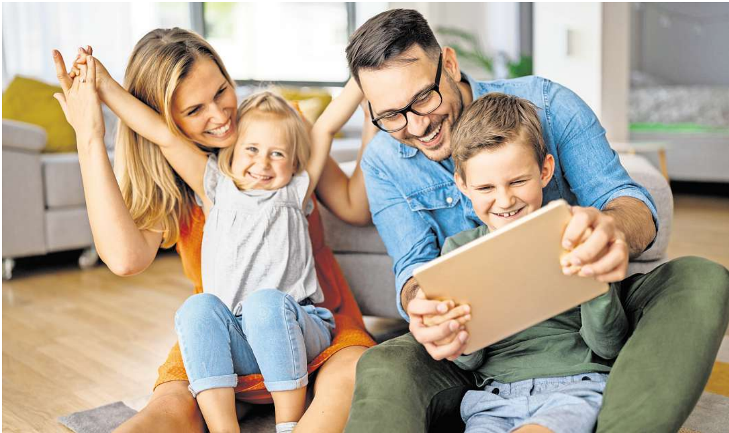
Mit dem LN Digital Abo sind Sie stets mittendrin.

Mit LN Digital sind Sie rund um die Uhr informiert. Ganz gleich, ob Sie in der Ostsee Therme ent-