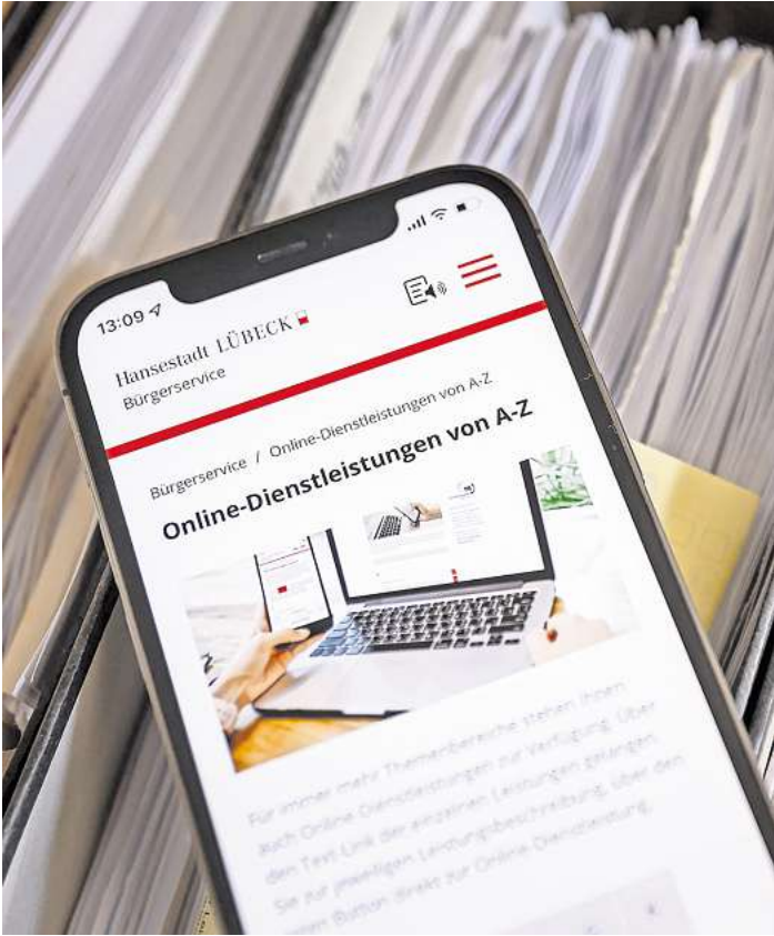
Die Hansestadt bietet bereits verschiedene digitale Dienstleistungen an. Zusätzlich können nun auch bei der Ausländerbehörde Anliegen von zu Hause oder von unterwegs aus erledigt werden.

Alle Inhalte seien auch mehrsprachig abrufbar. Die Übersetzung aller Seiten erfolge über DeepL, dem Onlinedienst für maschinelle Übersetzung. Die LN baten das Forum für