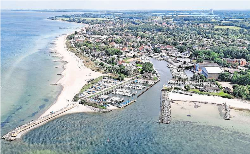
Niendorf liegt direkt an der Ostsee und gehört zu Timmendorfer Strand. Immobilien sind hier sehr stark nachgefragt und Schnäppchen Mangelware.