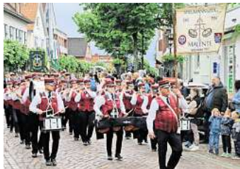
Der Spielmannszug im TSV Malente.

Das Konzert beginnt um 14:30 Uhr und endet um 16:30 Uhr. Der Eintritt ist frei und eine Anmeldung ist nicht erforderlich. Bei schlechtem Wetter fällt die Veranstaltung leider aus.