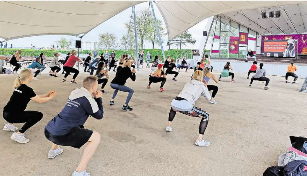
Während der Fitness Convention können verschiedene Formate ausprobiert werden.