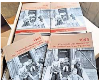
Begleitbroschüre zur Sonderausstellung.

SCHARBEUTZ. Die viel beachtete Sonderausstellung „1945 - Kriegsende und Neubeginn. Die Lübecker Bucht vor 75 Jahren“ im Museum für Regionalgeschichte in Pönitz widmete sich im Jahr 2020 der Zeit vom 3. Mai 1945 (Besetzung Ostholsteins durch die britische Armee und Tragödie der Cap Arcona) bis etwa 1950. Dazu wurde eine Broschüre verfasst, die deutschlandweit Beachtung gefunden hat und deren zweite Auflage 2023 völlig ausverkauft war. Da aber unvermindert eine Nachfrage besteht, wurde jetzt eine dritte Auflage gedruckt. Die neu aufgelegte Broschüre ist nun im Museum zu den Öffnungszeiten für 6 Euro