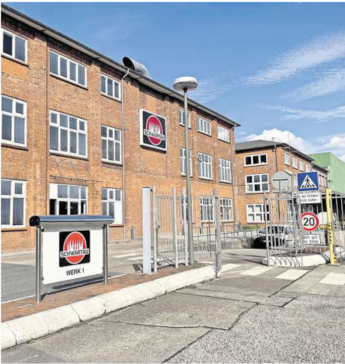
Die Schwartauer Werke in der Lübecker Straße gibt es bereits seit 125 Jahren. Vor genau 100 Jahren entwarf der Künstler Alfred Mahlau das Logo mit den sieben Türmen.

Hinzu kommt, dass sich immer mehr Menschen selbstständig machen. Die Entwicklungsgesellschaft Ostholstein (Egoh) begleitet Gründer. In den ersten beiden Monaten des Jahres verzeichnete sie einen deutlichen Anstieg der Beratungstermine. „39 Gründungen und Unternehmen vor allem aus dem Handwerk, dem Bereich Coaching sowie aus Handel und Dienstleistungen konnten erfolgreich betreut und begleitet werden“, heißt es. Derweil steigt die Zahl sogenannter Coworkingräume. Wer für einige Tage, Wochen oder Monate unweit der Ostsee arbeiten möchte, kann sich unter anderem in Neustadt und Niendorf einen