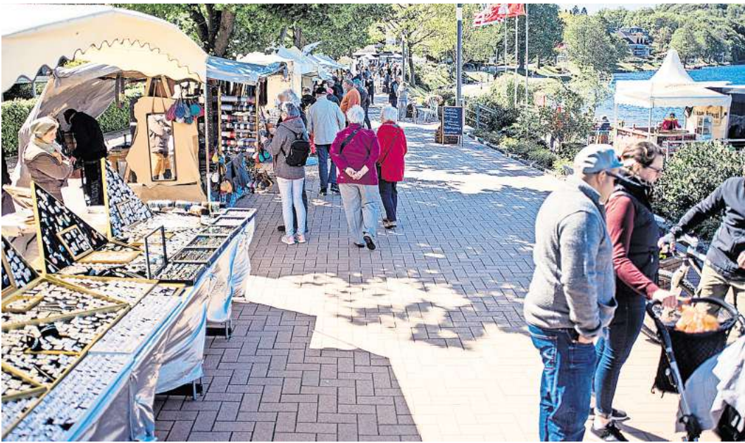
Der Kreativmarkt am Dieksee findet am 11. und 12. Mai in Malente statt.

Programm bis 8. Mai: ► „Zoonicorn - Traumhafte Abenteuer“ Sa. u. So. 15 Uhr ► „Garfield – Eine Extra Portion Abenteuer“ So. 15.30 Uhr ► „Arthur der Große“ Do. bis So., Di. und Mi. 17 Uhr ► „Max und die Wilde 7: Die Geister-Oma“ Do., Fr. 17.15 Uhr, Sa. 15.30 u. 17.30 Uhr, So. 17.30 Uhr, Di. u. Mi. 17.15 Uhr ► „Sterben“ Do. bis So., Di. und Mi. 19.15 Uhr ► „Es sind die kleinen Dinge“ Do. bis So., Di. und Mi. 20 Uhr