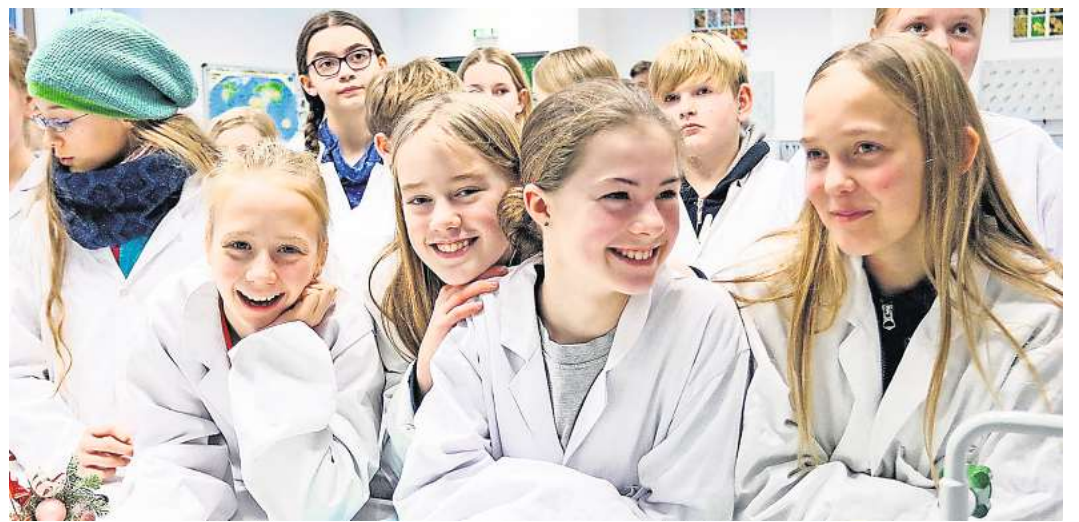
Das Experimentieren beginnt an der Weber-Schule bereits bei den Jüngsten.