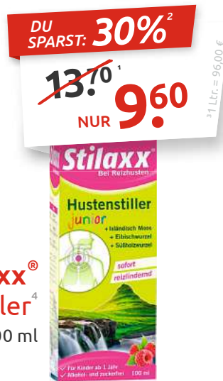
Stilaxx® Hustenstiller 100 ml