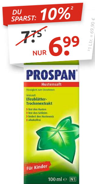
Prospan® 100 ml Hustensaft