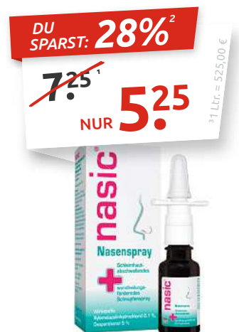
nasic® 10 ml Spray