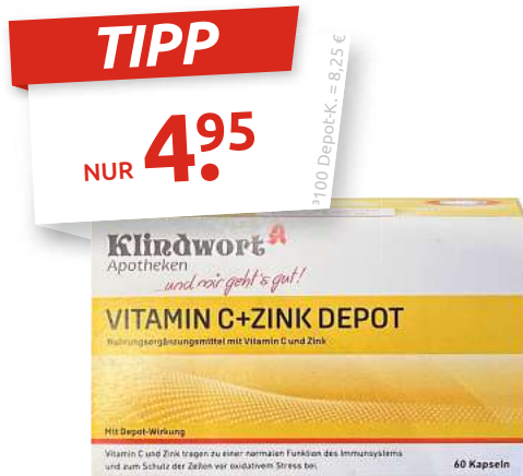
Klindwort Vitamin C + Zink 60 Depot-Kapseln