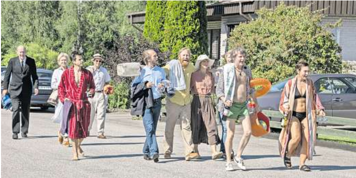
Eine Szene aus „Together 99“. Teppiche webt. Beide fühlen einen Stillstand im Leben. Plötzlich aber steht der Rest der Bande vor der Tür, denn Göran hat Geburtstag. Die ehemaligen Mitbewohnerinnen und Mitbewohner mögen einander fremd geworden sein, doch es gibt noch Reste der ehemaligen Nähe und Vertrautheit. Alte Lieben stehen plötzlich wieder im Raum, immer noch wird über dieselben

LÜBECK. „Together 99“ heißt der Film, mit dem die Nordischen Filmtage eröffnet werden. Die Komödie des schwedischen Regisseurs Lukas Moodysson feiert in Lübeck ihre Deutschlandpremiere. Erstmals gezeigt wurde sie beim renommierten Filmfestival in Toronto. „Together 99“ knüpft an Moodyssons Film „Zusammen“ an. Die Arbeit aus dem Jahr 2000 erzählt von einer Kommune, in der sich in den 70er Jahren die unterschiedlichsten Menschen zusammenfinden. „Together 99“ spielt im Jahr 1999, und die Kommune ist inzwischen auf zwei Leute geschrumpft: Göran, der sich das Spontihafte von damals bewahrt hat, und Klasse, der immer noch