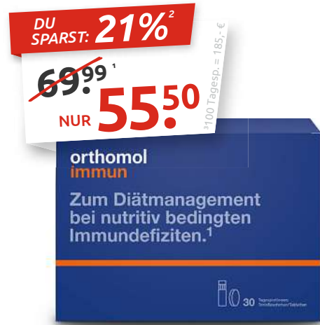
orthomol® immun 30 Tagesportionen

1 Gesamtpreis des Artikels der letzten 30 Tage in unseren Filialen, oder wenn so angegeben, der AVP (= Apotheken-Ver- kaufs-Preis laut Lauer Taxe). Dieser Preis ist gültig laut gesetzlicher Regelung (§78 AMG) bei Abgabe zu Lasten der ge- setzt. Krankenkassen, bzw. UVP (= Unverbindliche Preisempfehlung des Herstellers). 2 Sie sparen“-Angaben beziehen Sie auf unseren 30-Tage-Gesamtpreis oder ggf. auf den AVP, bzw. UVP. 3 Grundpreis (gemäß § 2 PAngV v. 28.Mai 2022) ist der Preis inkl. Umst. je Mengeneinheit. 4 Zu Risiken und Nebenwirkungen lesen Sie die Packungsbeilage und fragen Sie Ihren