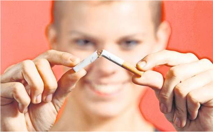
„Be Smart – Don’t Start“ findet in diesem Schuljahr vom 13. November 2023 bis zum 26. April 2024 statt.

Eine Teilnahme lohnt sich jedoch nicht nur aus gesundheitsförderlichen Aspekten: Unter allen erfolgreichen Klassen werden wertvolle