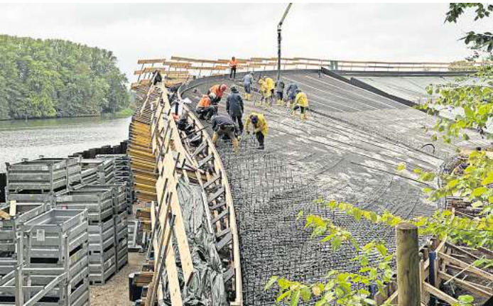
Die Arbeiter gießen mithilfe der Betonpumpe den flüssigen Beton in die Tribünenschale.

126 000 Euro) höher. Der Regiecontainer muss alljährlich angeliefert, aufgebaut, nach der Spielzeit abgebaut, abgeholt und eingelagert werden. Festspiele-Geschäftsführer Falk