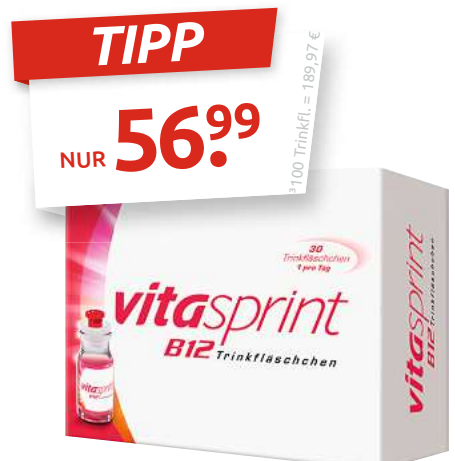
vitasprint B12 30 Trinkfläschen