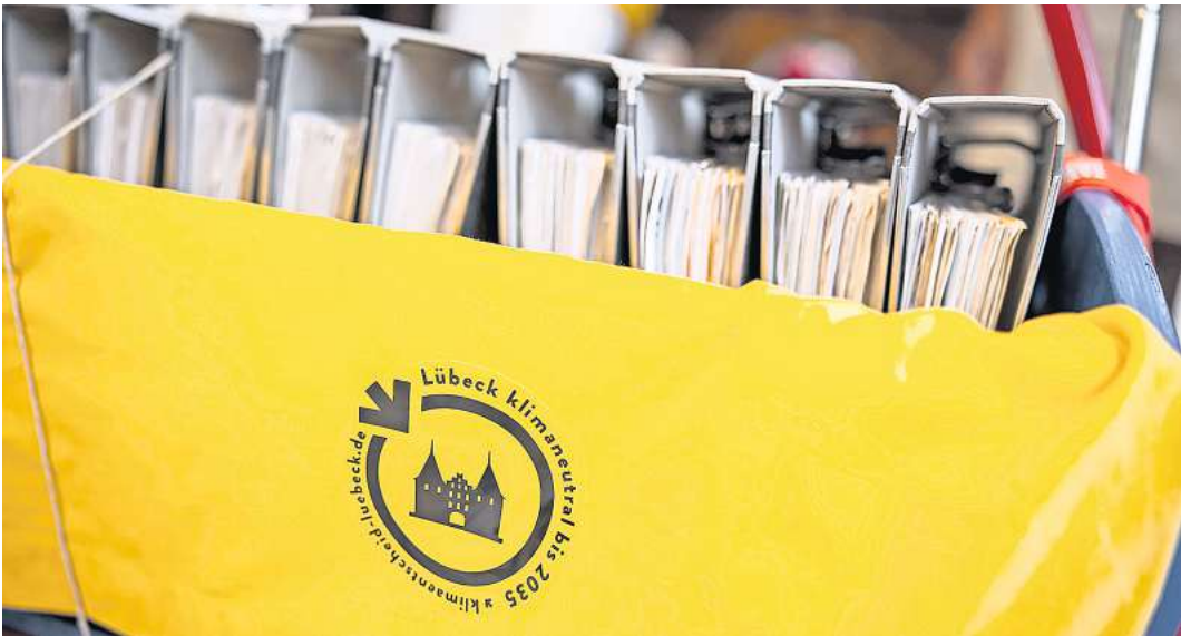
Mit den gesammelten Unterschriften der Bürger hat die Initiative Klimaentscheid das Quorum erreicht.