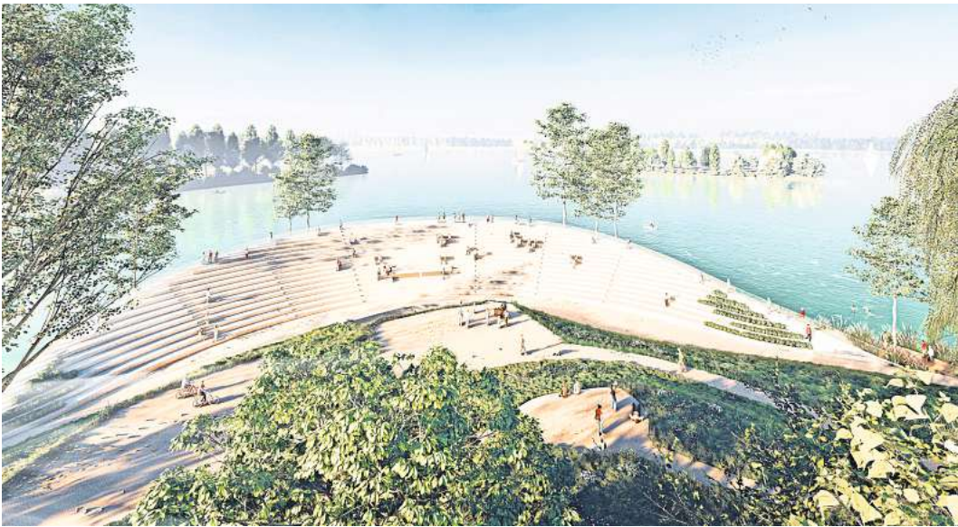
So soll die fertige Tribüne am Großen Eutiner See aussehen. Architekt Holger Moths möchte, dass sie als öffentlich zugängliche Skulptur im Schlossgarten wahrgenommen wird. Visualisierung: Prof. Moths Architekten

Bei einigen Gewerken wurden zwar günstigere Preise aufgerufen als erwartet, die Metallbauarbeiten aber werden fast doppelt so teuer wie veranschlagt: statt geschätzter 1,134 Millionen Euro werden dafür 2,254 Millionen Euro verlangt. Auch die Kostenberechnung für den Regiecontainer wird deutlich überschritten. Das Angebot liegt um 63 Prozent (Mehrkosten rund