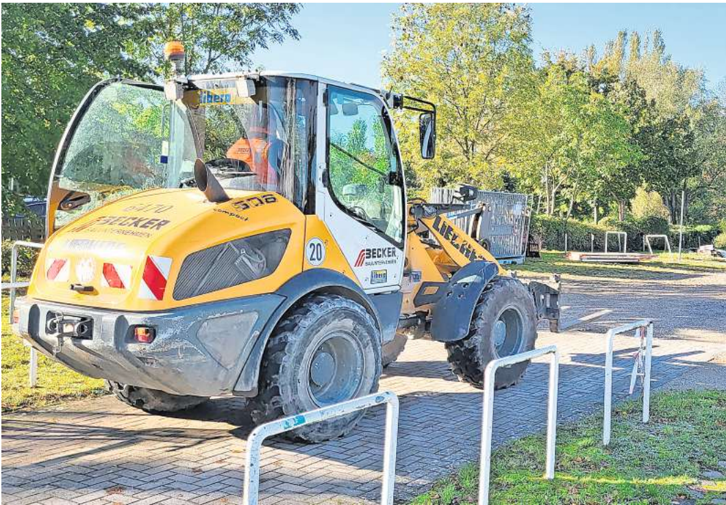
Die Vorbereitungen für den Bau der neuen Stadtgrabenbrücke haben am Montag begonnen.

Fünf Millionen Euro soll das Projekt kosten. Die Planungen sind schon viele Jahre alt. Schon in den 1990er-Jahren wurde ein Flurstück an der Willy-Brandt-Allee für die Anbindung der Brücke reserviert. Die Trasse wurde bereits im Jahr 2014 festgelegt. Ende Januar 2019 beauftragte die