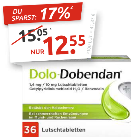
Dolo-Dobendan® 36 Lutschtabletten