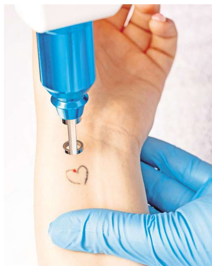
Mit einer Laserbehandlung lassen sich Jugendsünden wieder unsichtbar machen. Gerade bei größeren Tattoos kann das jedoch langwierig sein.

Dank der Betäubung lässt sich die Sitzung meist entspannter überstehen, und auch die Gefahr von unkontrollierten Bewegungen wird verringert. Damit die rezeptfreien Präparate während der Laserbehandlung optimal wirken, sollte man sie mindestens 30 Minuten vorher gleichmäßig und dünn auf die tätowierte Hautstelle auftragen. Im Anschluss an die Laserbehandlung kann vorsichtiges Kühlen die gereizte Haut beruhigen, außerdem sollte die Stelle für einige Tage trocken gehalten und während der gesamten Behandlung vor UV-Licht geschützt werden. Wer dran bleibt, kann sich am Ende über ein wieder weitgehend natürliches Hautbild freuen – und die Tattoo-Reue bald vergessen. djd