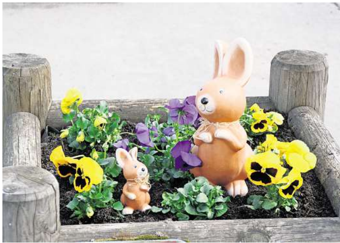
Zu Ostern werden die Blumenkübel in der Dornbreite auch mit Hasen geschmückt.