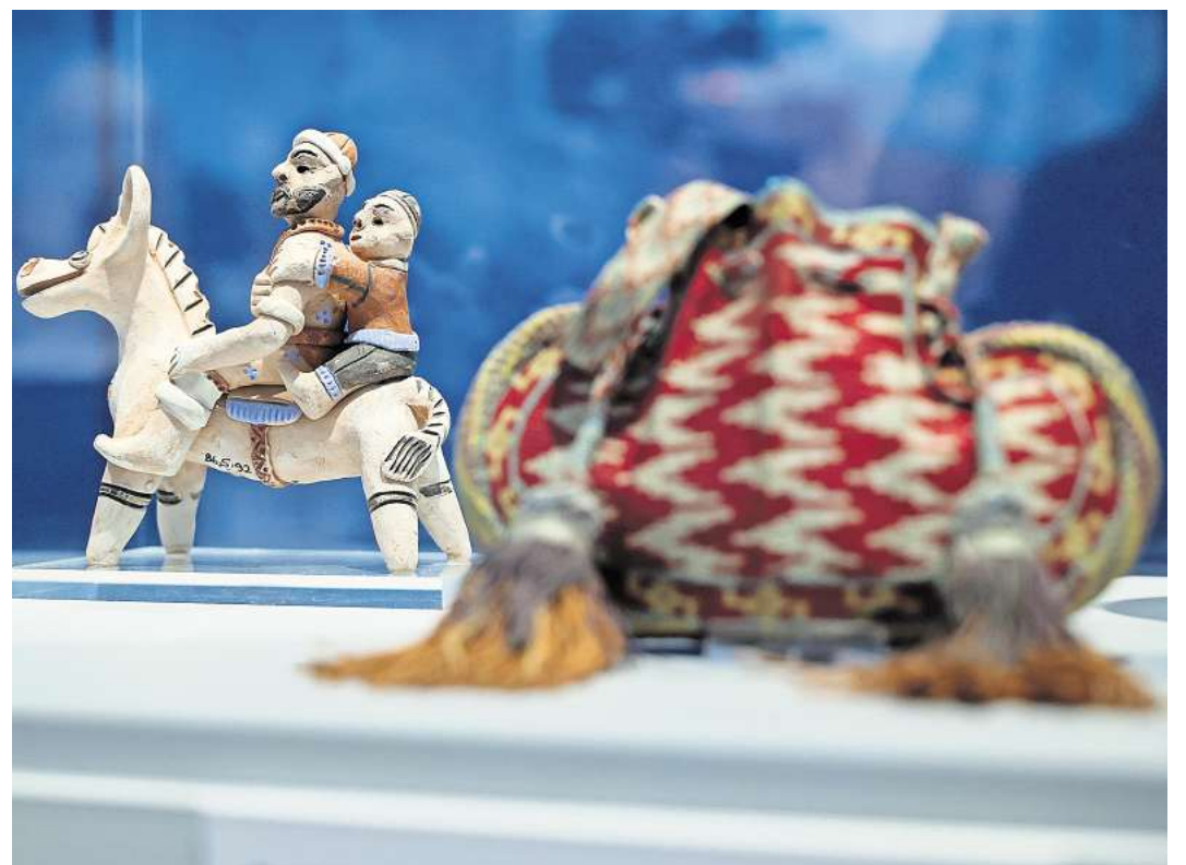
„Entlang der Seidenstraße“: Die Lübecker Sammlung Kulturen der Welt nimmt eine der bekanntesten Handels- und Reiserouten seit der Antike in den Blick. Am heutigen Ostersonntag findet dazu ein Zeichenkurs im St.-Annen-Museum statt.