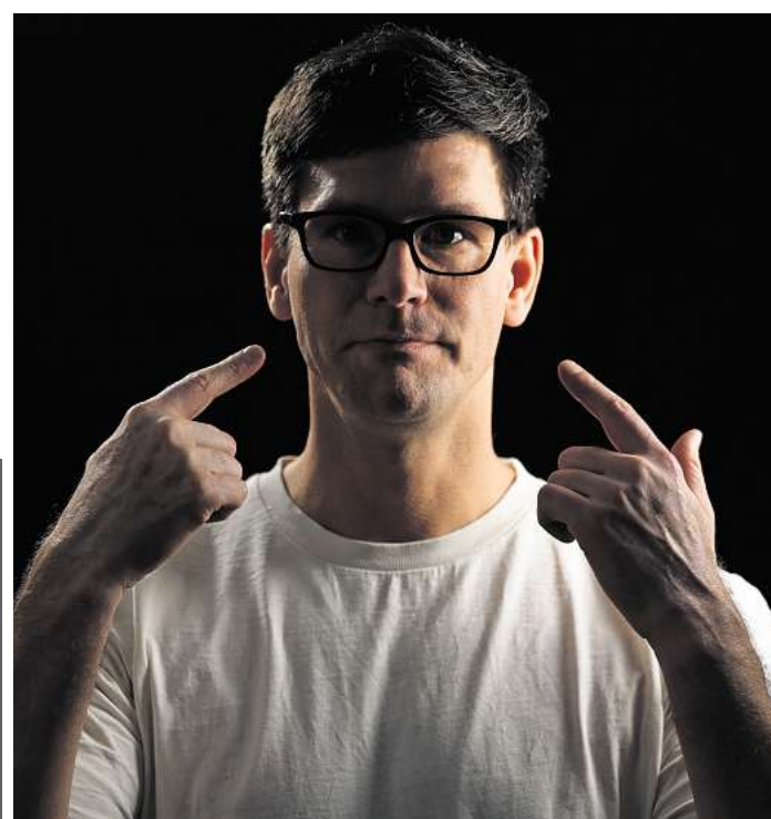
Neelix & Friends werden am 18. April die MuK rocken.

Wir verlosen 3x2 Tickets für die Party am Sonnabend, 18. April. Karten gewinnen kann, wer uns am 4. oder 5. April unter Telefon 0137/8003614 anruft. (Telemedia interactive GmbH; Kosten pro Anruf 0,50 Euro aus dem deutschen Festnetz und aus dem Mobilfunknetz).