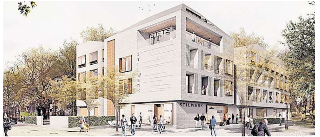
So sollte das Stilwerk-Hotel aussehen: Der Gestaltungsbeirat hatte die Architektur der Nobelherberge abgesegnet. Visualisierung: Stephen Williams, Associates GmbH und Spine Architects GmbH

Doch zum Hotel-Neubau sollte es nie kommen. Während 2020 und 2021 zunächst noch die Corona-Pandemie als Begründung für Verzögerungen herhalten musste, rollten auch danach keine Bagger. Im März 2022 eskalierte der Konflikt schließlich auf politischer Ebene. Die Stadtverwaltung zweifelte in einem Geheimpapier offen an der finanziellen Leistungsfähigkeit des Bauherrn und drängte darauf, das Grundstück zurückzufor-