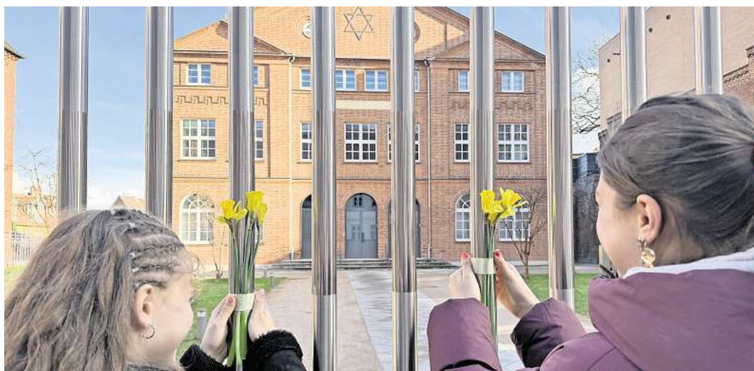
Konfirmandinnen bringen Narzissen am Zaun der Lübecker Synagoge als Zeichen des Gedenkens an.

Genau deshalb organisierte das Bündnis gegen Antisemitismus Lübeck die Gedenkveranstaltung „Für jüdisches Leben – mitten in Lübeck und überall!“ direkt vor der Carlebach-Synagoge. Lübeckerinnen und Lübecker kamen zusammen, um Blumen am Zaun zu befestigen, innezuhalten, zu gedenken und miteinander ins Gespräch zu kommen. Hintergrund der Veranstaltung ist der Brandanschlag auf die Lübecker Synagoge durch vier junge rechtsextreme Männer