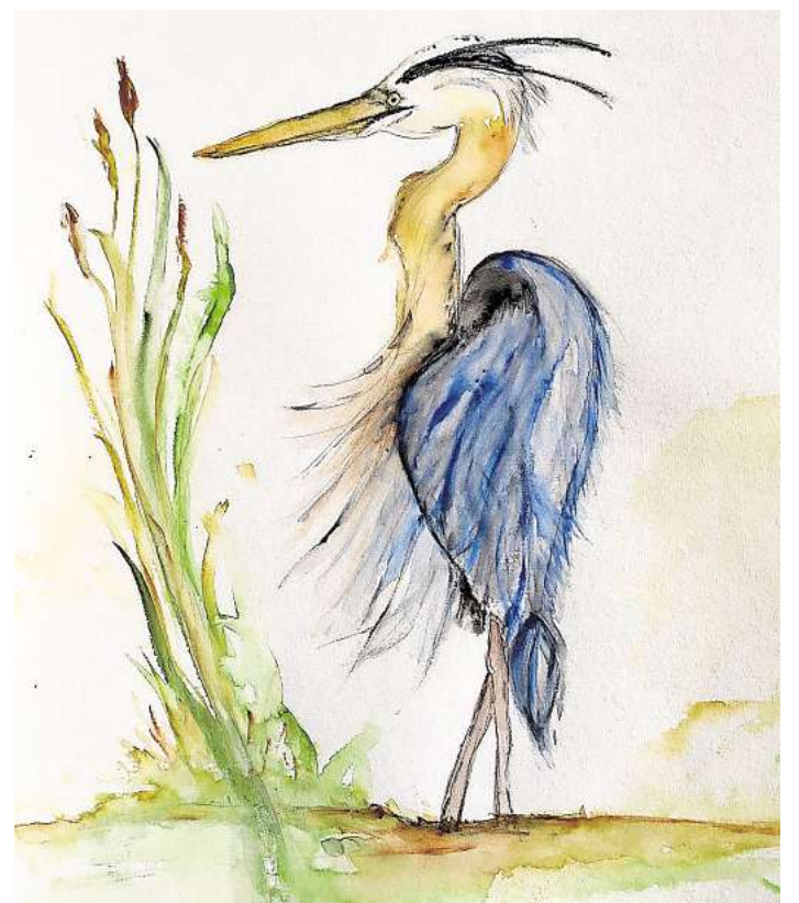
Birgit Schwabe schafft ausdrucksstarke Werke in Aquarell- und Acryltechnik.

Die Ausstellung ist sonnabends bis montags, inklusive der Osterfeiertage, von 11 bis 17 Uhr sowie dienstags bis freitags von 14 bis 17 Uhr geöffnet.