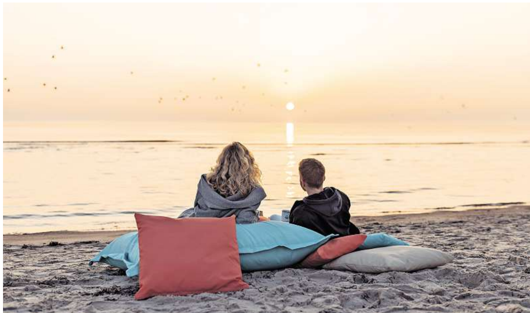
Den Sonnenaufgang gemeinsam bei einer Tasse Kaffee am Strand genießen: Das ist im April und Mai beim „Ersten Kaffee des Tages“ entlang der Lübecker Bucht möglich.

Was 2022 als Geheimtipp begann, hat sich längst zu einer Lieblingsveranstaltung mit Glücksmomentfaktor entwickelt. Jahr für Jahr lockt der „Coffee with a view“ die in der Lübecker Bucht lebenden oder urlaubenden Frühhaufsteher an den Strand und sorgt für leuchtende Augen, stille Begeisterung und dieses ganz besondere Gefühl, den Tag genau richtig zu beginnen. Rund um die Osterfeiertage startet dieses Naturerlebnis mit drei stimmungsvollen Terminen in Pelzerhaken, Rettin und Sierksdorf, später im Mai komplettieren Scharbeutz und Haffkrug die Kaffeereise durch die Lübecker Bucht. Wer seinen ersten Kaffee des Tages schon einmal an einem der Strände genossen hat, der weiß: Diese Termine sollte man sich unbedingt im Kalender markieren. Und wer noch nie dabei war, hat jetzt die Gelegenheit, dieses besondere Erlebnis kennenzulernen.