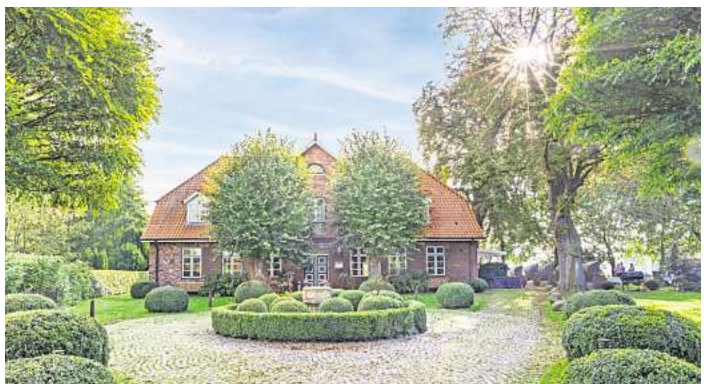
Idyllisch gelegen ist das Romantik Hotel Friederikenhof

Wer die Feiertage lieber klassisch mit einem Restaurantbesuch verbringt, kann am Ostermontag ab 18 Uhr aus der regulären À-la-carte-Karte wählen. Damit bietet der Friederikenhof mehrere Möglichkeiten, die Osterfeiertage kulinarisch zu genießen – in entspannter Atmosphäre zwischen Gutshaus, Garten und norddeutscher Landschaft.