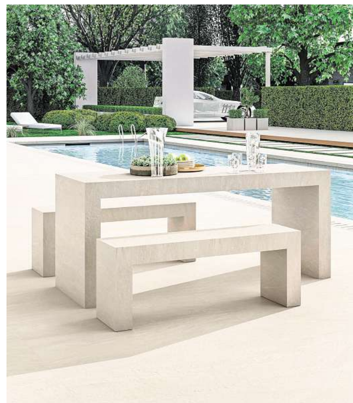
So sieht zeitgemäße Outdoor-Keramik aus: Natürlichen Stein- und Betonoberflächen ermöglichen eine harmonische Einbindung in unterschiedliche Architekturstile.

Wie vielseitig sich das Material einsetzen lässt, zeigt auch eine moderne Poolzone: Neben dem Becken und den klar strukturierten Terrassenflächen wurde sogar ein kubischer Tisch mit pas-