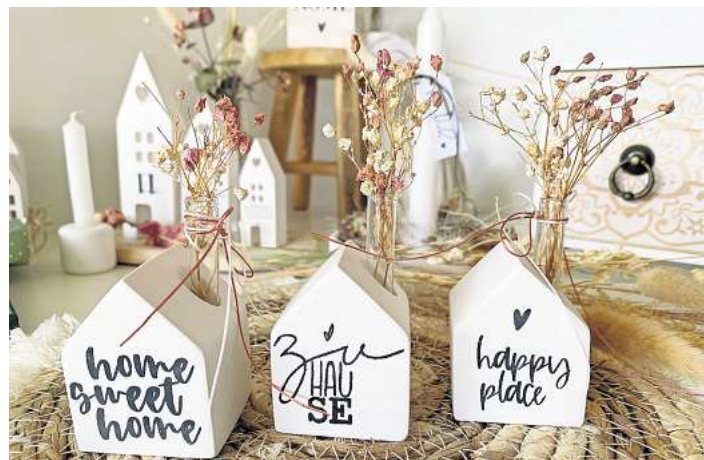
Frühlingsfrische Hingucker gibt es heute und morgen in der Kleinen Waldschänke in Klingberg bei der „Kreativen Symphonie“ zu entdecken.

KLINGBERG. Kurz vor Ostern wird es in der Kleinen Waldschänke im Scharbeutzer Ortsteil Klingberg, Seestraße 56/Ecke Uhlenflucht, kreativ: Für den heutigen Sonnabend und morgigen Sonntag, 21. und 22. März, laden Bastelkatz und Minimoj von 11 bis 17 Uhr zur Ausstellung „Kreative Symphonie“ voller handgemachter Ideen ein.