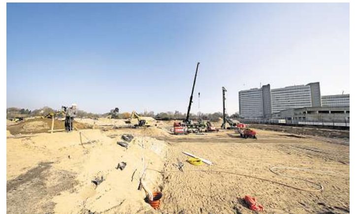
In den Boden werden sogenannte CMC-Säulen (Controlled Modulus Columns) gesetzt. Das sind Betonsäulen, die die Tragfähigkeit verbessern sollen.