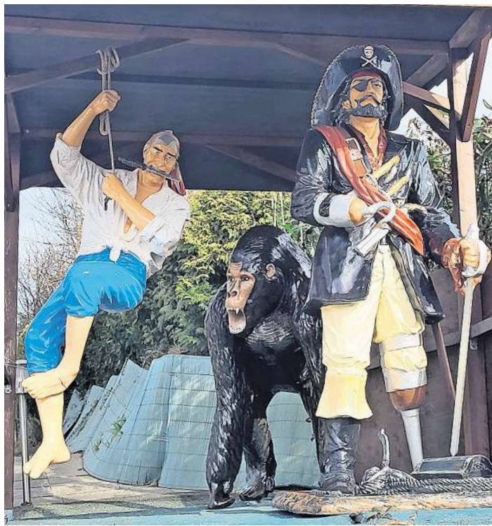
Große Auswahl: Die Dekorationsobjekte eignen sich für den Innen- und Außenbereich.