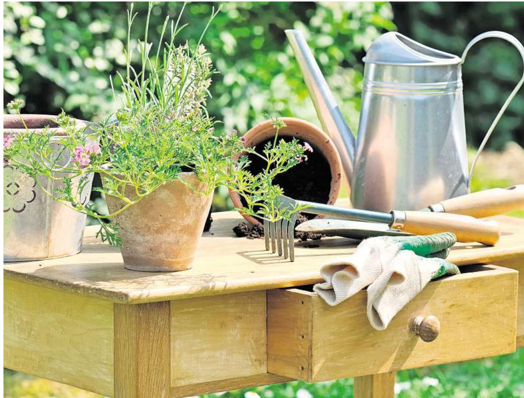
Mit den richtigen Utensilien wird die Gartenarbeit zu einem großen Vergnügen.