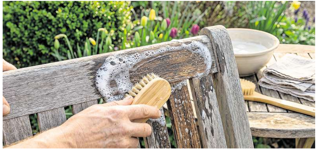
Holz Möbel werden gesäubert und bei Bedarf leicht abgeschliffen oder geölt.

D er letzte Schnee ist geschmolzen, die Vögel zwitschern und die Sonne zeigt sich auch wieder länger. Höchste Zeit also, Balkon und Terrasse aus dem Winterschlaf zu holen und ihnen ein kleines Frühlings-Update zu gönnen. Diese fünf Tipps bringen Balkon und Terrasse wieder in Frühlingsform.