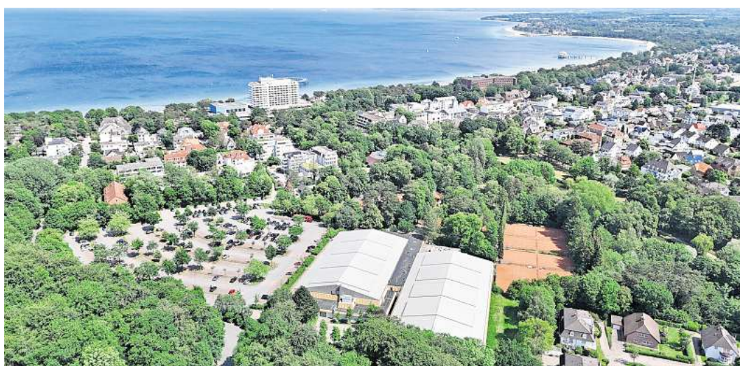
Blick auf das ETC mit Tennisplätzen, Parkplatz P1 und angrenzendem Kurpark: Die Gemeinde Timmendorfer Strand sucht einen Investor für sechs Hektar im Zentrum.

Die Gemeinde sucht dabei einen Investor nicht nur für das ETC mit Halle und Tennisplätzen allein, sondern auch für „angrenzende Flächen“, sprich: für das sechs Hektar große Gelände mit dem Parkplatz P1 und Teilen des Kurparks inklusive des seit 22 Jahren leerstehenden Kurmittelhauses,