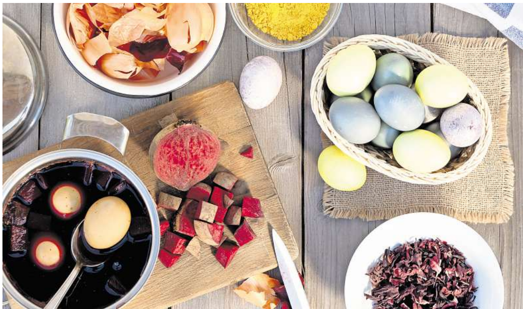
Schön und gesund: Ostereier selbst gefärbt mit Naturfarben.

B unte Eier gehören zu Ostern wie der Schokolade. Viele greifen dafür zu Fertigfarben aus dem Supermarkt. Doch in vielen industriellen Eierfarben stecken synthetische Farbstoffe, die über feine Poren und Risse in der Schale bis ins Eiweiß gelangen können.