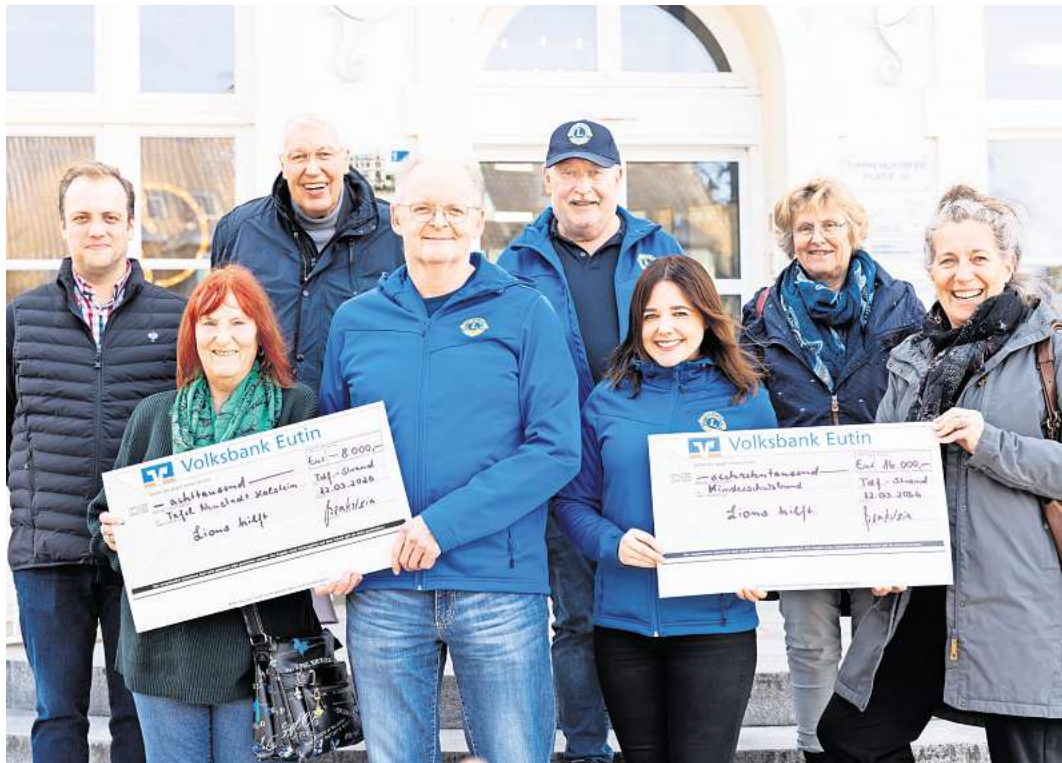
Zusammen für den guten Zweck: Spender und Empfänger präsentieren die Erlöse der Adventskalender-Aktion des Lions Clubs Lübecker Bucht.

Auch die Tafel Neustadt/Timmendorfer Strand ist auf Unterstützung angewiesen: Monatlich versorgt sie rund 5500 Menschen mit Lebensmitteln. Die ehrenamtlichen Helferinnen