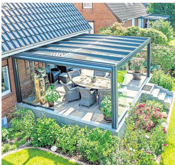
Der Würfel-Wintergarten aus Eutin wurde mit dem German Design Award ausgezeichnet.

Nelson Park Terrassendächer aus Eutin ist seit über 20 Jahren Marktführer in Norddeutschland und steht für maßgeschneiderte Lösungen aus langlebigem Aluminium und hochwertigem Glas. Ob klassische Terrassendächer, moderne Kaltwintergärten oder innovative Solar-Terrassendächer – Nelson Park verbindet Funktionalität mit anspruchsvollem Design. Auch außergewöhnliche Projekte wie Laubengänge, Dachkonstruktionen mit Tiefenversatz oder elegante Übergänge zwischen Wintergarten und Terrasse realisiert das Unternehmen mit höchster Präzision. Alle Produkte werden in eigener Produktion gefertigt – vom Aluminium- und Glaszuschnitt bis zu maßgeschneiderten Markisen. Das ermöglicht maximale Flexibilität und die Umsetzung individueller Kundenwünsche, auch bei Sonderanfertigungen.