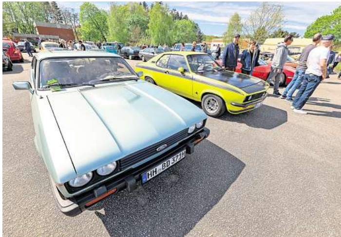
Das Oldtimer-Treffen in Lübeck-Blankensee ist ein beliebter Saisonauftakt. Termin für 2026: Sonntag, 10. Mai.

In Preetz treffen sich am Sonntag, 2. August, die Oldtimer und ihre Bewunderer. Der Oldtimer-Termin für Bad Segeberg ist Sonntag, 23. August. Am Sonntag, 6. September, steht das Treffen in Sülfeld im Kalender. Zum Saisonende finden sich die Oldtimer am Sonnabend, 3. Oktober, noch einmal in Ratzeburg ein. SAJ