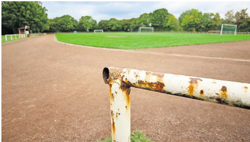
Die Sportanlage Neuhof soll ausgebaut werden. Die Stadt will sich um Fördermillionen beim Bund bewerben.

Die restlichen 25 Prozent sind der Eigenanteil. Dieser kann jedoch durch Landesmittel oder durch Spenden auf zehn Prozent reduziert werden. Im günstigsten Fall blieben für die Hansestadt somit noch Kosten in Höhe von 600.000 Euro übrig. Nun sollen schnellstmöglich Gespräche mit