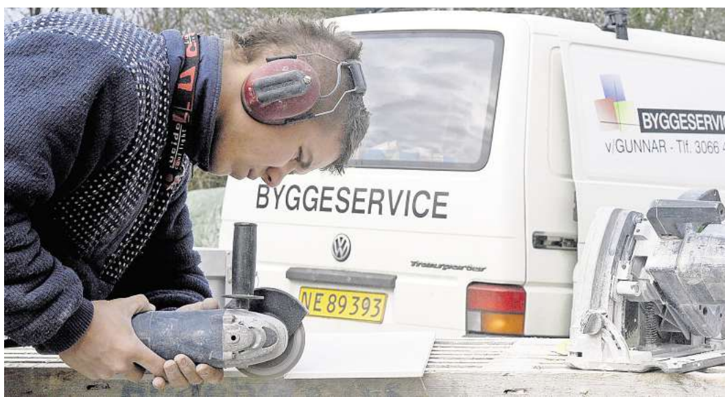
Handwerker werden auch im Nachbarland dringend gesucht. Weniger Kündigungsschutz macht diese Branche allerdings vergleichsweise unsicher.

Interessenten für Dänemark lasse er mit dem Portal bewusst „relativ allein“ – weil das eine erste Hürde sei. „Dänemark ist sehr digitalisiert. Wer sich in der digitalen Welt nicht zurechtfindet, der sollte überlegen, ob er oder sie in diesem Land richtig ist.“ Die Organisation des dänischen All-