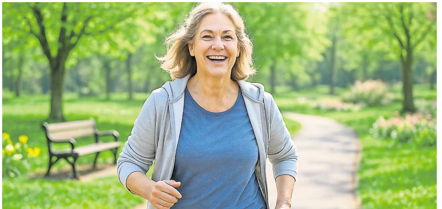
Frühzeitige Prävention und gezieltes Handeln helfen, Mobilität und Lebensqualität möglichst lange zu bewahren.

Eine Knochendichtemessung kann das individuelle Risiko be-