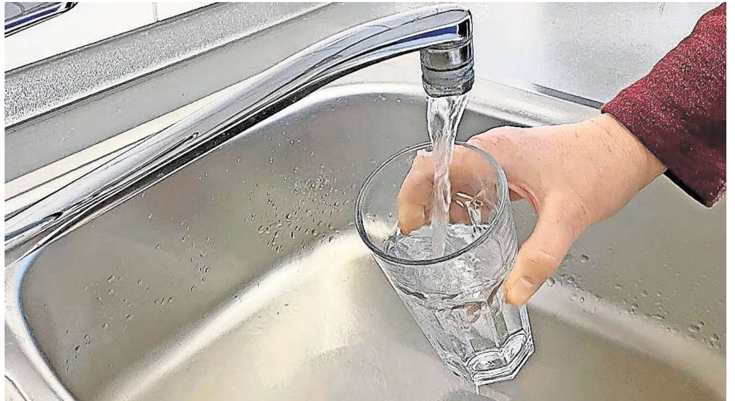
Trinkwasser aus dem Hahn: Die Leitungen und Rohre in Ostholstein sind mit mitunter schon ziemlich alt.

Die Aufnahme über das Trinkwasser gilt jedoch als unbedenk-