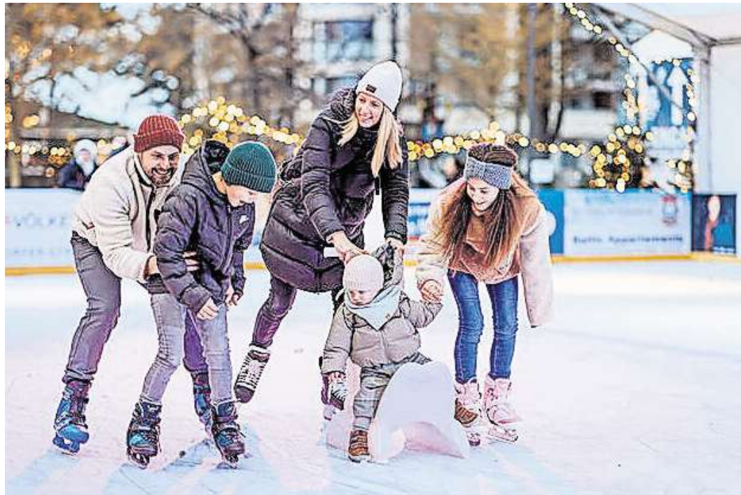
Die EISWELT ist ein Vergnügen für die ganze Familie.

Um 15 Uhr folgt die offizielle Eröffnungszeremonie mit kurzen Ansprachen und einer stimmungsvollen Eiskunstlauf-Show. Anschließend dürfen Kinder gemeinsam mit den Läuferinnen ein paar Runden auf dem Eis drehen. Gegen 15.30 Uhr heißt es