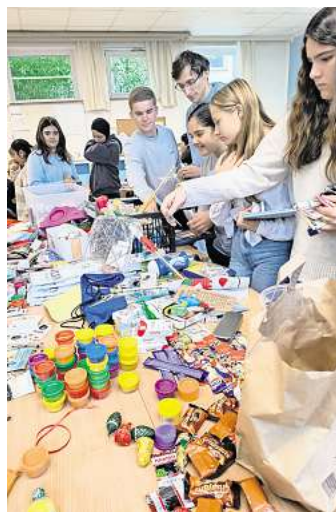
Schülerinnen und Schüler der Cesar Klein Schule bastelten für Kinder im Frauenhaus Lübeck. hfr

Das Frauenhaus Lübeck bietet Schutz und Beratung für Frauen und Kinder, die von häuslicher Gewalt betroffen sind. Dort erhalten sie Hilfe, Sicherheit und Unterstützung bei der Bewältigung