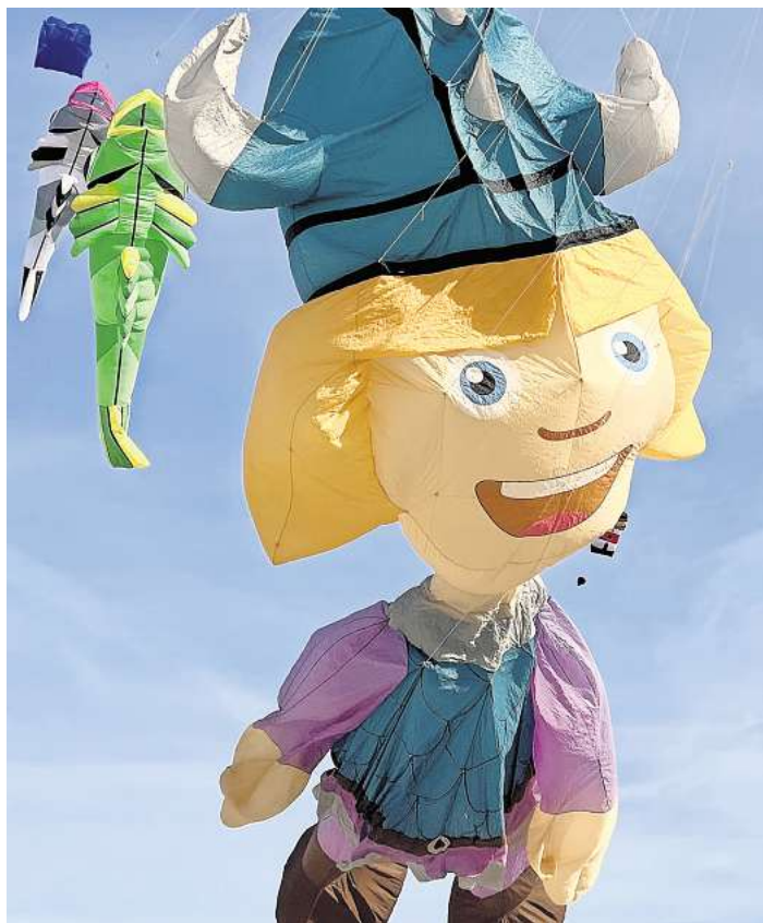
Am langen Wochenende wird in Scharbeutz das Drachenfest gefeiert. Außerdem ist ein verkaufsoffener Sonntag angekündigt.

SCHARBEUTZ. In der Lübecker Bucht wartet am langen Wochenende rund um den Reformationstag ein besonderes Erlebnis auf alle Besucher: Vom 31. Oktober bis 2. November wird der Himmel über der Ostsee zum farbenfrohen Kunstwerk, wenn auf dem Seebückenvorplatz (Höhe Strandallee 134) und am Strand das Drachenfest Scharbeutz inklusive verkaufsoffenem Sonntag stattfindet. Der Eintritt zur Veranstaltung ist kostenfrei.