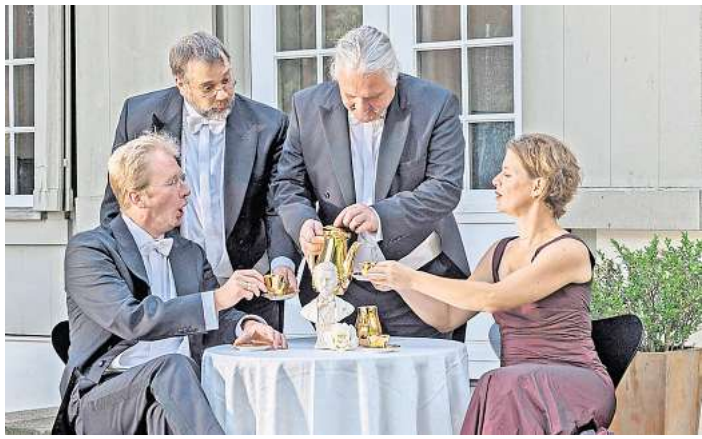
Wagners Salonquartett gibt im Kursaal Malente ein Geburtstagskonzert zu Ehren von Johann Strauß.