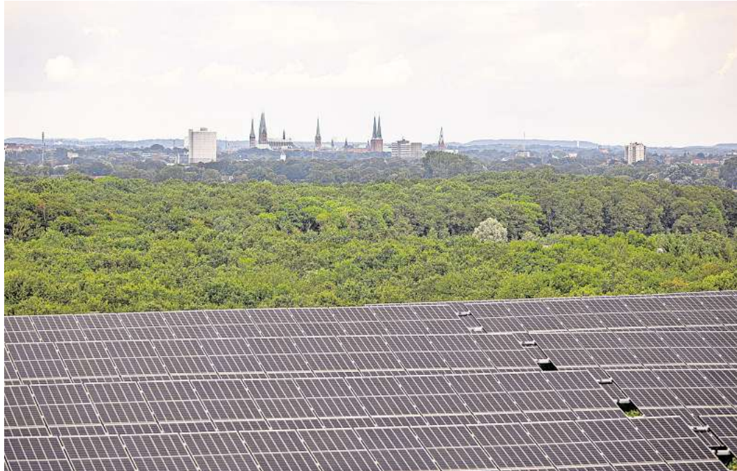
Große Freiflächen-PV-Anlagen – wie hier auf der Deponie Niemark – sind in Lübeck geplant.

Enerparc hat etliche Flächen bereits gepachtet. Neben den Modulen sollen technische Anlagen auf den Flächen errichtet werden. Ein Zaun soll den Anlagenbereich sichern. Details über