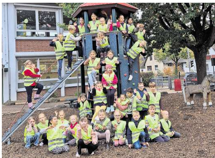
In Ratekau wurden Warnwesten an die Erstklässler verteilt. Eltern mögen darauf achten, dass die Kinder die Westen tragen.

Wenn die Tage kürzer werden, erstrahlt der Kurpark Timmendorfer Strand in ganz besonderem Glanz: Vom 24. bis 26. Oktober, jeweils von 12 bis 22 Uhr, lädt das Lichterfest zu einem Spaziergang durch ein funkelndes Lichtermeer ein. In diesem Jahr haben die Lichtkünstler ihrer Kreativität freien Lauf gelassen und zahlreiche Alltagsgegenstände kunstvoll beleuchtet. Einige Installationen sind interaktiv gestaltet und laden Besucher zum Mitmachen ein. Rund um den Brunnen im Kurpark sorgen Caterer für das leibliche Wohl.