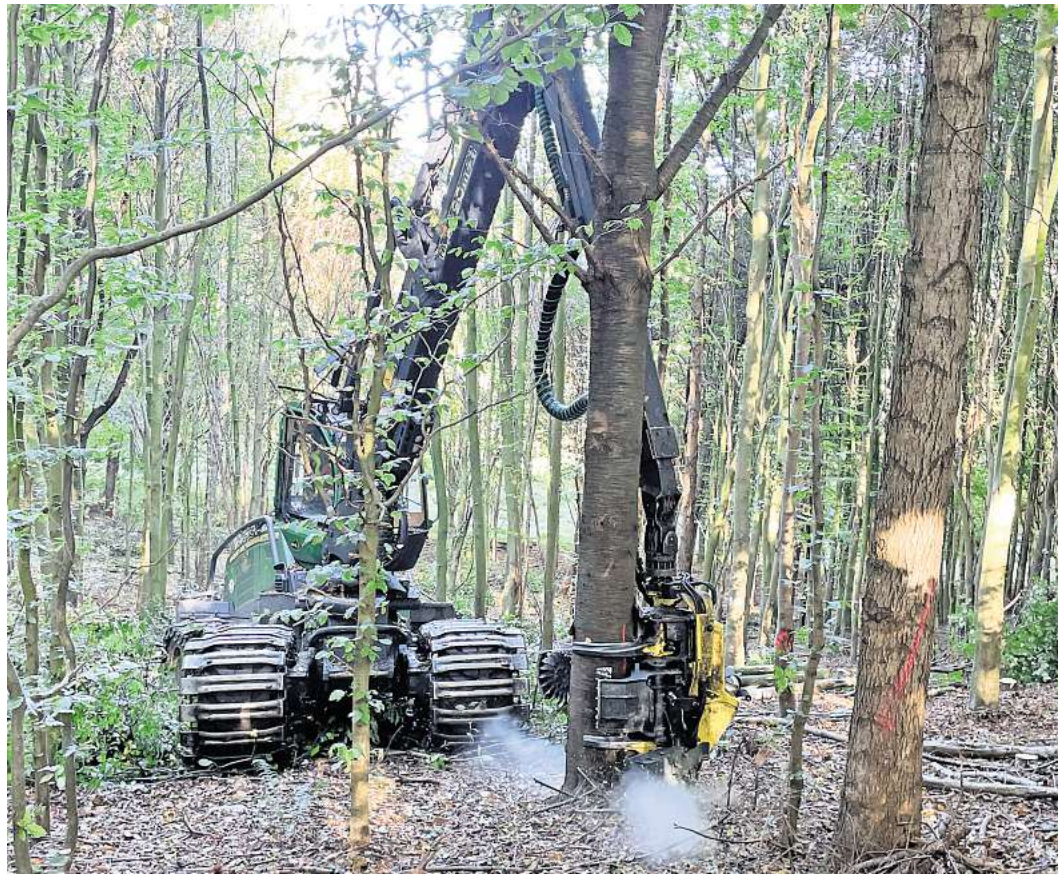
Sägespäne fliegen, einen Augenblick später liegt der Baum in der Horizontalen, wird entastet und in Teile zersägt.

Er ist bei einem Lohnunternehmen in Boostedt (Kreis Segeberg) beschäftigt, das für die Schleswig-Holsteinischen Landesforsten arbeitet. „Wir haben zwei große und einen kleinen Harvester“, berichtet er auf Anfrage. Unterwegs sei er gerade mit dem kleinsten. „Ich nenne ihn deshalb Rosenschere“, sagt Bajus.