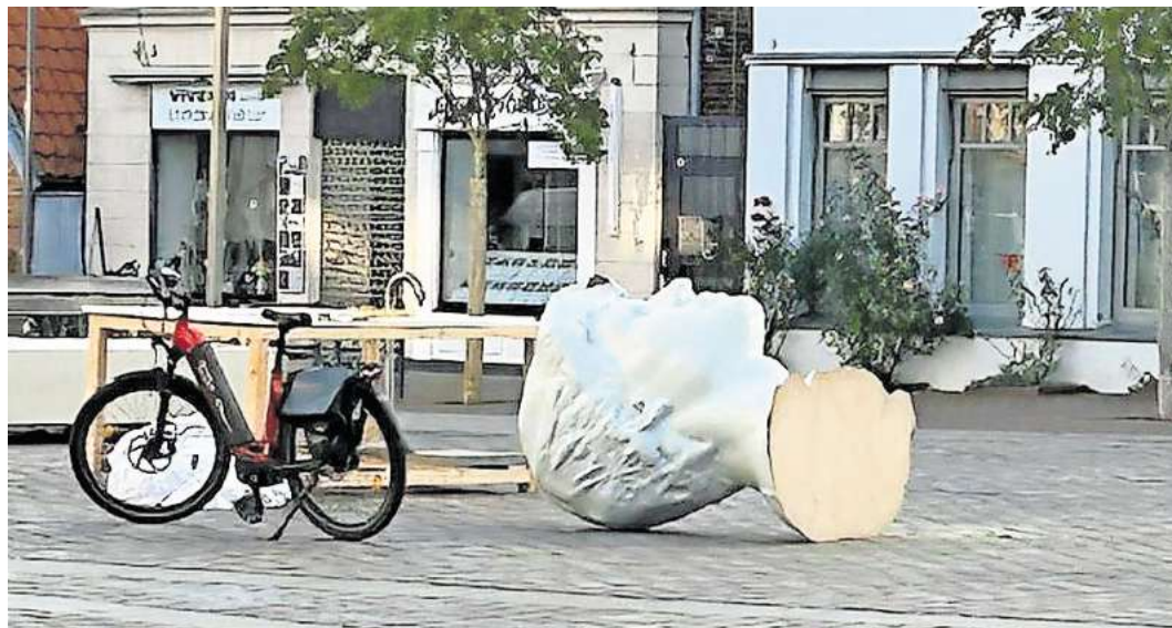
Am Freitagmorgen lag der Kopf von Wincent Weiss umgestoßen auf dem Pflaster des Eutiner Marktplatzes.