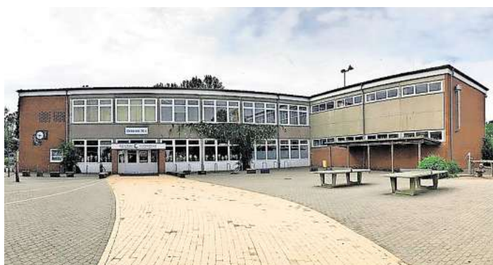
Die Grund- und Gemeinschaftsschule Timmendorfer Strand soll durch einen Neubau ersetzt werden.

Wie soll die neue Grund- und Gemeinschaftsschule von Timmendorfer Strand aussehen? Über diese Frage diskutieren Kommunalpolitiker und Bürger seit Jahren. Die Gebäude des Komplexes an der Poststraße gelten als marode, eine Sanierung würde sich nicht mehr lohnen. Deshalb hat die Gemeinde einen Wettbewerb für einen Neubau ausgelobt und stellt jetzt die Ergebnisse vor.