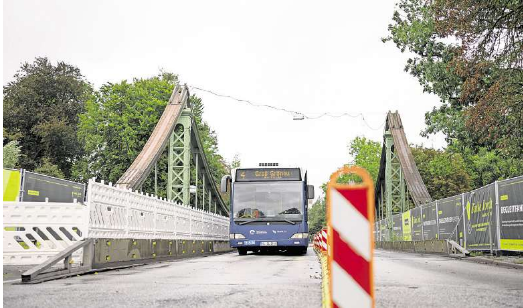
Noch fahren Busse auf der Mühlentorbrücke. Ab 15. Dezember ist es damit vorbei.

Grund dafür ist die Baufähigkeit der Mühlentorbrücke. Schwere Fahrzeuge über 3,5 Tonnen dürfen dann nicht mehr über das Bauwerk fahren. Davon betroffen ist auch der Busverkehr, der von der Kronsfordter und Ratzeburger Allee aus nicht mehr direkt in die Stadt fahren kann.