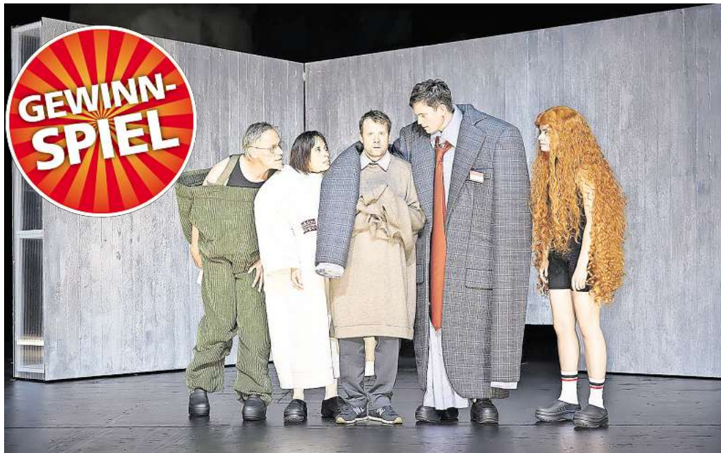
Eine Szene aus „Das beispielhafte Leben des Samuel W.“.

GLESCENDORF. Die Freiwillige Feuerwehr lädt am Samstag, 4. Oktober, zum traditionellen Laternenumzug ein. Ab 18.30 Uhr treffen sich Groß und Klein am Feuerwehrgerätehaus, Bornberg 2. Der Start erfolgt um 19 Uhr, begleitet vom Fanfarenzug des TSV Pansdorf, der mit schwungvollen Klängen für Stimmung sorgt. Nach dem Umzug lädt die Feuerwehr zu einem gemütlichen Ausklang am Gerätehaus ein. Dort gibt es Getränke und Grillimbiss, für alle Kinder ist die Verpflegung kostenfrei. Der Umzug bietet eine stimmungsvolle Gelegenheit, die Nachbarschaft im Lichterglanz zu erleben und die Arbeit der Freiwilligen Feuerwehr zu unterstützen.