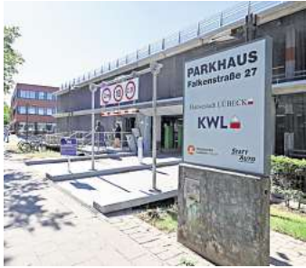
Das Parkhaus Falkenstraße ist seit dem 25. September wieder für alle geöffnet: für Kurzzeitparker und Dauermieter.

LÜBECK. Nach sechs Monaten Teileröffnung heißt es nun endlich: Freie Fahrt für alle – oder genauer gesagt: Parken für alle! Das Parkhaus Falkenstraße ist nach einer umfassenden Sanierung wieder komplett nutzbar – nicht nur für Dauermieter, sondern auch für Kurzzeitparkende.