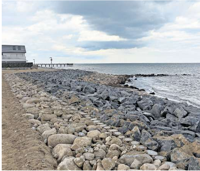
So sieht das mit Tonnen von Steinen fertiggestellte Deckwerk am Regionaldeich Süssau aus.

Das Deckwerk wird auf einer Länge von rund 1,2 Kilometern im strandnahen Bereich mit Bestandsmaterial, sprich 344 Tonnen Natursteinen vervollständigt sowie mit 12.000 Tonnen norwegischen Wasserbausteinen auf einer Vlies- und circa 1600 Kubikmeter großen Schotterdeckschicht wiederhergestellt. Der Abschnitt