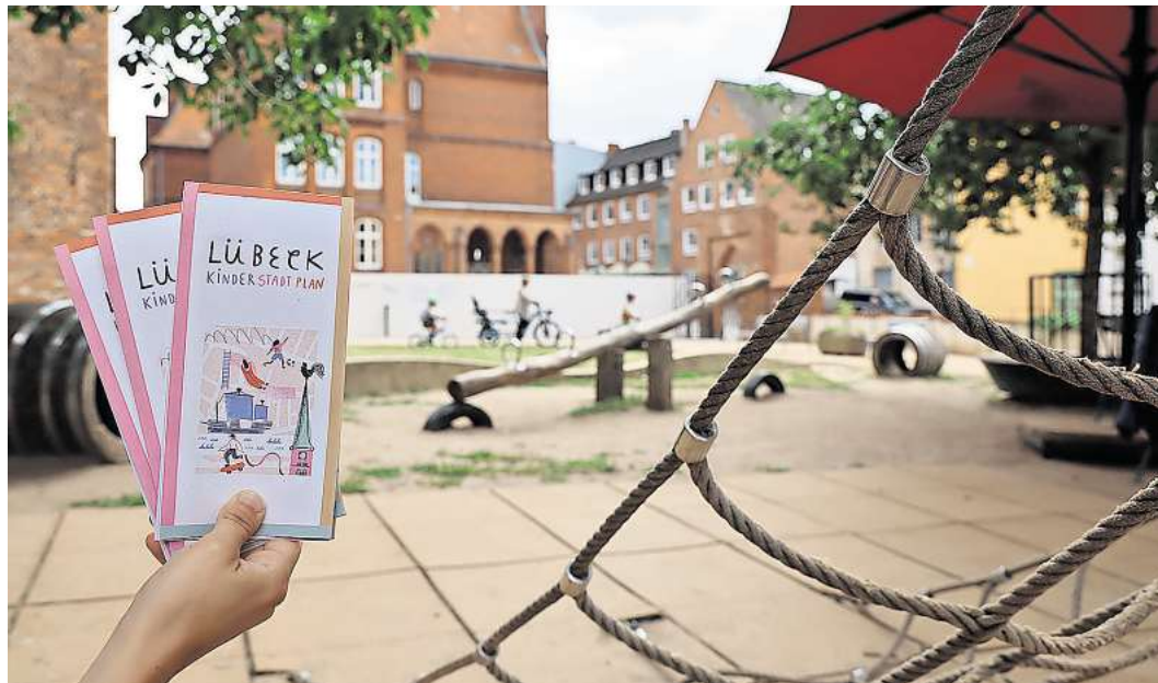
Die erste Auflage des Stadtplans für Kinder umfasst 6000 Exemplare.

Die erste Auflage umfasst 6000 Exemplare, die kostenfrei in den Tourist-Informationen, in der Stadtbibliothek sowie in den Museen erhältlich sind. Zum Schulstart nach den Sommerferien wurde der Kinderstadtplan