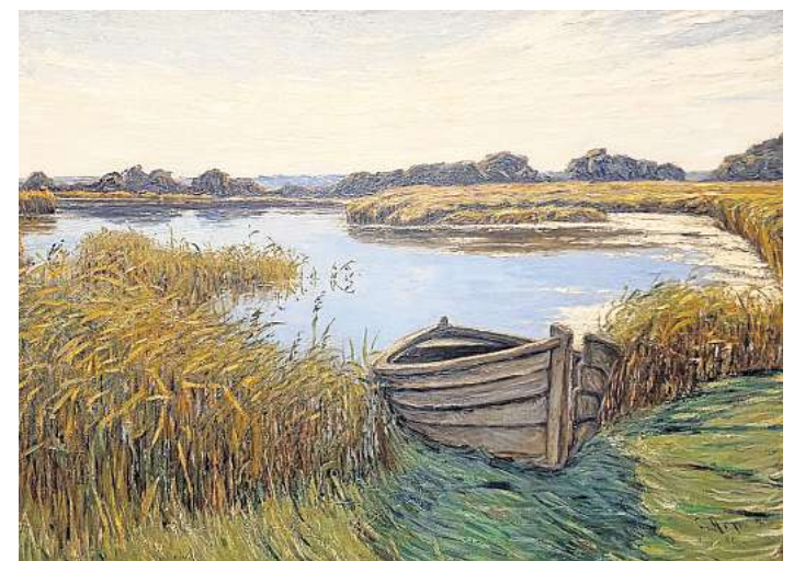
Carl Arps Ölgemälde „Am Passader See“ von 1910, ist teil der neuen Ausstellung im Ostholstein-Museum.

Ergänzt wird die Präsentation durch Werke des ostholsteinischen Malers Hinrich Wrage aus dem Bestand des Ostholstein-Museums. Wrage zählt zu den