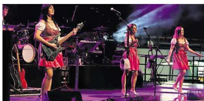
Frauenpower auf der Gaudi-Festwoche: Die Band „Dirndlalarm“.

Tickets (Flanierertickets ab 14 Euro) online unter Luebecker-Gaudi-Festwochen.de Restkarten an der Abendkasse – 15 Euro Platzreservierungen für Firmen – Anfragen unter info@zelt-koenig.de