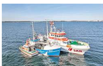
Am Wochenende gibt es eine große Seenotretterübung in der Lübecker Bucht.

NEUSTADT. Wenn Menschen in Not geraten, muss jeder Handgriff sitzen: Vom Donnerstag, 11. September, bis Sonnabend, 13. September, trainieren die Seenotretter der Deutschen Gesellschaft zur Rettung Schiffbrüchiger (DGzRS) bei der SAREX Neustadt 2025 verschiedene Einsatzszenarien in der Lübecker Bucht. Schiffbrüchige suchen, Verletzte versorgen, Havaristen schleppen – die Palette möglicher Notfälle auf See ist groß. Insgesamt neun Rettungseinheiten der DGzRS sowie externe Schiffe und Hubschrauber sind an der Großübung beteiligt.