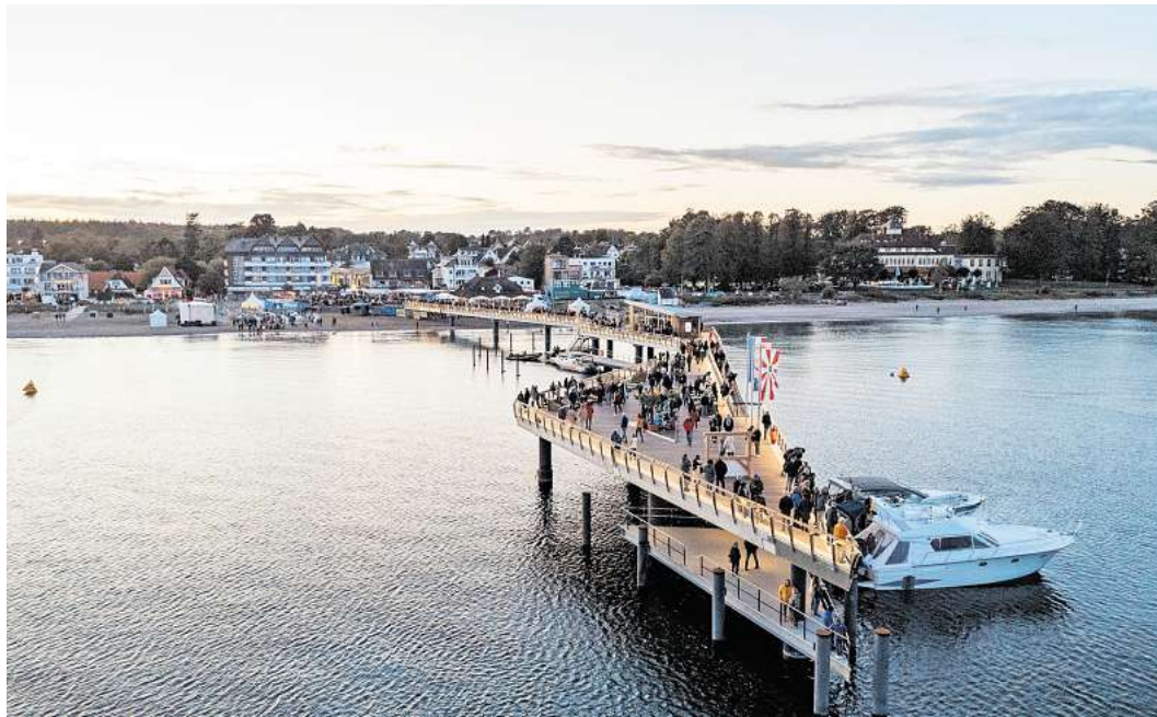
Die Seebrücke in Haffkrug.

NIENDORF. Zum letzten Mal in diesem Sommer lädt die Veranstaltungsreihe „Tanzen am Meer“ am Mittwoch, 17. September, von 19 bis 22 Uhr auf den Niendorfer Balkon ein. Bei freiem Eintritt sorgt DJ René Kleinschmidt mit einem bunten Musik-Mix für ausgelassene Stimmung direkt am Meer. Ob Sommerhits, Schlager, Oldies oder Walzer – getanzt wird unter freiem Himmel, solange das Wetter mitspielt. Für passende Getränke sorgt erneut das Team von „Cocktail Revolution“. Ab Oktober zieht die Reihe in die Trinkhalle um. Dort wird an vier Terminen weitergetanzt: am 10. Oktober, 7. und 21. November sowie am 12. Dezember – jeweils ab 19 Uhr.