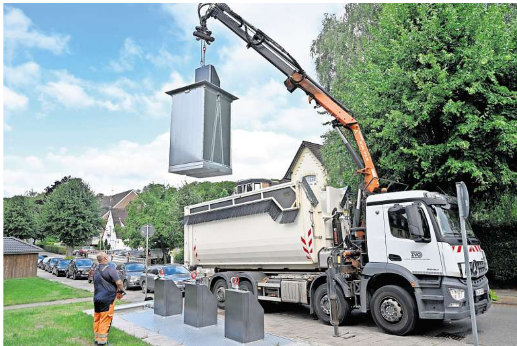
Der ZVO-Mitarbeiter Conny Reinhold zieht mit einem Kran den fünf Kubikmeter großen Müllcontainer aus dem Unterflurbehälter, um dessen Inhalt auf dem Spezialfahrzeug zu entleeren.

In den vergangenen Jahren kam es in Malente immer wieder zu Brandstiftungen an Mülltonnen. In der Lindenallee brannten 2019 und 2022 die Unterstände für die Tonnen. Aufgrund der verschlossenen Klappen und Schütten – zugriffsberechtigte Mieter haben eine Schlüssel – können Unbefugte nun nichts mehr einwerfen. Auch andere Fehlwürfe würden reduziert und Kosten für