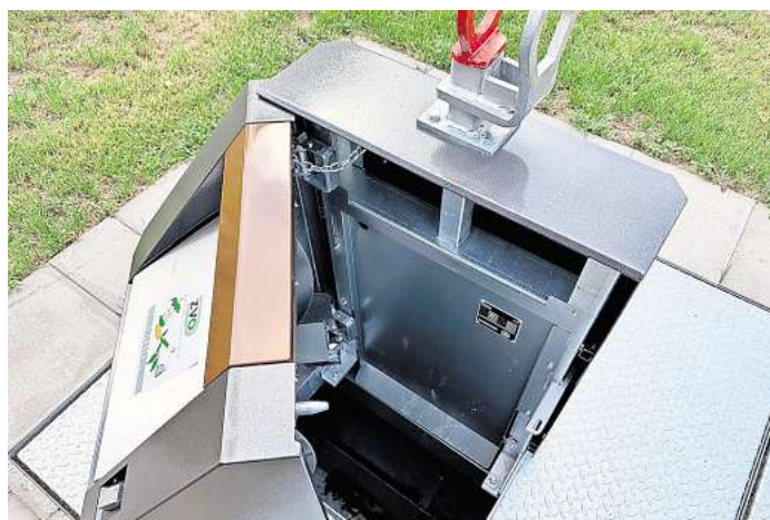
Nach dem Öffnen der Servicetür kann man in den Unterflurbehälter der Müllsammelstelle schauen.

Sonderleerungen gespart. Die Einwurfschächte sind barrierefrei zugänglich.