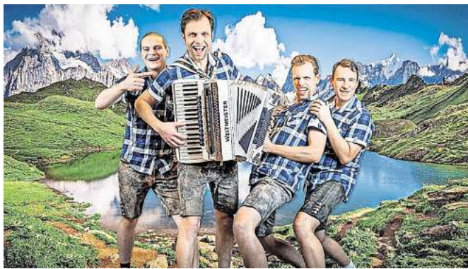
Die „Vollxrocker“ bringen das Festzelt am 2. Oktober zum Beben.

Am 3. Oktober (Piraten-Party) feiert die Lübecker Freibeutermukke gemeinsam mit den Gästen und zehn weiteren Musikgruppen ihr