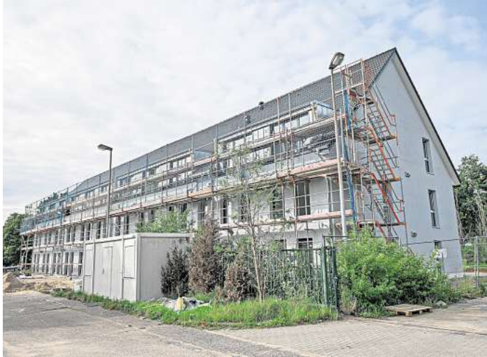
Vor allem Familien sollen laut Stadt in das Gebäude Am Teichberg im Lübecker Norden einziehen.

Die Stadt hat das Gebäude für fünf Jahre gemietet, mit Option auf eine Verlängerung. Die sei aber nicht geplant, erklärt die Sozialsenatorin. Das Deutsche Rote Kreuz (DRK) und die Johanniter betreuen die Unterkunft. Täglich von 7 bis 17 Uhr sei das Büro mit hauptamtlichen Kräften besetzt,