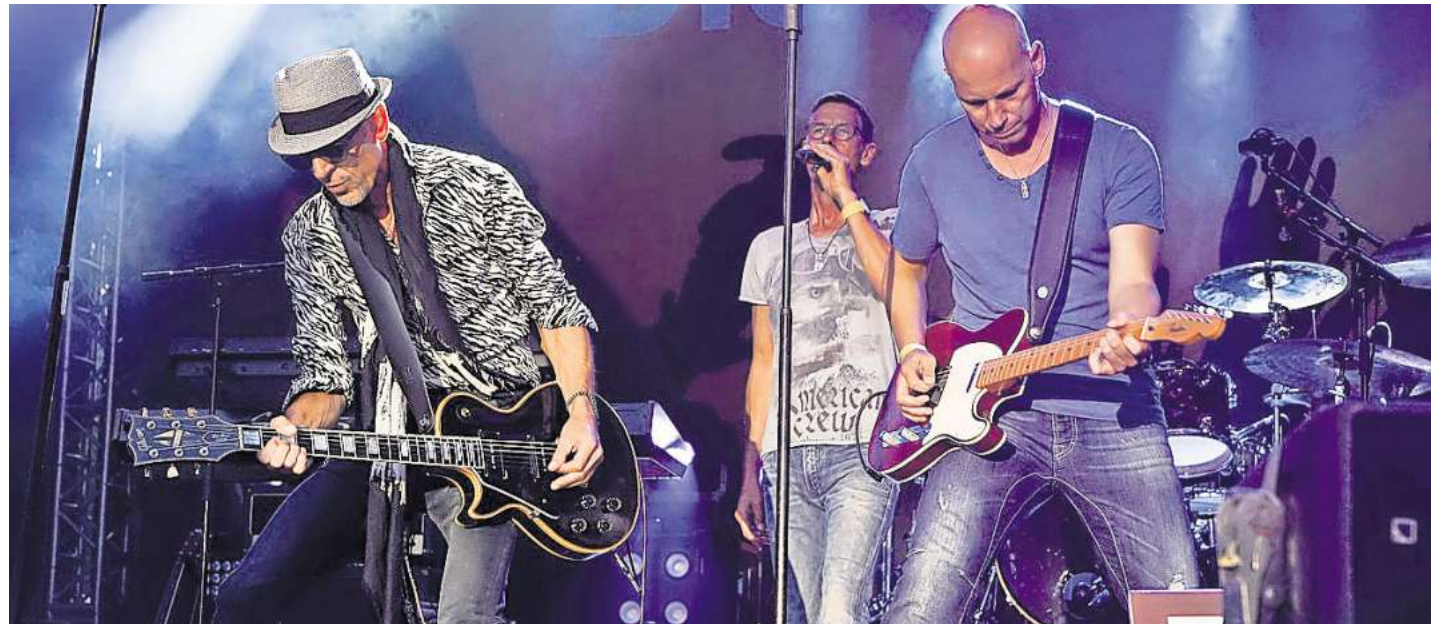
Seit 30 Jahren spielen sie in derselben Besetzung auf Bühnen in Norddeutschland: Am Samstag, 16. August, ist Tin Lizzy beim Stadtfest in Eutin zu Gast.

Die Besucher erwartet ein dreitägiges Programm – Hauptacts am Freitag- und Samstagabend sind Merquy und Tin Lizzy – Noch sind Stände frei