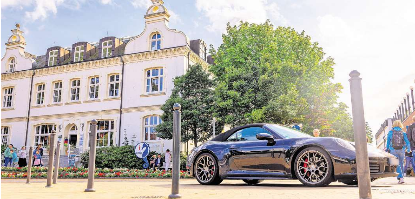
Einen sanften Bogen um den Timmendorfer Platz fahren: Das ist auch bei Sportwagen-Fans beliebt.

Die Idee, den Platz vor dem Alten Rathaus für Autos zu sperren, sorgt für ein geteiltes Echo