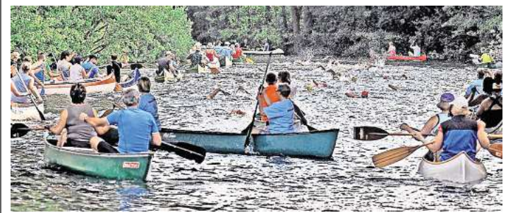
Begleitet von Paddlern geht es für die Langstreckenschwimmer am 31. August wieder die Wakenitz entlang. Doch es werden noch Helfer gesucht.

Weitere Infos sind auf der Webseite des Veranstalters Tri-Sport Lübeck zu finden NV