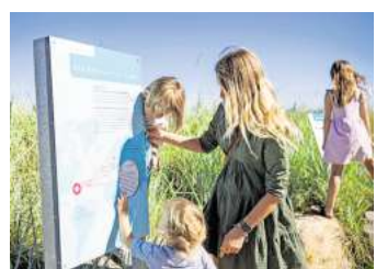
Fischerei-Erlebnis Pfad in Haffkrug.

O.C. Katre Mühlenstraße 19 23552 Lübeck ☎ 0451/98 98 929 www.luebeck-trauringe.de