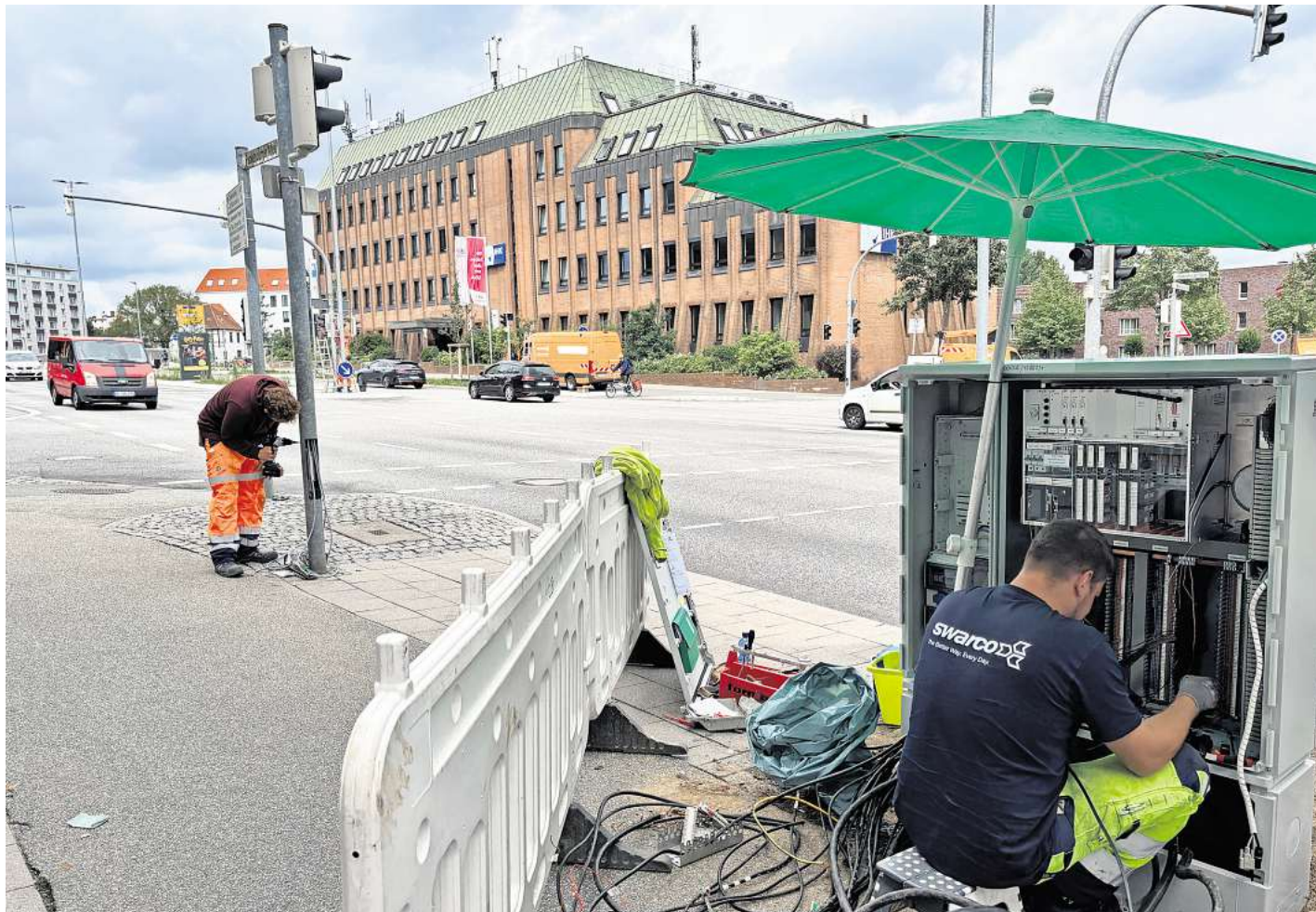
Die Kabel hängen aus einer Ampel an der Kreuzung Fackenburger Allee/Werner-Kock-Straße. Ein Arbeiter verkabelt die Steuerungselemente in einem Sicherungskasten neu: Für einen Tag mussten die Ampeln dort für das Projekt Viaa ausgeschaltet werden.

Die Stadt hat drei Straßenzüge für den Praxistext auserkoren: Fackenburger Allee, Nordtangente und Bei der Lohmühle. Aus Sicht der Stadt sind alle Areale ideal für