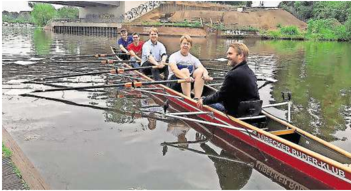
Vierer-Teams plus Steuermann sind bei der Benefizregatta in diesem Jahr auf dem Elbe-Lübeck-Kanal dabei.

Die Regatta am 20. September verspricht wieder ein Erfolg zu werden, die Anmeldungen laufen auf Hochtouren, rund 40 Teams haben sich bereits registriert. Doch noch gibt es freie Startplätze. „Alle, die das Projekt unterstützen möchten, sollten