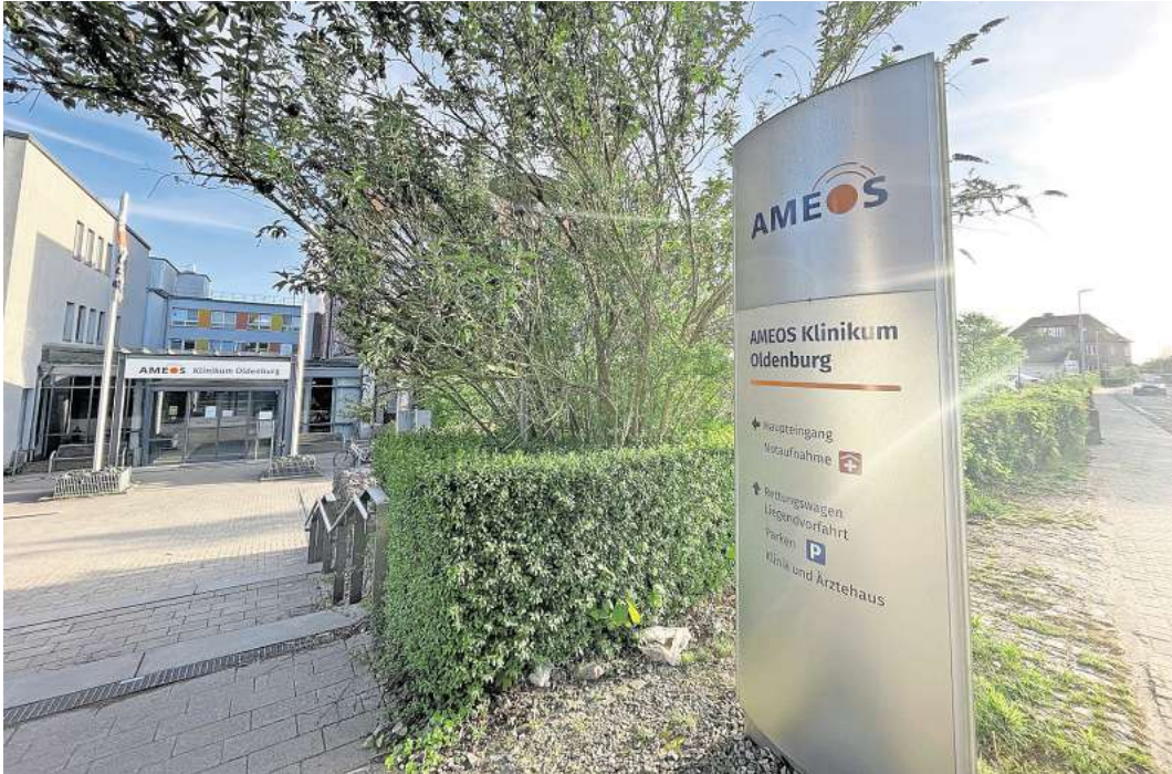
Wie geht es im Ameos-Krankenhaus in Oldenburg weiter? Nach der Schließung der geriatrischen Tagesklinik werden weitere Einsparungen befürchtet.

Doch die Sorgen betreffen nicht nur Oldenburg, sondern auch die Standorte Fehmarn, Eutin und Middelburg. Der Kreistag fordert daher, dass Ameos den Betrieb aller vier Kliniken zusichert. „Besorgniserregend sind wiederholte Abmeldungen sämtlicher Akutkrankenhäuser von der Notfallversorgung im vergangenen Jahr“, sagte Garken. Dies mache deutlich, dass die Kliniken an der Belastungsgrenze seien, zeige aber auch den großen Bedarf.