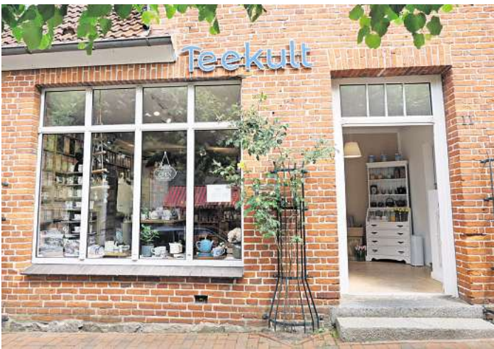
Das Geschäft Teekult befindet sich seit elf Monaten an der Lübecker Straße in Bad Schwartau