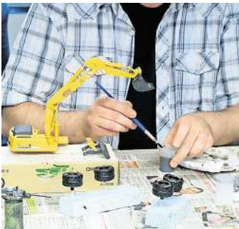
Die Besucher können den Modellbauern auch bei ihrem Hobby zuschauen.