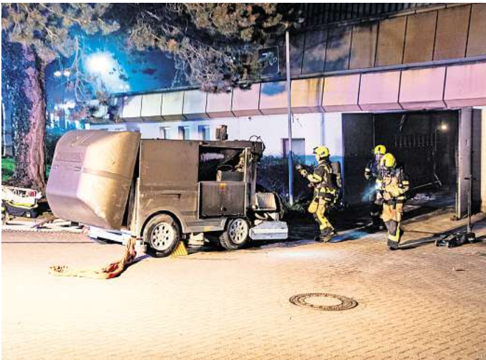
Die Eisbearbeitungsmaschine „Eisbär“ wurde durch die Einsatzkräfte gelöscht und aus dem Gebäude gezogen.

Dass die Beamten am Donners-tag erneut vor Ort waren, bestä-tigt Polizeisprecher Philipp Jagel-le. „Es gibt keine neuen Erkennt-nisse“, teilt er mit. „Es wird in alle Richtungen ermittelt und geprüft, ob ein technischer Defekt der Auslöser gewesen sein könnte.“ Durch das abgebrannte Fahrzeug sei ein Schaden im oberen fünf-stelligen Bereich entstanden.