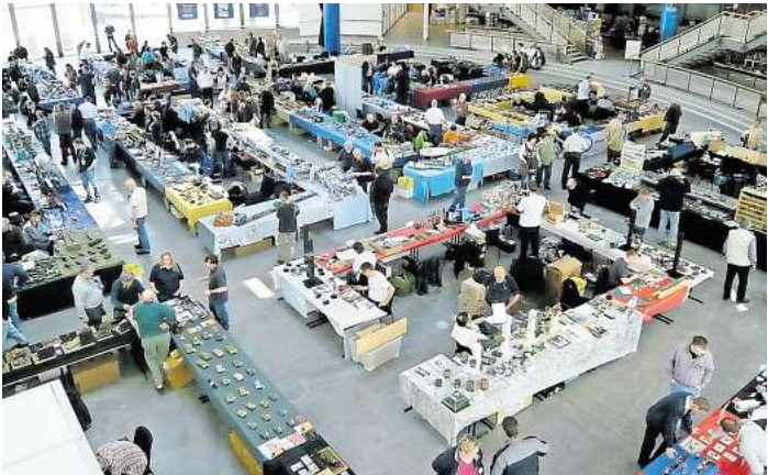
Die Ausstellung des PMCL findet in der MuK statt

LÜBECK. Ein halbes Jahrhundert Modellbau-Leidenschaft: Der Plastik-Modellbau-Club Lübeck (PMCL) feiert sein 50-jähriges Bestehen mit einer großen Jubiläumsausstellung. Am 26. und 27. April öffnet die Musik- und Kongresshalle Lübeck (MuK) ihre Türen für Modellbauer und Besucher aus ganz Deutschland, Dänemark und Österreich. Die Schirmherrschaft für das Jubiläum hat Lübecks Bürgermeister Jan Lindenau übernommen. Der 1975 gegründete Verein hat sich in den vergangenen fünf Jahrzehnten zu einer festen Größe in der norddeutschen Modellbauzene entwickelt. Mit Ausstellungen, die regelmäßig viele Hundert Besucher anziehen, ist der PMCL längst über die Grenzen Lübecks hinaus bekannt. Die diesjährige Jubiläumsschau ist bereits die 20. Ausstellung des Clubs und die zehnte in der MuK – ein deutliches Zeichen für die gewachsene Bedeutung der Veranstaltung. Die erste größere Ausstellung des PMCL fand 1981 statt, die erste in der MuK im Jahr 2002. An beiden Ausstellungstagen wird ein breites Spektrum des Plastikmodellbaus gezeigt. Besucher dürfen sich auf detailreiche Fahrzeuge, Trucks, Lkws, Rennwagen, Flugzeuge, Schiffe, Militärfahrzeuge und Figuren freuen – ebenso auf fantasievolle Modelle aus den Bereichen Science Fiction und Fantasy. Besonders Star-Wars-Fans kommen auf ihre Kosten. Auch die Lübecker Modellbahnfreunde sind mit ihrer HO-Modulanlage vertreten und bieten spannende Einblicke in den Anlagenbau. Ein weiteres Highlight: Der