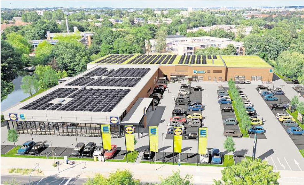
Zwei große Einkaufsmöglichkeiten an einem Platz: Neben dem Edeka-Markt soll in Buntekuh auch ein Lidl-Discountcenter eröffnen. Bei beiden Neubauten sind Photovoltaik-Anlagen auf dem Dach vorgesehen.

LÜBECK. Die Pläne für den Neubau eines Nahversorgungszentrums auf dem Gelände des ehemaligen Einkaufszentrums Buntekuh schreiten voran. Das Gebäude werde wie geplant im Mai abgerissen, teilte das Fehmarn-Unternehmen Edeka Jens den Lübecker Nachrichten exklusiv mit. Die Firma hatte das Areal in der Korvettenstraße im vergangenen Jahr gekauft. Im Lübecker Stadtteil Buntekuh soll laut Edeka Jens eine moderne Einkaufsumgebung geschaffen werden. „Es wird in Buntekuh wieder eine lebendige Mitte mit einem breiten Lebensmittel-Einzelhandels-Angebot geben.“ Geplant ist die Eröffnung schon im Sommer des kommenden Jahres. Einen genauen Termin gibt es noch nicht. Der Neubau soll allerlei Einkaufsmöglichkeiten bieten: Auf dem Gelände wird den Plänen zufolge ein Edeka-Supermarkt mit 1800 Quadratmeter Verkaufsfläche inklusive einer Bäckerei entstehen. Außerdem zieht ein Lidl-Discountmarkt direkt neben Edeka ein, wie aus einer Planungsgrafik von Edeka Jens hervorgeht. Dieser soll über eine Verkaufsfläche von 1500 Quadratmetern verfügen. Neben den beiden großen Märkten sollen auf 800 Quadratmetern weitere kleinere Geschäfte einziehen können. Dafür