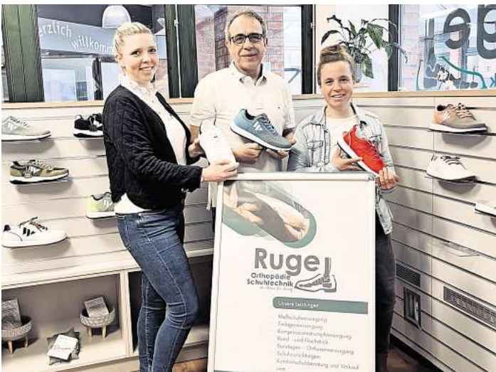
Das Team von Ruge Orthopädie Schuhtechnik freut sich auf den Aktionstag.

Rücken- und Knieproblemen zeigen die Schuhe ihre Wirkung. Auch Venen werden durch das Tragen stimuliert – ideal in Kombination mit Kompressionsstrümpfen. Ob im Alltag, bei der Arbeit oder beim Sport: Die weichen,