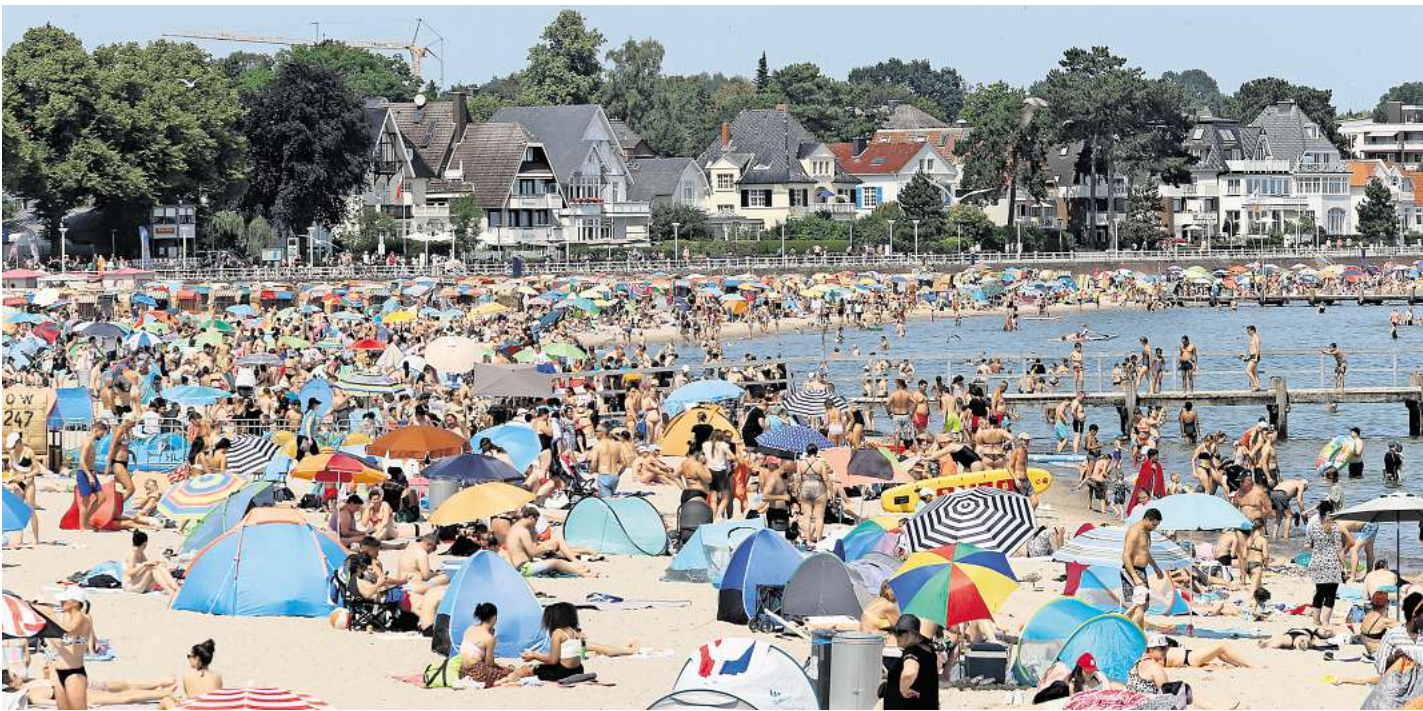
Im Sommer sind die Strände in Travemünde voll. Damit alle Besucher gut miteinander auskommen, gibt es Regeln.

Die Lübecker Bürgerschaft hat beschlossen, dass Grillen, Feuer machen und Zelten am Grün-