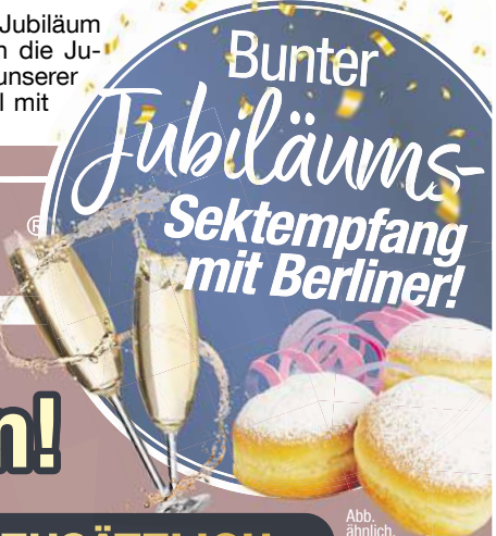
Abb. ähnlich. Nur solange der Vorrat reicht.

Wir nehmen uns Zeit für Sie: Vereinbaren Sie auch gerne einen VIP-Beratungstermin mit unseren (zertifizierten OrthopädiKa) Fachberatern und sichern Sie sich jetzt die einmaligen Jubiläums-Vorteile und kommen Sie in den Genuss eines Spezialisten, der einfach mehr kann!