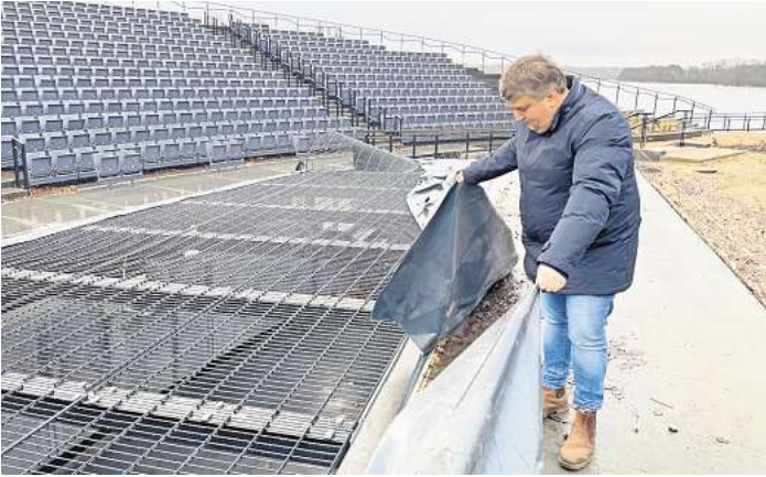
Die im vergangenen Jahr montierte Plane ist kürzlich vom Sturm zerrissen worden. Für den Orchestergraben soll es nun eine Abdeckung geben, die rasch aus- und eingefahren werden kann.

Im Hauptausschuss am Dienstag sollte der Architekt Holger Moths in nichtöffentlicher Runde Stellung zu den Mängeln beziehen. Er hatte der Stadt (Bauherrin der rund 17,5 Millionen Euro teuren Seebühne) vor allem zugesagt, eine Alternative zu der kritisierten Abdeckung zu präsentieren. Wie Bürgermeister Sven Radestock (Grüne) berichtete, hat