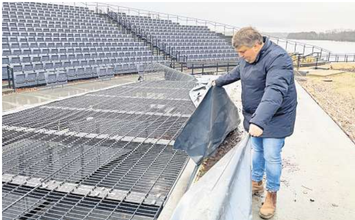
Die im vergangenen Jahr montierte Plane ist kürzlich vom Sturm zerrissen worden. Für den Orchestergraben soll es nun eine Abdeckung geben, die rasch aus- und eingefahren werden kann.

Im Hauptausschuss am Dienstag sollte der Architekt Holger Moths in nichtöffentlicher Runde Stellung zu den Mängeln beziehen. Er hatte der Stadt (Bauherrin der rund 17,5 Millionen Euro teuren Seebühne) vor allem zugesagt, eine Alternative zu der kritisierten Abdeckung zu präsentieren. Wie Bürgermeister Sven Radestock (Grüne) berichtete, hat