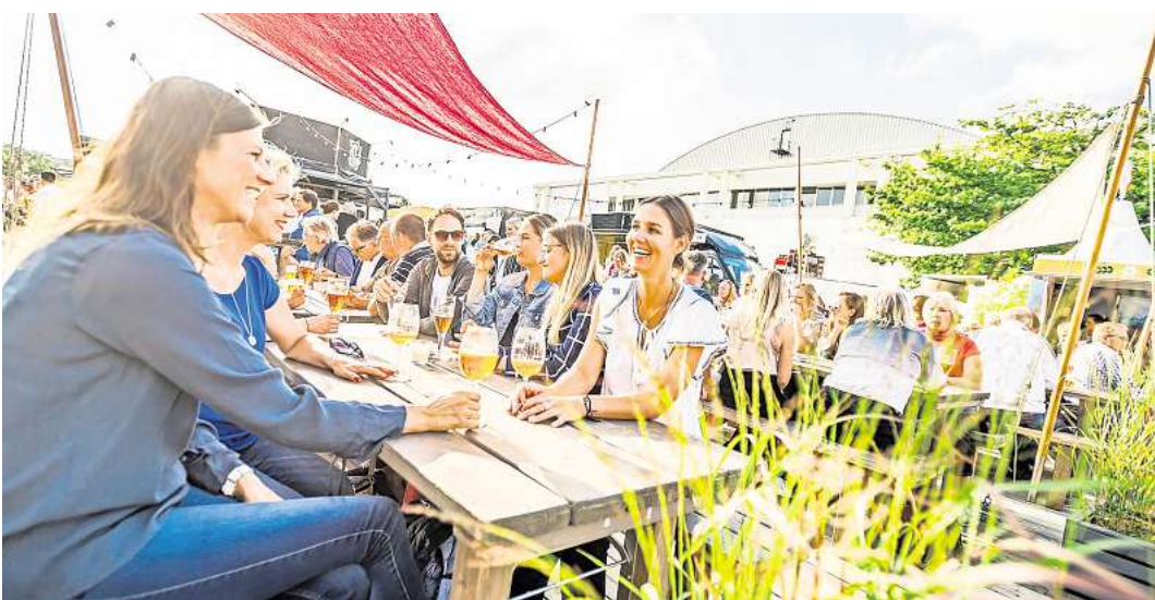
Ähnlich wie beim Lübecker Ducksteinfestival (Foto) könnte die Stimmung bei den Fehmarnbelt Days im Juni am Traveufer werden.