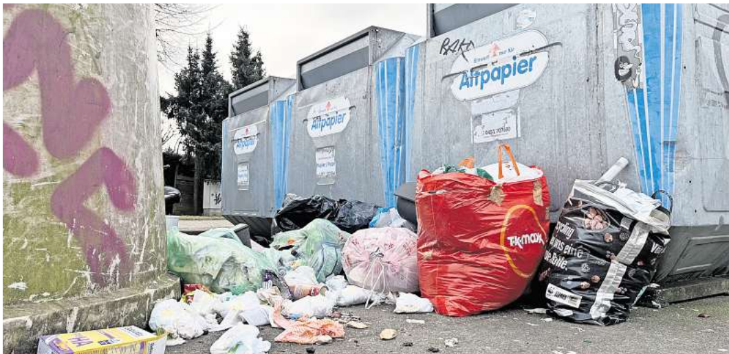
In der Straße Stadtweide in St. Jürgen haben Unbekannte Müll jeder Art einfach an Altpapiercontainer geschmissen.

Üblicherweise aber würde er für seine Hinweise bepöbelt, sagt der 66-Jährige. Ein Mal musste deswegen sogar die Polizei anrücken. Ein anderes Mal habe er einen Menschen fotografiert, der seinen Müll zwischen den Containern abgeladen hat, sagt Gerd D. Daraufhin sei er von dem Mann