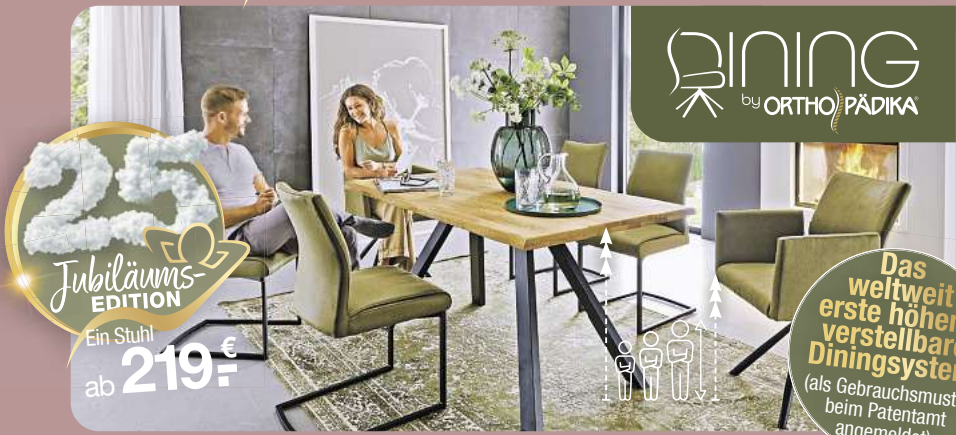
Das weltweit erste höhenverstellbare Diningssystem (als Gebrauchsmuster beim Patentamt angemeldet)