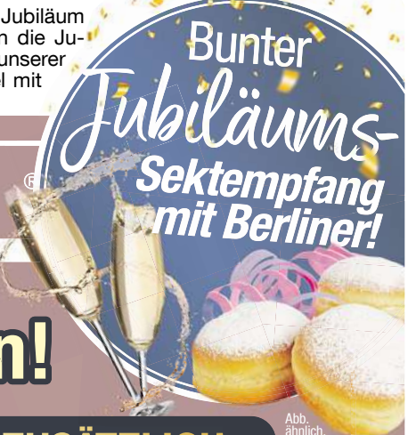
Abb. ähnlich. Nur solange der Vorrat reicht.

Wir nehmen uns Zeit für Sie: Vereinbaren Sie auch gerne einen VIP-Beratungstermin mit unseren (zertifizierten OrthopädiKa) Fachberatern und sichern Sie sich jetzt die einmaligen Jubiläums-Vorteile und kommen Sie in den Genuss eines Spezialisten, der einfach mehr kann!