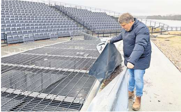
Die im vergangenen Jahr montierte Plane ist kürzlich vom Sturm zerrissen worden. Für den Orchestergraben soll es nun eine Abdeckung geben, die rasch aus- und eingefahren werden kann.

Im Hauptausschuss am Dienstag sollte der Architekt Holger Moths in nichtöffentlicher Runde Stellung zu den Mängeln beziehen. Er hatte der Stadt (Bauherrin der rund 17,5 Millionen Euro teuren Seebühne) vor allem zugesagt, eine Alternative zu der kritisierten Abdeckung zu präsentieren. Wie Bürgermeister Sven Radestock (Grüne) berichtete, hat