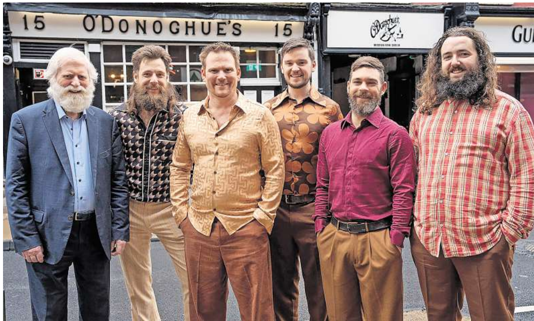
„The Dubliners Encore“ kommen nach Lübeck.