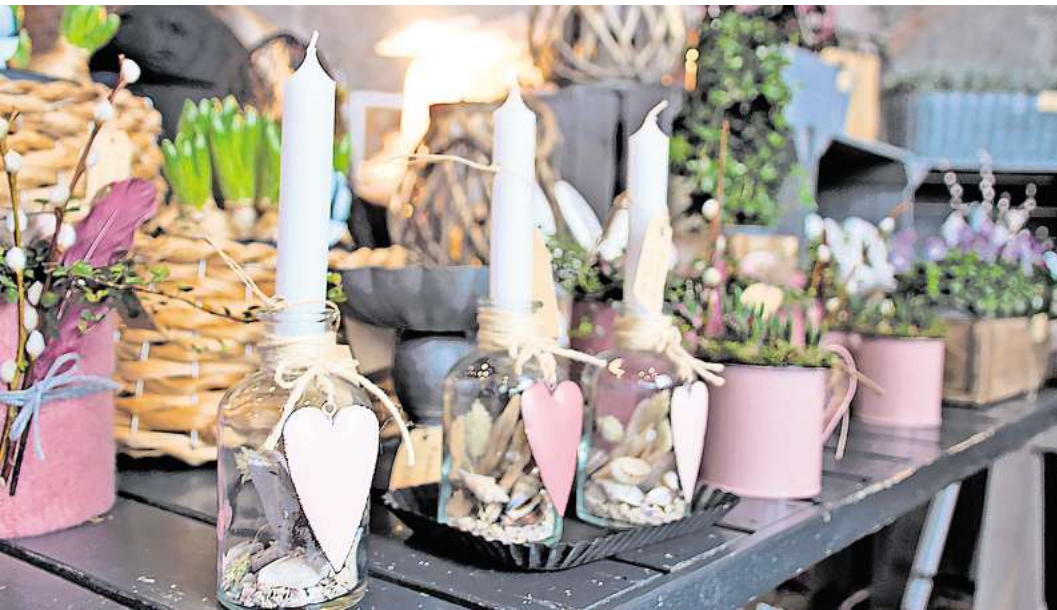
Stilvolles Wohnen – dafür steht die Lifestylmesse „LebensArt“.