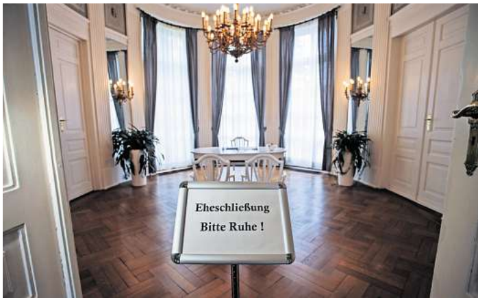
Seit Jahren benötigt das Standesamt in der Ratzeburger Allee mehr Platz. Doch Pläne für einen Umbau sollen nun nicht verwirklicht werden.