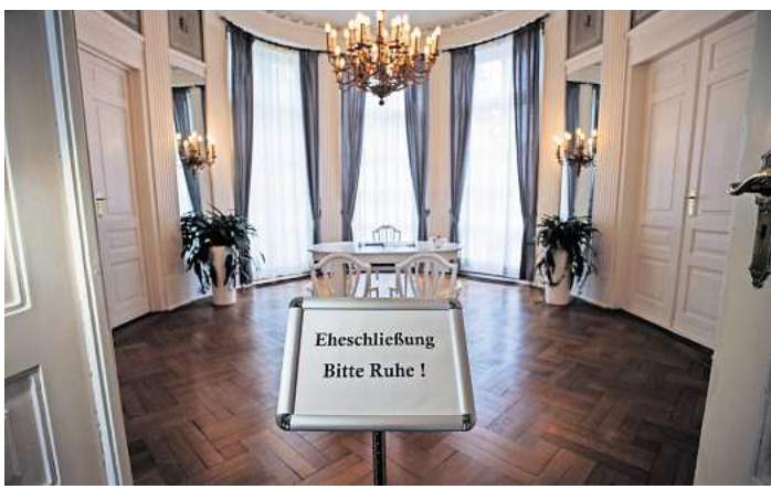
Seit Jahren benötigt das Standesamt in der Ratzeburger Allee mehr Platz. Doch Pläne für einen Umbau sollen nun nicht verwirklicht werden.