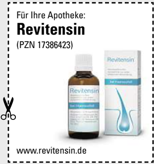
Abbildung Betroffenen nachempfunden. REVITENSIN. Wirkstoffe: Acidum hydrofluoricum Dil. D12, Graphites Dil. D8, Pel. talpae Dil. D8, Selenium Dil. D12, Thallium metallicum Dil. D12, Homöopathisches Arzneimittel zur unterstützenden Behandlung bei Haar- ausfall. Enthält 45 Vol.-% Alkohol. • Zu Risiken und Nebenwirkungen lesen Sie die Packungsbeilage und fragen Sie Ihre Ärztin, Ihren Arzt oder in Ihrer Apotheke. • PharmaSGP GmbH, 82166 Gräfelfing

Egal in welchem Alter oder Le- bensphase: Wir Frauen stylen uns gerne, um unsere Haare in Form zu bringen. Aber wenn wir merken, dass die Haare zunehmend ausfal- len , ist das erschreckend! Dabei ist uns schönes Haar doch so wichtig! Immer mehr Anwenderinnen ver- trauen inzwischen auf das rezept- freie Revitensin (Apotheke), das verschiedene Formen von Haaraus- fall von innen bekämpfen kann. Bei Revitensin ist keine äußere Anwen- dung erforderlich, sodass die Frisur nicht darunter leidet. Die natürlichen Arzneitropfen werden einfach mit einem Glas Wasser eingenommen. Neben- oder Wechselwirkungen sind nicht bekannt. Aufgrund der Wachs- tumsphase der Haare empfiehlt der Hersteller eine Einnahme von mindes- tens 12 Wochen.