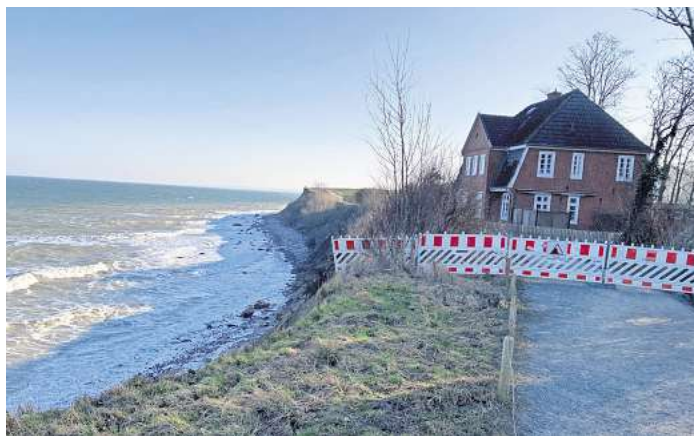
Das ehemalige Jugendhaus Seeblick: Die Abbruchkante des Steilufers kommt dem Backsteingebäude immer näher.

Entsprechend kommt die aktuelle Warnung der Hansestadt nicht unerwartet: „Aufgrund der derzeitigen Witterungslage am Steilufer von Travemünde bis