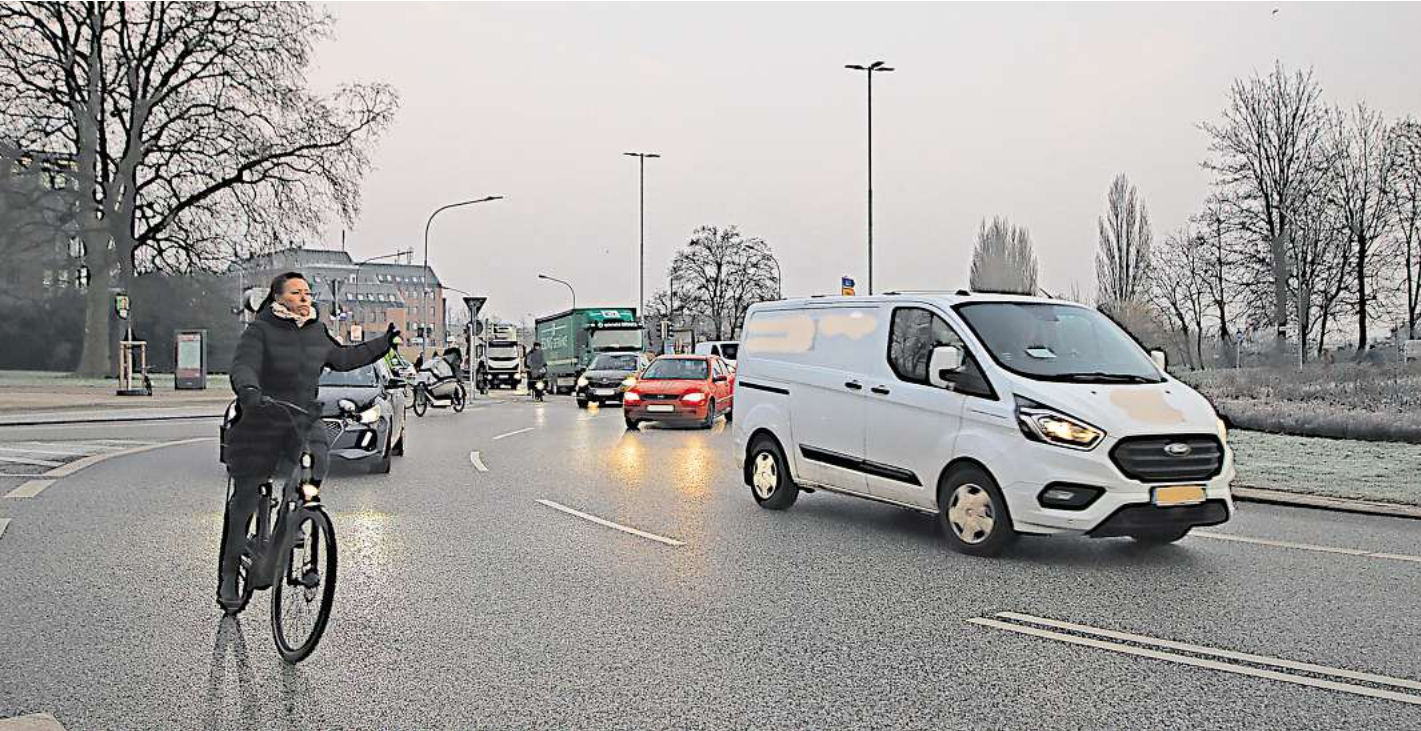
Auf dem Lindenteller in Lübeck müssen Verkehrsteilnehmende besonders aufeinander achten, damit kein Unfall passiert

ben es einfach alle eilig“. Eine ältere Fahrradfahrerin schiebt ihr Rad. Das macht sie hier immer so, seit sie vor einigen Jahren in einem Lübecker Kreisverkehr fast einen Unfall hatte. Drei der fünf gefährlichsten Kreuzungen Deutschlands liegen in Lübeck, und sie sind alle Kreisverkehre: Der Ziegelteiler belegt Platz fünf, der Berliner Platz Rang vier. Auf dem Lindenplatz wurden in 49 der 78 Unfälle Fahrradfahrer verwickelt, das ist mehr als auf jeder anderen Kreuzung Deutschlands. Weil Fahrräder hier oft übersehen werden, wünscht sich der Schüler Aimen Ben Zalem für sie „eine eigene Spur“. Er hat sein Fahrrad auch durch den Lindenteller geschoben, bis er vor Kurzem den Führerschein machte. „Hier ist es besonders wichtig, die Verkehrsregeln zu kennen“, sagt er. Viele Autofahrer halten sich aber nicht an die Regeln. Die zwei Spuren in der Mitte sind durch eine durchgezogene Linie abgetrennt, die oft überfahren wird, sagt Lena Pieconka. „Vielleicht sollte man das besser ausschildern oder durch eine Barriere abtrennen“, schlägt sie vor. Sie arbeitet in der „Apotheke am Lindenplatz“ und hat durch die Glasfront der Schaufenster schon öfter Unfälle mit ansehen müssen. Die Fahrbahn auf eine