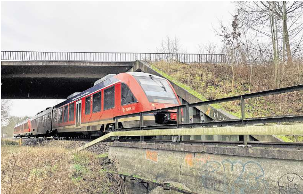
Ihre Zukunft ist ungewiss: Auf welcher Strecke wird die Bäderbahn – hier ist ein Zug unter der B432 unterwegs – künftig fahren oder wird der Betrieb ganz eingestellt?

Hochrangige Vertreter der Bahn, der Landesregierung und der Kommunen hatten bei der Sitzung vor einigen Wochen über die Bäderbahn diskutiert. Der Hintergrund der seit Jahren schwelenden Debatte: Das Land plant, den Personennahverkehr in Zukunft über die neue Schienenhinterlandanbindung des Belttunnels zu führen. Die alte Bäderbahn soll nicht weiterbetrieben werden. Für Timmendorfer Strand bedeutet das, dass man nur noch über den neuen Bahnhof nahe der Ratekauer Anschlussstelle der A1 angebunden wäre.