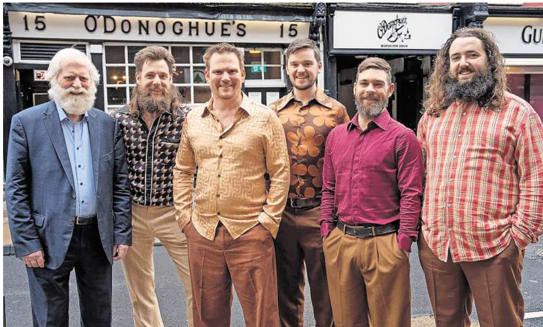
„The Dubliners Encore“ kommen nach Lübeck.