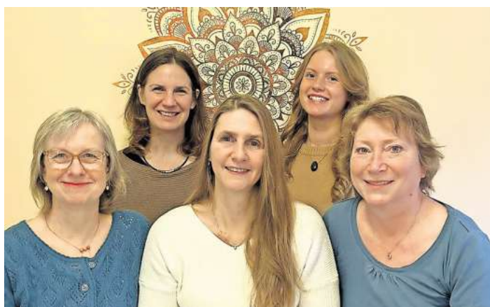
Das Team des Zentrums für bewusstes Leben „VIVIS-SATYA“ lädt zu einem Tag für Gesundheit und Wohlbefinden.

„Dabei geben wir den Besuchern die Möglichkeit, in unterschiedliche Praktiken und Themen Einblick zu nehmen.“ Im Fokus stehen Prävention, Gesundheits- und Lebensberatung. Weitere Themen sind unter anderem: Ernährung, Persönlichkeitsentwicklung, innere, emotionale Prozessarbeit, energetisches Heilen und Wellness. Den