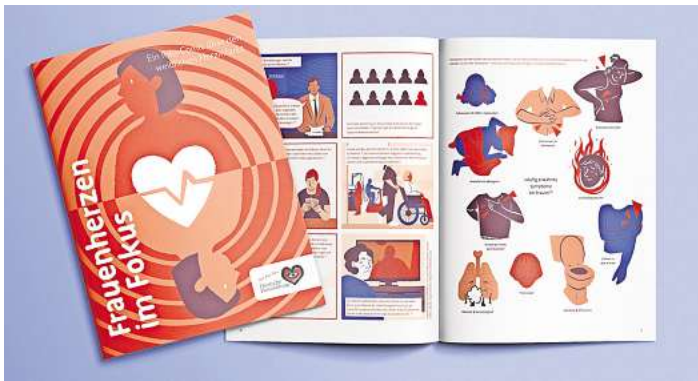
Den Comic der Herzstiftung kann man bestellen.