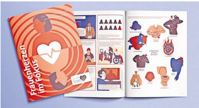
Den Comic der Herzstiftung kann man bestellen.