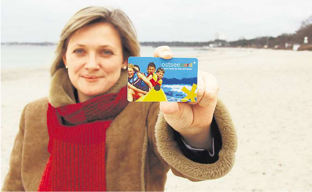
Mit der Ostseecard erhalten Urlauber zudem diverse Vergünstigungen.