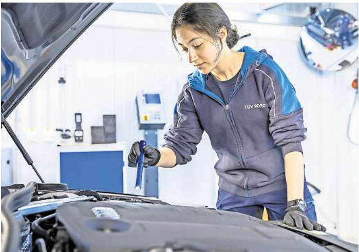
Bei der Hauptuntersuchung werden die Fahrzeuge auf Mängel untersucht.

Das ist das Ergebnis der statistischen Aufarbeitung aller Hauptuntersuchungen, die an den