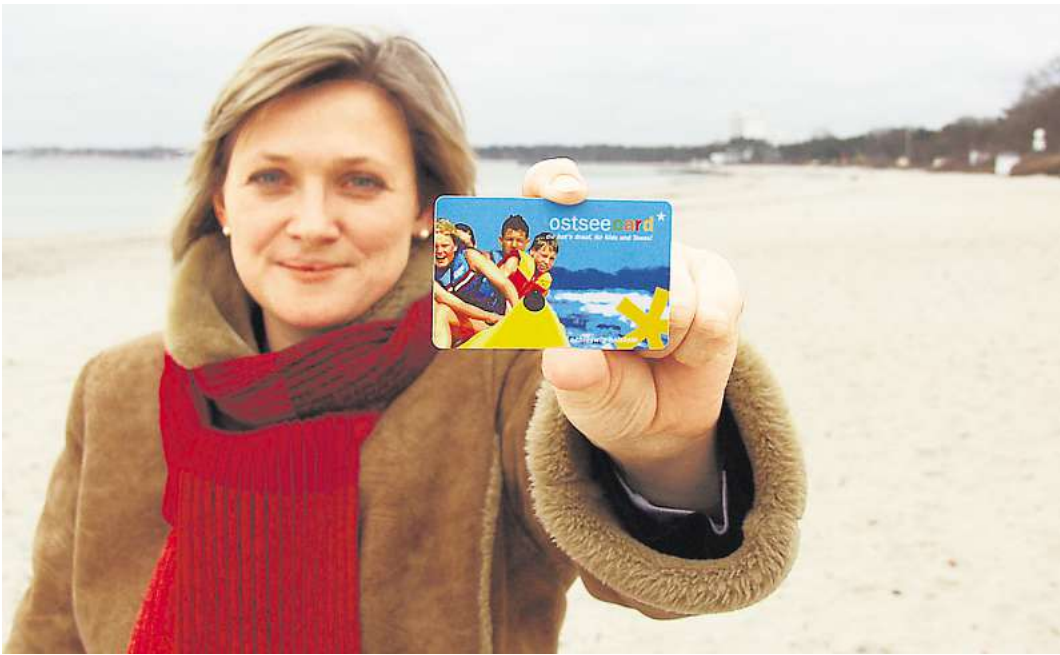
Mit der Ostseecard erhalten Urlauber zudem diverse Vergünstigungen.