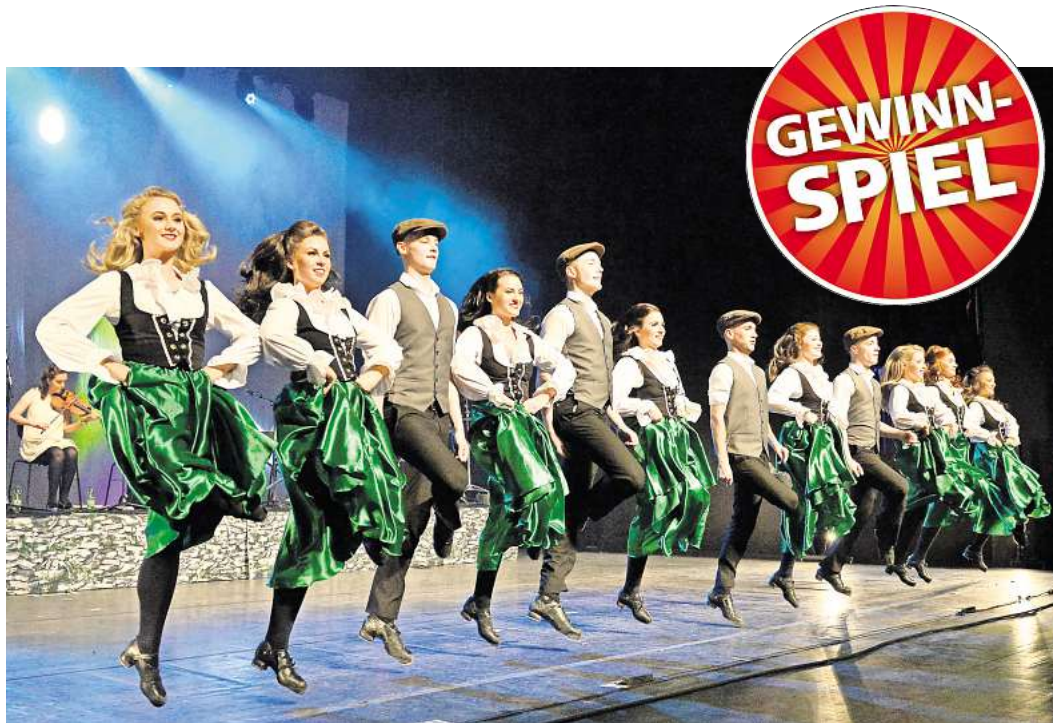
„Hooked“ heißt das neue Programm der „Danceperados of Ireland“.

Bei der zweiten Idee des Dorfvorstands handelt es sich um einen „ Spieletreff “, der erstmals am Samstag, 18. Januar, ab 15 Uhr im Haus des Gastes stattfinden soll. Als Folgetermine sind der 15.02. und der 15.03.25 vorgesehen. Spiele sind vorhanden (Klassiker und Neues, Brett- und Kartenspiele), dürfen aber auch mitgebracht werden, das Mindestalter der Teilnehmer wird bei 8 Jahren festgelegt. Anmeldungen sind nicht erforderlich. Es soll die Gelegenheit gegeben werden, neue Spiele kennenzulernen, vorhandene Spiele vorzustellen oder bekannte Spiele endlich mal wieder zu spielen.