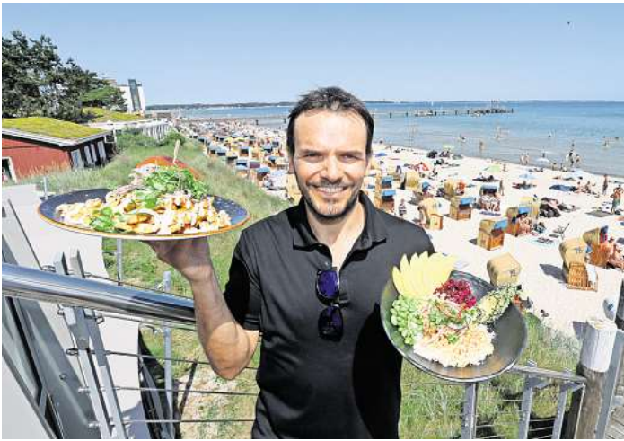
Steffen Henssler bei der Eröffnung des Ahoi-Restaurants Scharbeutz im Jahr 2021.

Im Erdgeschoss öffnete erst nach monatelanger Schließung im vergangenen Sommer die Strandbude. Dort gibt es neben den klassischen Fischgerichten seither auch Waffeln und Kaffeespezialitäten. Lange Zeit eine Baustelle war auch der Standort in Scharbeutz. Rund eineinhalb Jahre nach der Neueröffnung im Jahr 2021 gab es eine Zwangspause. Fünf Monate brauchte es, um einen Wasserschaden im Keller des Gebäudes an der Promenade zu beheben. Mit der Wiedereröffnung wurde dann die Su-