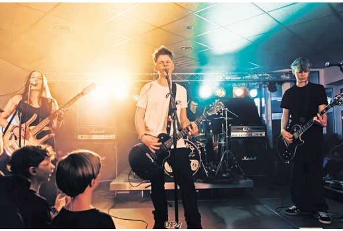
Bandbattle von der School of Rock.

TIMMENDORFER STRAND. Es wird laut, es wird spannend, es wird mitreißend! Am Freitag, 31. Januar, findet das große Bandbattle der School of Rock Timmendorfer Strand statt. Ab 20 Uhr wird die Mensa der GGS Strand Europaschule (Poststraße 32 a-c, 23669 Timmendorfer Strand) zum Zentrum für rockige Beats, starke Stimmen und talentierte Nachwuchsbands. Der Eintritt ist frei, und die Veranstalter laden alle Musikbegeisterten der Region herzlich dazu ein, bei diesem besonderen Event dabei zu sein.