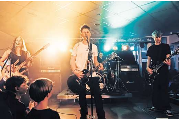
Bandbattle von der School of Rock.