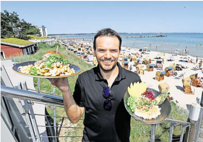
Steffen Henssler bei der Eröffnung des Ahoi-Restaurants Scharbeutz im Jahr 2021.

Im Erdgeschoss öffnete erst nach monatelanger Schließung im vergangenen Sommer die Strandbude. Dort gibt es neben den klassischen Fischgerichten seither auch Waffeln und Kaffeespezialitäten. Lange Zeit eine Baustelle war auch der Standort in Scharbeutz. Rund eineinhalb Jahre nach der Neueröffnung im Jahr 2021 gab es eine Zwangspause. Fünf Monate brauchte es, um einen Wasserschaden im Keller des Gebäudes an der Promenade zu beheben. Mit der Wiedereröffnung wurde dann die Su-