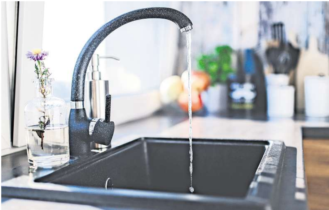
Trinkwasser ist das bestkontrollierte Lebensmittel. Die Leitungen in Timmendorfer Strand werden erneut gereinigt.

„Diese Arbeiten sind eine vorbeugende Maßnahme, um die Qualität des wichtigsten Lebensmittels langfristig zu sichern“, erklärt Katharina Mangelsen. Im Laufe der Zeit lagerten sich natürliche, für die Gesundheit unbedenkliche Stoffe wie Eisen und Mangan in den Rohrleitungen ab. Um diese Ablagerungen zu entfernen und das Netz vor Trübungen zu schützen, setze der ZVO auf ein „patentiertes Impuls-Luft-Spül-Verfahren“.