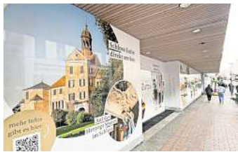
Eine Idee aus „Eutin macht mit“: die mit Folien geklebten Schaufenster des LMK-Kaufhauses.