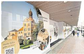
Eine Idee aus „Eutin macht mit“: die mit Folien beklebten Schaufenster des LMK-Kaufhauses.