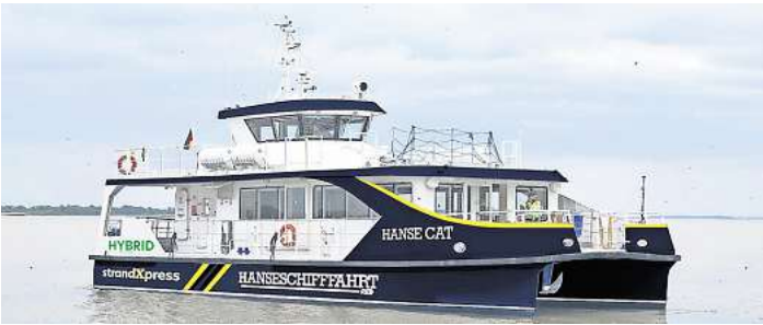
Der Hybrid-Katamaran „Hanse Cat“ ist auf der Ostsee mit bis zu 20 Knoten unterwegs.

SCHARBEUTZ. Die Bäderschiffahrt auf der Ostsee hat eine lange Tradition. Seit mehr als 100 Jahren bringen Schiffe die Ausflügler und Urlaubsgäste von Lübeck aus zu den Seebädern in der Lübecker Bucht oder verbinden die Bäderorte miteinander. Ausdruck dieser langen Tradition sind die Seebrücken, an denen die Bäderschiffe anlegen. Ab Ostern kommt zu den traditionsreichen Bäderschiffen ein neues hinzu: Die „Hanse Cat“, ein Hybrid-Katamaran der Reederei Hanseschiffahrt RB, verkehrt dann zwischen 10 und 18 Uhr im Zweistunden-Takt mehrmals täglich zwischen Lübeck-Travemünde und Scharbeutz. Die „Hanse Cat“ ist bis zu 20 Knoten (37 Kilometer pro Stunde) schnell. Damit schafft sie nach Angaben der Reederei die schnellste Verbin-