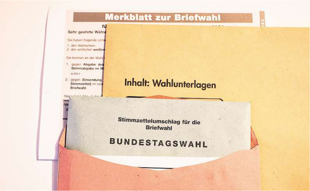
Am Sonntag, 23. Februar, haben die Bürger die Wahl.