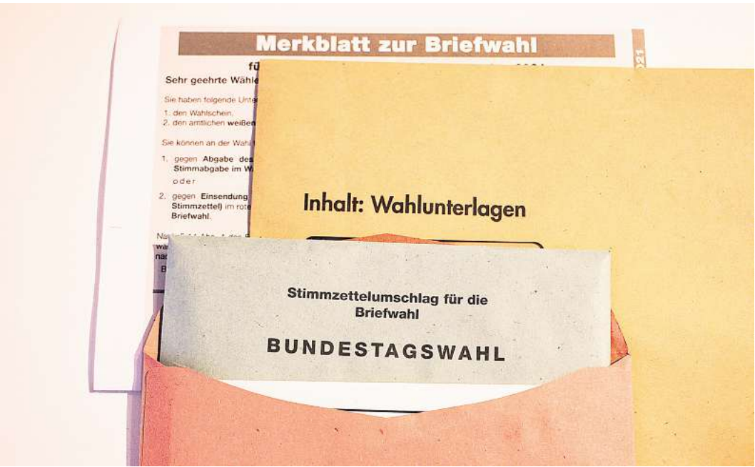
Am Sonntag, 23. Februar, haben die Bürger die Wahl.

EUTIN. In Deutschland kommt es zur vorgezogenen Wahl des neuen Bundestags. Für Städte und Gemeinden bedeutet der kurze Zeitraum bis zum Wahltag 23. Februar viel Arbeit. Insbesondere bei der Briefwahl kommt es auf jeden Tag an – ein Überblick. Frst für Kandidaten: Noch bis zum 20. Januar um 18 Uhr können sich Kandidaten für den Wahlkreis 9 Ostholstein – Stormarn-Nord bewerben. Die Unterlagen müssen beim Kreiswahlleiter schriftlich eingereicht werden (Lübecker Straße 41, 23701 Eutin). Eine Partei kann pro Wahlkreis nur einen Vorschlag einreichen. Parteien, die im Bundestag oder Landtag seit der letzten Wahl nicht aufgrund eigener Wahlvorschläge mit mindestens mit fünf Abgeordneten vertreten waren, mussten ihre Beteiligung bereits bis zum 7. Januar anzeigen. Anforderungen an Bewerber: Kandidieren kann nur, wer mindestens 18 Jahre alt ist und die deutsche Staatsangehörigkeit besitzt. Zudem muss über den Antritt vorher bei einer Wahlkreisversammlung abgestimmt worden sein. Das sind die bisherigen Kandidaten: Sebastian Schmidt (CDU), Bettina Hagedorn (SPD), Annette Granzin (Grüne), Tobias Maack (FDP), Volker Schnurr-