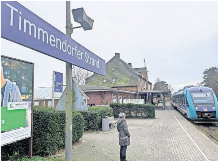
Der Bürgermeister von Timmendorfer Strand stellt in Aussicht, dass der Urlaubsort auch nach dem Bau der andernorts verlaufenen Belttrasse per Zug erreichbar sein wird.

Laut Partheil-Böhnke ist hingegen längst klar, dass alles auf eine Schienenanbindung hinausläuft. Und zwar auf eine halbe Bäderbahn, für die in Timmendorfer Strand Endstation ist. Im Dialogforum zur Festen Fehmarnbeltquerung plauderte der Bürgermeister aus dem Nähkästchen.