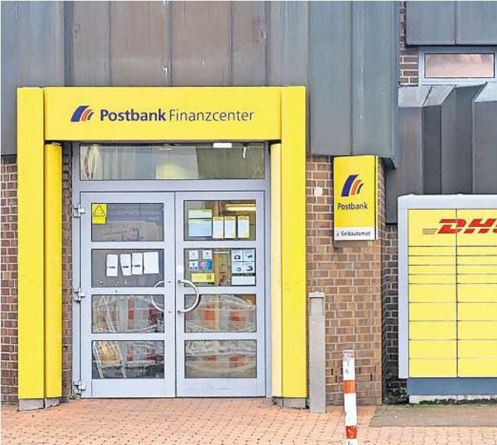
Schließt zum 15. Januar: Die Postbank-Filiale am Lübecker Meesenring.

Nun folge die Postbank: Im August hatte die Postbank noch in Aussicht gestellt, ihre Filiale erst im Laufe des kommenden Jahres zu schließen. „Mit Blick darauf