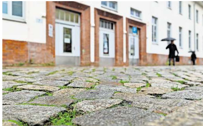
Am Meesenring soll der Übergang zum Bürgerservicebüro neu gepflastert werden.