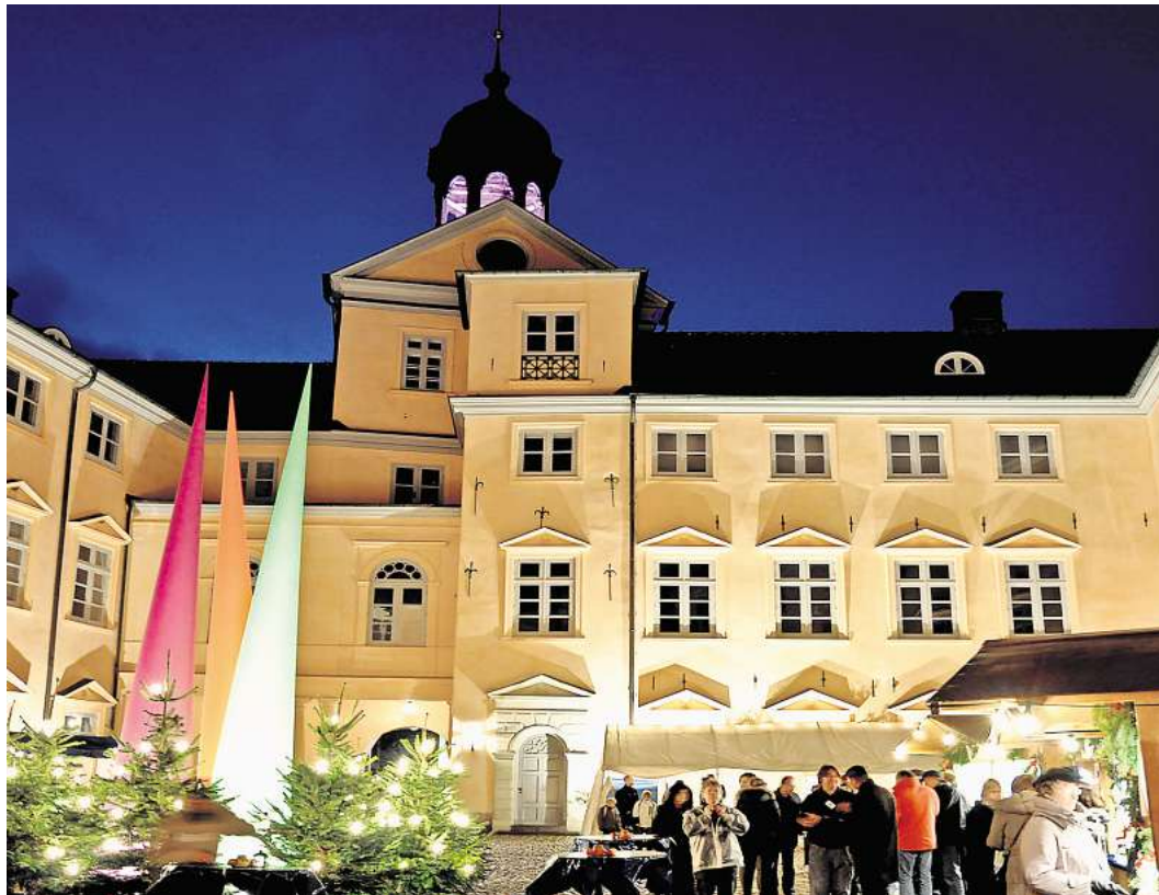
Bei der Kiwanis „Weihnacht im Schloss“ herrscht eine feierliche Stimmung.

Sind Sie alleine zu Hause und Ihr Tag wird immer „länger“? Wir haben Plätze frei! ☎ 0451/47 97 90 84