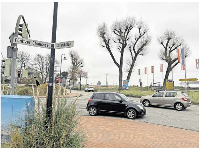
Die Strandallee in Scharbeutz gehört laut Allianz-Analyse zu den gefährlichsten Straßen in Schleswig-Holstein.

Für die Polizei hat die Studie der Allianz keine Bedeutung. „Die bloße Addition von Verkehrsun-