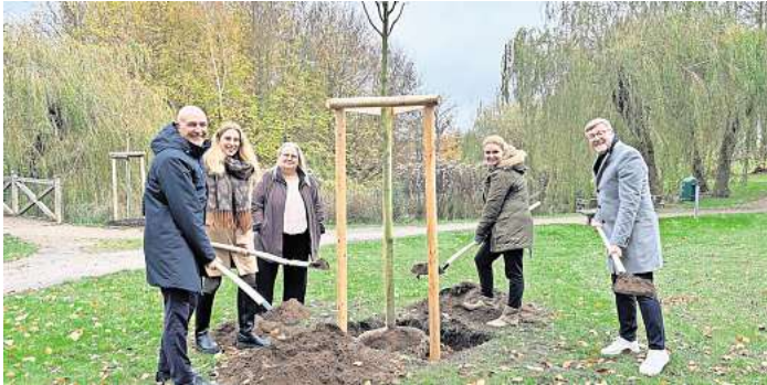
In einer Gemeinschaftsaktion wurde der 41. Baum an der Bergstraße gepflanzt.

TIMMENDORFER STRAND. Schatten und Abkühlung finden: Damit das in Zukunft an heißen Tagen im Kurpark in Timmendorfer Strand möglich ist, werden 50 neue Bäume und Sträucher angepflanzt. Die Aktion kostet 60.000 Euro. 90 Prozent davon übernimmt der Bund, denn die Pflanzaktion geschieht im Rahmen des Bundesprogramms „Anpassung urbaner Räume an den Klimawandel“. „Wir haben das Meer vor der Tür. Deshalb ist uns der Klimaschutz besonders wichtig“, erklärt Bürgermeister Sven Partheil-Böhne. 2021 beschloss die Gemeinde daher, den historischen Baumbestand des Kurparks, der seit 1935 besteht, wiederherzustellen. Der Zuwendungsbescheid vom Bauministerium, also die Bestätigung zur Förderung, folgte dann im Jahr