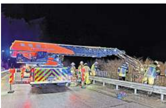
Die Drehleiter stand auf der Eisenbahnbrücke an der Röntgenstraße bereit, um den Verletzten aus dem Gleisbett zu holen.

Ersten Ermittlungen der Polizei zufolge balancierte der Mann vor dem Absturz auf dem Geländer der Brücke, die auf der Röntgenstraße über die Bahnstrecke Kiel-Lübeck führt. Dabei sei er vermutlich aus dem Gleichgewicht geraten oder abgerutscht, erklärte ein Beamter. „Einen Suizidversuch schließen wir aus.“ Die Fallhöhe habe acht bis zehn Meter betragen. Glücklicherweise landete der anscheinend übermütige Turner nicht auf den Betonschwellen oder Stahlschienen, sondern im