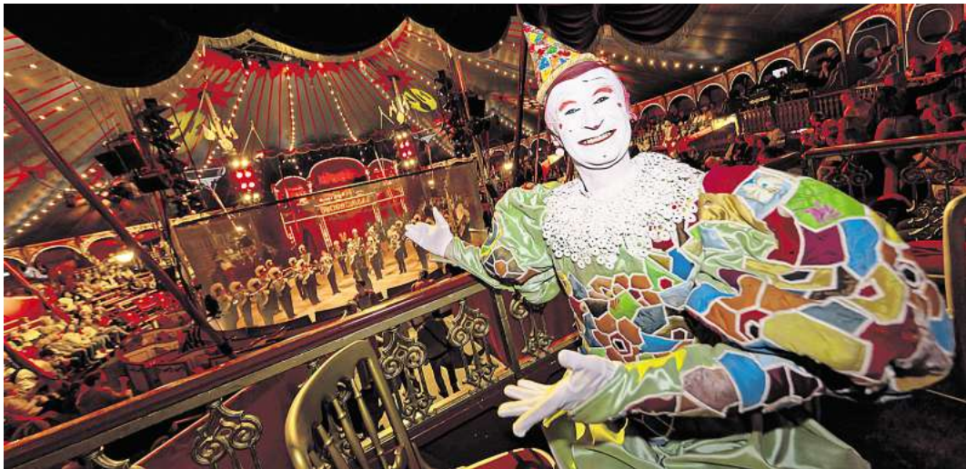
Circus Roncalli kommt 2025 zurück nach Lübeck.

Denn seit vielen Jahren ist der Circus Roncalli tiefrei. In den ver-