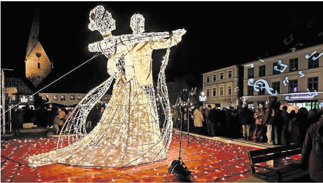
Beliebtes Fotomotiv: Das Tanzpaar auf dem Marktplatz feierte im vergangenen Jahr Premiere in Eutin.

Noten und Notenschlüssel erhellen den Durchgang von der Michaeliskirche zum Marktplatz, der wie im vergangenen Jahr zu einem Ballsaal werden soll – mit Kronleuchtern an den Laternen rundherum. Wer die Lichterstadt bis zum 5. Januar zwischen 16 und 21 Uhr besucht, wird auf weitere, schon bekannte Lichtobjekte auf dem 1,5 Kilometer langen Rundgang durch die Stadt stoßen: die Taschenuhr, die Bilderrahmen mit Porträts bekannter Eutiner, den Flügel und natürlich Rosen. Die Lichterstadt Eutin wird am 25. November um