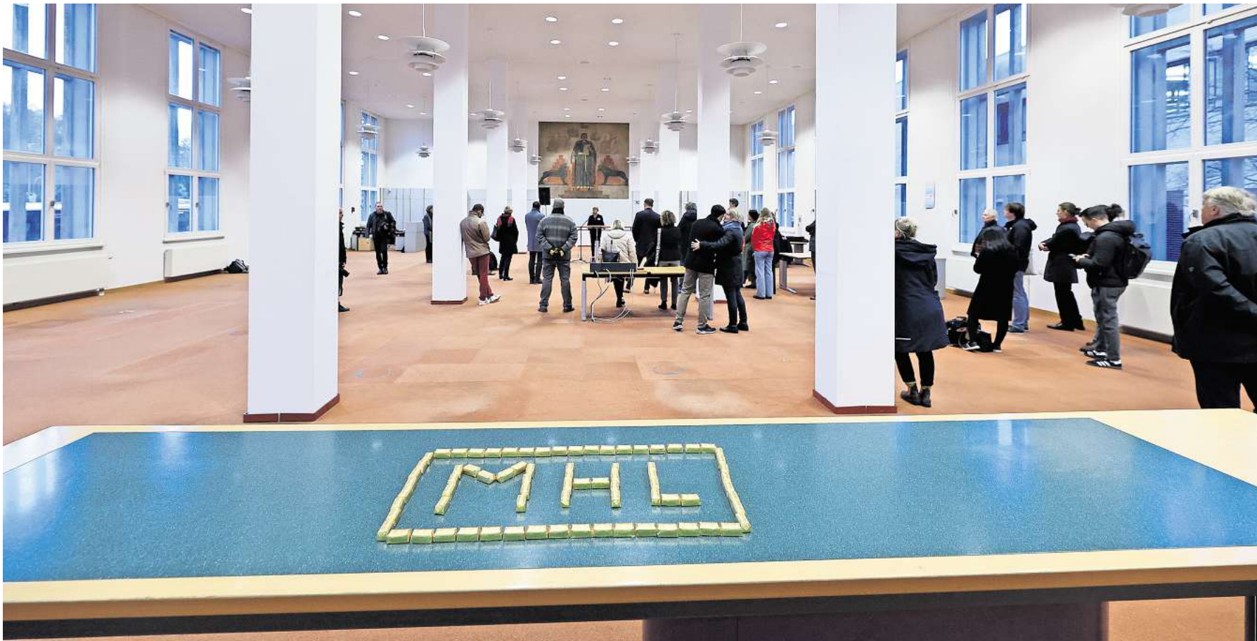
Die ehemalige Schalterhalle gilt als schönster Raum der alten Bundesbank. Zur Begrüßung der Gäste wurde der MHL-Schriftzug mit Marzipan ausgelegt.

ST. GERTRUD. Der Verein Wir auf Marli lädt zum vierten Mal zusammen mit der Thomas-Kirche zu einem Weihnachts- & Kunsthandwerkermarkt ein. Am Samstag, 6. Dezember, von 13 bis 18 Uhr findet dieser in der Kirche an der Marlistraße 48, Eingang Thomasstraße/Rudolf-Groth-Straße, statt. Der Eintritt ist kostenlos. Es bieten die verschiedensten Aussteller ihre handgefertigten Stücke an. Von Taschen und Schals, über Töpferarbeiten und Schmuck aus Fahrradschläuchen, sowie natürlich Sterne, Tannenbäume, Adventskränze, Geschmiedetes, Lichtvariationen und vieles mehr. Es wird Schönes oder Nützliches dabei sein.