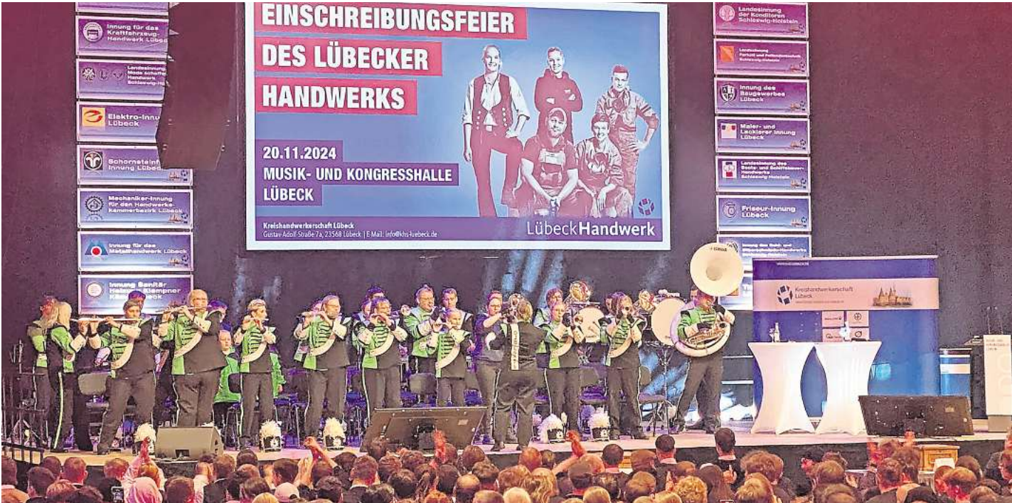
Die neuen Azubis des Handwerks wurden mit der Einschreibungsfeier in der MuK begrüßt.