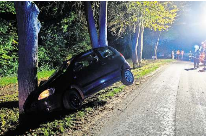
Das Auto schlug frontal mit der Beifahrerseite gegen den Baum. Die Fahrerin konnte durch Ersthelfer gerettet werden.

TIMMENDORFER STRAND. Die ev.-luth. Kirchengemeinde in Timmendorfer Strand bietet ein monatliches Treffen donnerstags von 19 bis 21 Uhr für Menschen, die ein kreatives Hobby haben, an. Sei es Kalligrafie, unterschiedlichste Strick- und Stickarbeiten, Aquarell-Malerei, schwe-