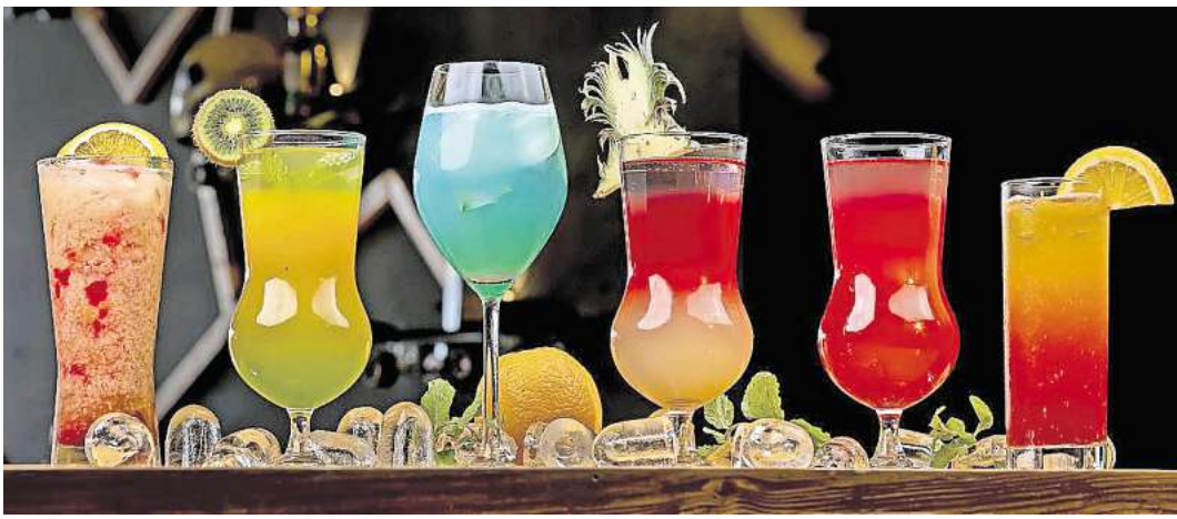
Auf Partys können K.-o.-Tropfen unauffällig in Getränke gemischt werden.

Darüber hinaus spielen Schamgefühle eine große Rolle. „Betroffene machen sich selbst oft Vorwürfe. Sie denken zum Beispiel: ‚Ich hätte besser aufpassen