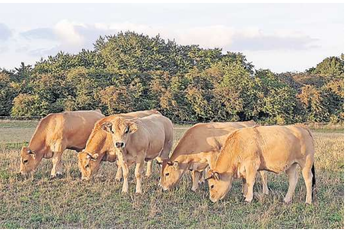
Die Rinderherde verbringt den Sommer auf Moorwiesen.