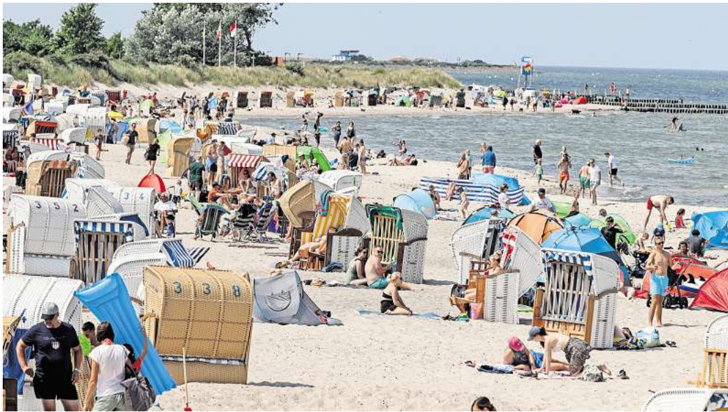
Sommerspaß am Strand von Heiligenhafen. In diesem Urlaubsort wird von 2025 an die Kurabgabe sowohl für den An- als auch für den Abreisetag berechnet.

„In der Hotellerie und in den Ferienwohnungen gehen die Beschwerden jedoch gegen null“, führt Lütje aus. Ein Grund sei vermutlich, dass die Kurabgabe nicht mehr so umstritten sei wie einst. „Heute sehen die Gäste klar, welche Infrastruktur ihnen dafür geboten wird.“ Die Einnahmen steigen seinen Angaben zufolge durch die Berechnung von An- und Abreisetag um 700.000 Euro pro Jahr.