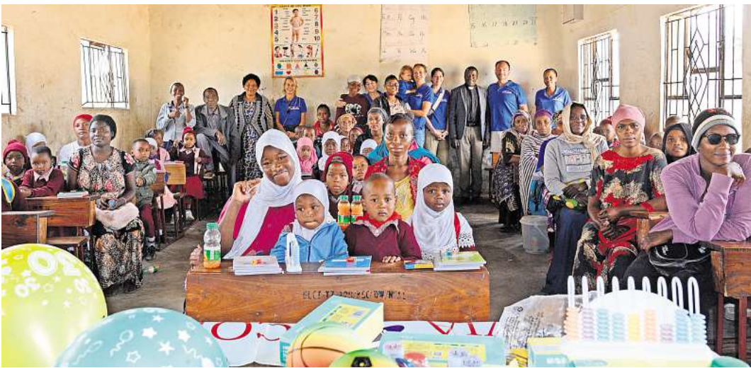
In der Vorschule von Kibaya.