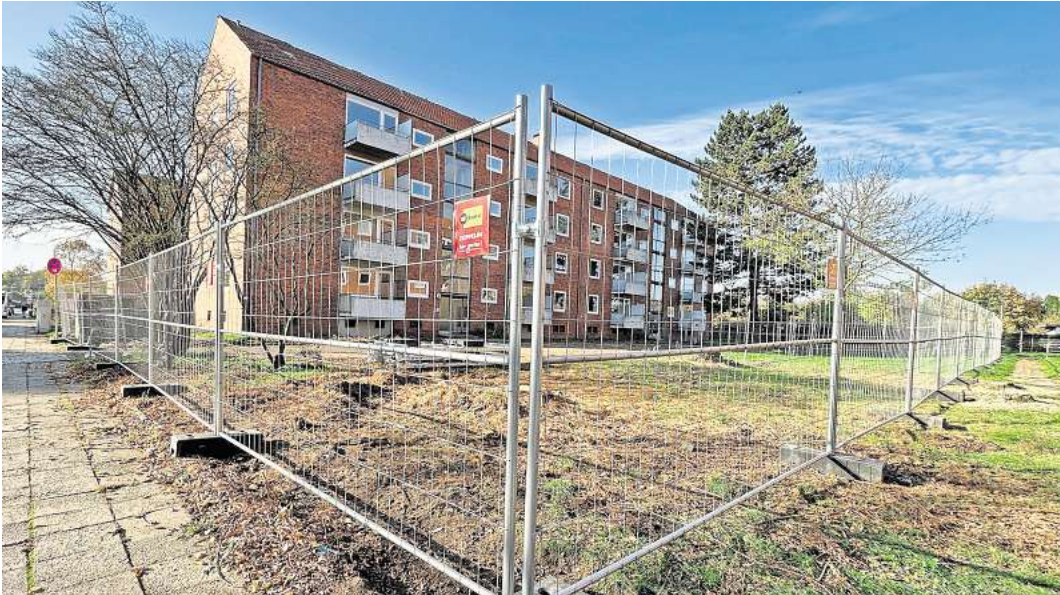
Die Wohnblöcke an der Schönböckener Straße 80-86 werden aufwendig saniert. Die Mieter aus den 128 Wohnungen mussten dafür raus.

„Zuletzt werden auch die Außenanlagen neu organisiert und gestaltet, um die Nutzbarkeit und die Lebensqualität im Quartier insgesamt zu erhöhen“, kündigt