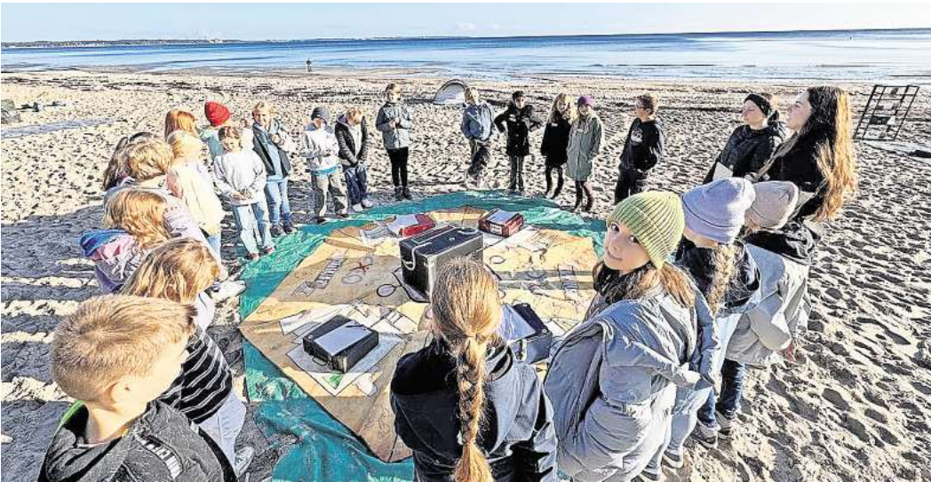
Teambuilding-Tag mit Schülern des OGT.

Das Highlight des Tages bildete das Escape Game: In kleinen Gruppen mussten die Schülerinnen und Schüler in verschiedenen „Räumen“ knifflige Rätsel