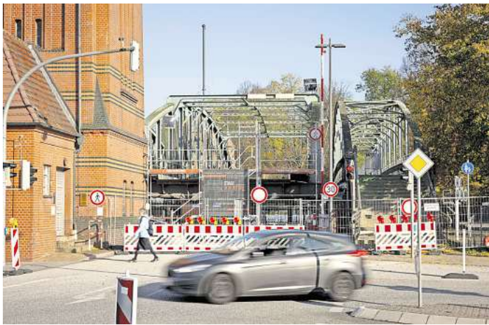
Die Lübecker Hubbrücke ist dauerhaft gesperrt. Damit fällt die Querung als Umleitung für die Beckergrube weg.

Für diese müsste das Wasserstraßen- und Schiffsamt (WSA) Ostsee sorgen. Denn Eigentümer der Brücke ist nicht die Hansestadt Lübeck, sondern der Bund. Und das WSA machte auf Nachfrage der LN jetzt deutlich: Aufgrund der Schäden ist es tech-