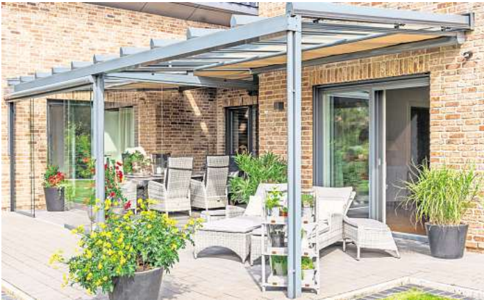
Nelson Park ist Spezialist für Terrassendächer

Problemlos könnte sich die Überdachung schrittweise zu einem Kaltwintergarten erweitern lassen, der eine interessante und preisgünstige Alternative