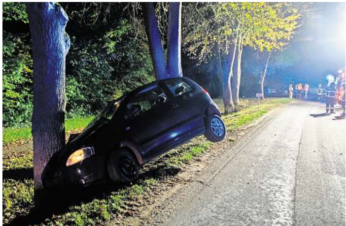
Das Auto schlug frontal mit der Beifahrerseite gegen den Baum. Die Fahrerin konnte durch Ersthelfer gerettet werden.