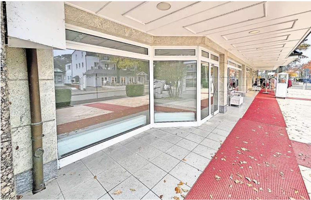
Vor diesem Geschäft an der Timmendorfer Strandallee wartet der rote Teppich vergebens auf interessierte Kundschaft: Der Laden ist leer.