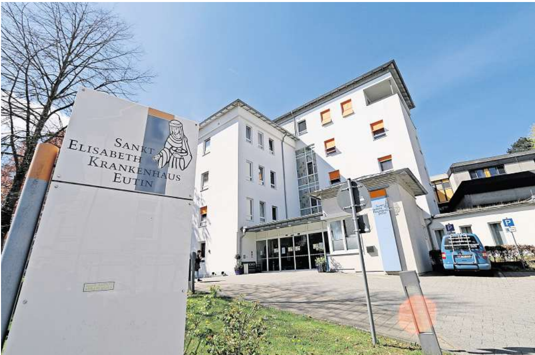
Das Elisabeth-Krankenhaus in Eutin. Derzeit wird ein neues Gebäude gebaut, um das Angebot zu erweitern.

Zugleich betont sie, dass keine Leistungen wegfallen werden. Stattdessen gehe es darum, bestehende Angebote auszubauen. Unter anderem plane man die Einrichtung einer palliativmedizinischen Tagesklinik. Weiter kündigt Kloor an: „Wir bauen aufgrund des großen