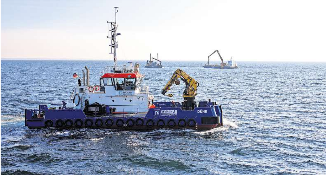
Das Multifunktionsschiff „Düne“ der Firma Eggers sorgt für Sicherheit im Sperrgebiet des Pilotprojekts.

Experten gehen von geschätzten 1,6 Millionen Tonnen Munition aus. Davon 300.000 Tonnen