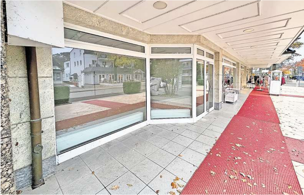
Vor diesem Geschäft an der Timmendorfer Strandallee wartet der rote Teppich vergebens auf interessierte Kundschaft: Der Laden ist leer.