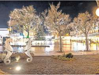
Verträumte Stimmung kommt auf, wenn das Timmendorfer Zentrum erstrahlt.

Vorher gibt es bereits ab 13 Uhr auf dem Timmendorfer Platz Glühwein, Kinderpunsch, Crêpes, Bratwurst und Gulaschsuppe. Die Teilnehmer am Laternenumzug treffen sich um 17.45 Uhr auf dem Familia-Parkplatz am Höppnerweg und laufen, begleitet von Feuerwehr und Spielmannszug, zum Timmendorfer Platz. Dort sind dann schon die Büdchen vom Bärenwald aufgebaut, und auf der Showbühne sorgt der Hamburger Afro-Gospel-Chor für Stimmung. Um 18.30 Uhr eröffnen Pastor Lars Lemke und einige Offizielle aus der Gemeinde die Aktion „Timmendorf strahlt“.