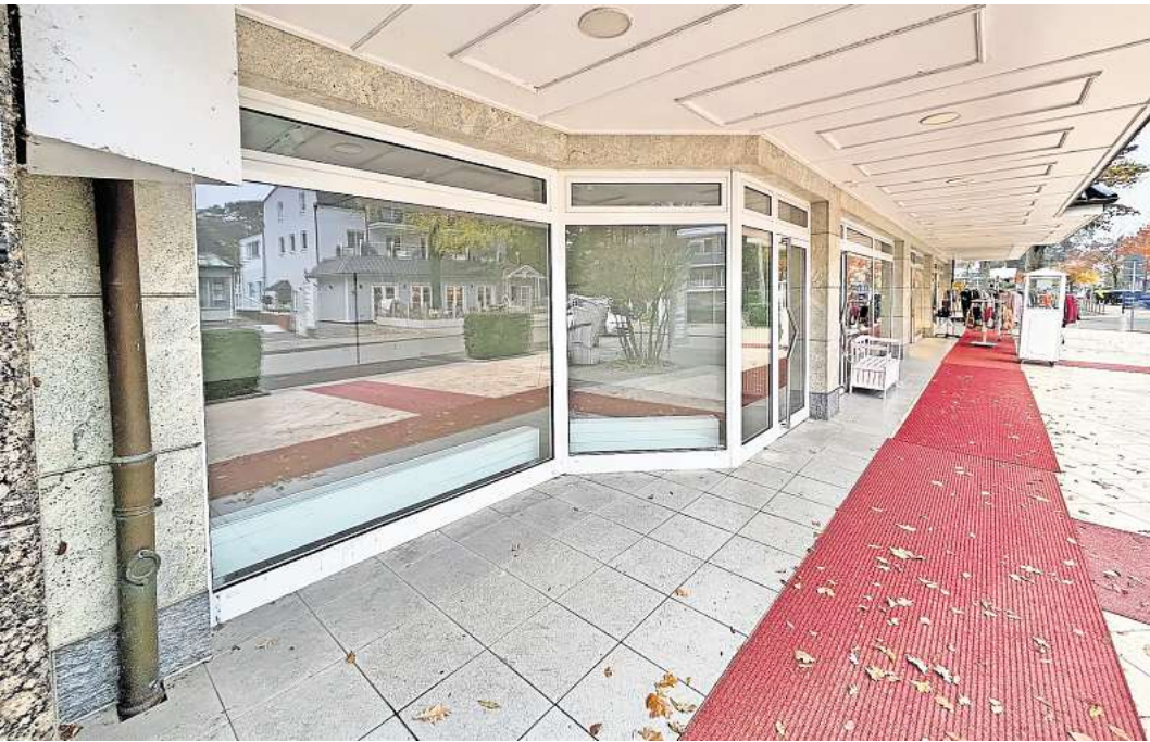
Vor diesem Geschäft an der Timmendorfer Strandallee wartet der rote Teppich vergebens auf interessierte Kundschaft: Der Laden ist leer.