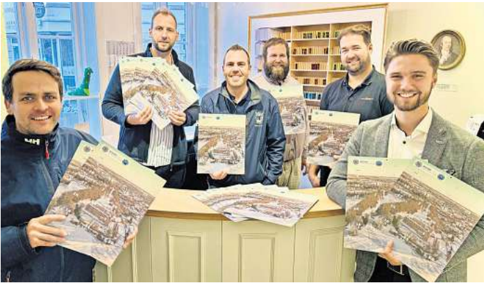
Mitglieder von Round Table präsentieren den Adventskalender 2024

Preise im Wert von rund 7000 Euro zu gewinnen.