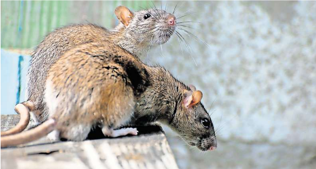
In Ostholstein vermehren sich die Ratten fast ungebremst.

Viele Anzeichen sprächen dafür, dass derzeit immer mehr private Grundstücke von den robus-