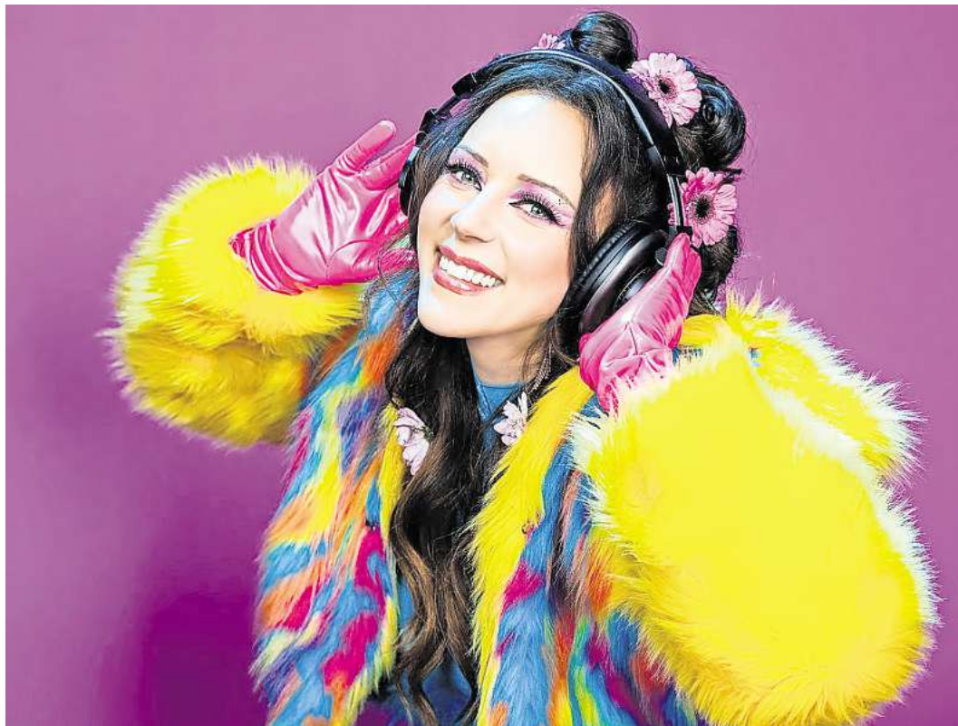
„Herz an Herz“: Blümchen ist eine wahre 90er-Ikone.

HEMMELSDORF. Die Freiwillige Feuerwehr Hemmelsdorf und der Dorfvorstand laden zum ersten Hemmelsdorfer Erntedankfest am 12. und 13. Oktober an der Feuerwache Hemmelsdorf ein. Geboten wird ein buntes Programm für die ganze Familie: Am Samstag gibt es um 14 Uhr eine Zaubershow für Groß und Klein, ab 18 Uhr Tanzmusik mit DJ Sascha Dobbert. Am Sonntag wird um 11 Uhr zum Erntedankgottesdienst geladen, um 12:30 Uhr spielt das Sinfonische Blasorchester des TSV Ratekau. An beiden Tagen steht für die kleinen Gäste eine Hüpfburg bereit. Kulinarisch wird eine große Auswahl an leckeren Kuchen und Torten angeboten, außerdem gibt es frisch Gegrilltes, herzhaftes Leberkäsebrötchen und Getränke.