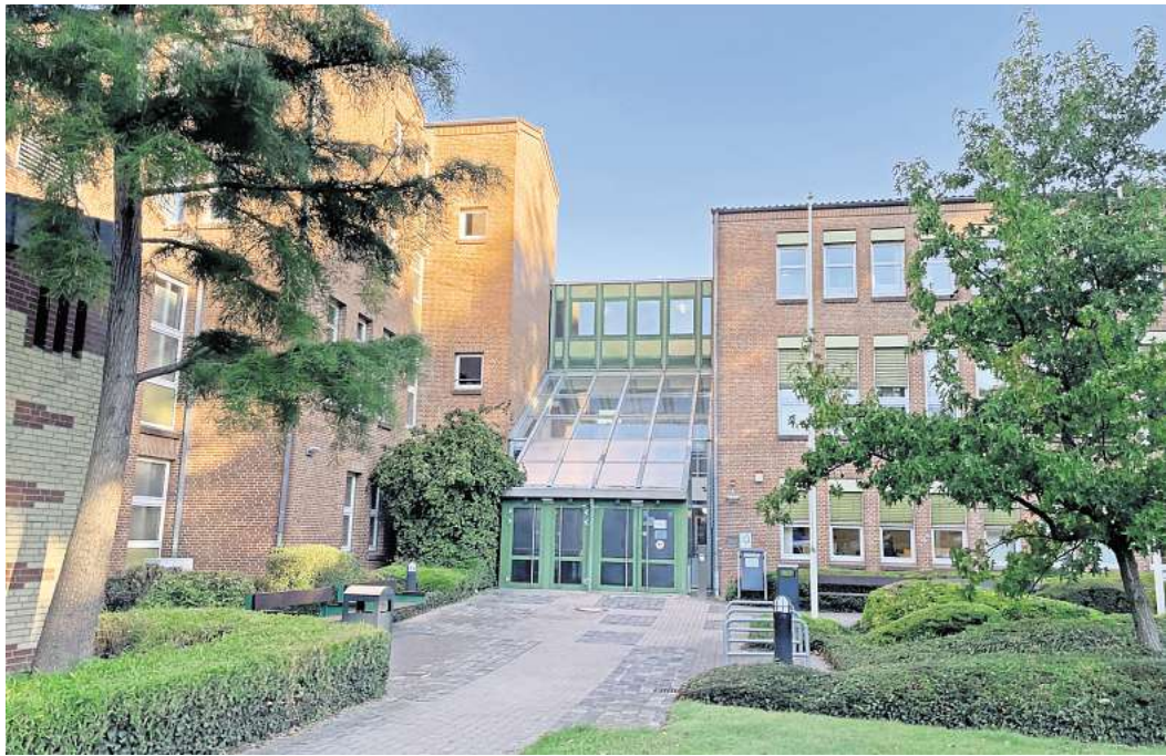
Das Amtsgericht in Eutin hat kaum Sanierungsbedarf, doch genügend Platz für eine Zusammenlegung mit dem Oldenburger Amtsgericht gibt das Gebäude nicht her. Das Resultat wäre ein Leerstand.

Zudem habe jedes Gericht seine eigenen Schwerpunkte. „In Oldenburg gibt es aufgrund der Nähe zu den psychiatrischen Ein-