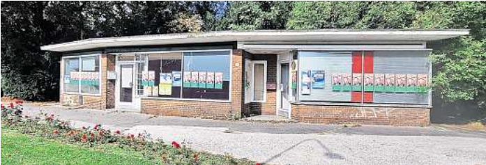
Das kleine Häuschen am Mühlentorteller steht leer.

brücke, während der das Gebäude, das im rückwärtigen Bereich auch über Sanitäranlagen verfügt, durch die Hansestadt Lübeck genutzt werden wird.“ Die Sanierung der Brücke wird mindestens zwei Jahre dauern. Was danach mit dem Häuschen passieren wird, ist derzeit noch unklar.