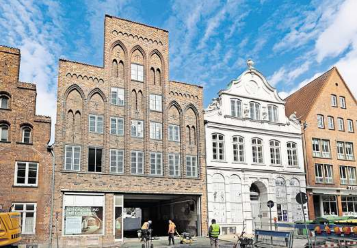
Der Umbau des Buddenbrookhauses in der Mengstraße kann jetzt weitergehen.