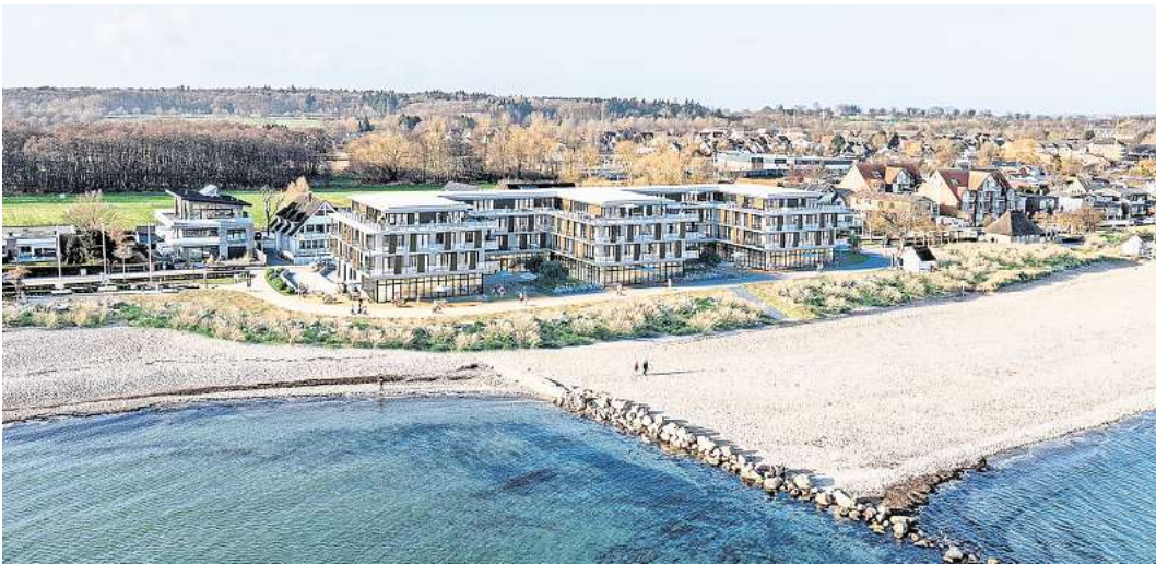
Top-Hotel in Top-Lage: So soll das Hotel der Hanseatic Group aussehen.