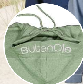
Kapuze mit Logo