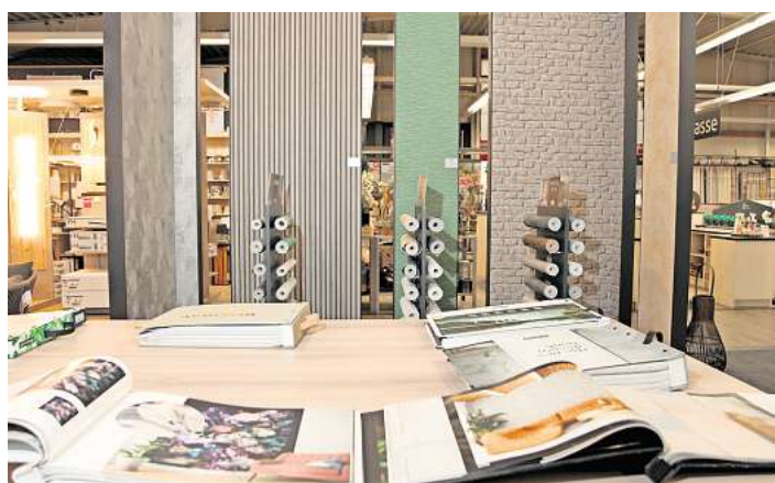
Muster über Muster – ob als Rolle, Schauwand oder Ansichtsbuch, bei Knutzen Home findet sich eine unfassbar große Auswahl an Tapeten.

Knutzen Home Industriestraße 12a, 23701 Eutin www.knutzen-home.de