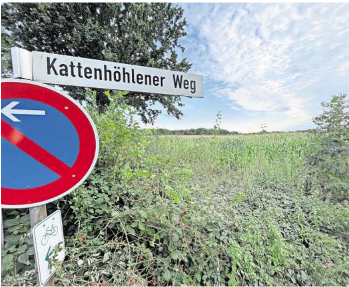
Auf dem Acker zwischen Kattenhöhlener Weg und Kammerweg soll das Neubaugebiet entstehen.

Für die erste Überraschung des Abends sorgte Henning Nitz von der FBB-Fraktion mit FDP. Statt für oder gegen das Baugebiet zu stim-men, kam er mit einem gänzlich